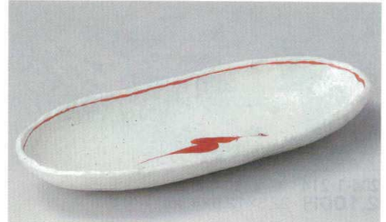
盛鉢 14P~ 206-1-284 御本手変型ダ円鉢 4,500円 33×18×4cm 14009282