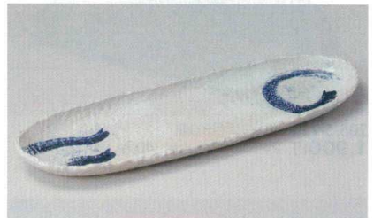
細長皿 128P~ 206-4-354 南蛮吹流し石目トレー皿 3,240円 33.2×14.8×3.8cm 19204353