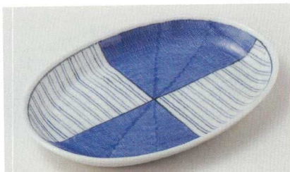
209-1-734 京ごのみ小判8.5皿 2,800円 26×19×2.6cm 24004731 209-2-734 京ごのみ小判7.5皿 1,780円 23.2×17.6×2.4cm 23105732