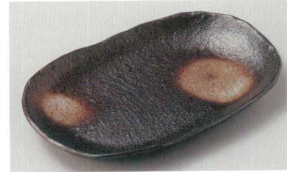
209-13-354 黒水晶ワラジ楕円皿 1,080円 27×18.3×2.8cm 24303351