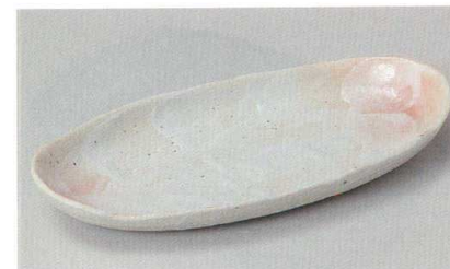
209-14-624 桜志野9.0小判皿 1,050円 26×12.9×1.7cm 20914624