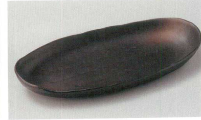
209-16-624 備前9.0小判皿 1,030円 26×12.9×1.7cm 24506621