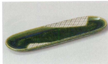
209-6-794 織部菱紋楕円長皿 1,550円 27.5×7.5×1.5cm 20906794