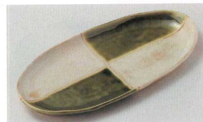
209-11-714 オリベ市松小判焼皿 1,150円 26×12.9×2cm 24505711