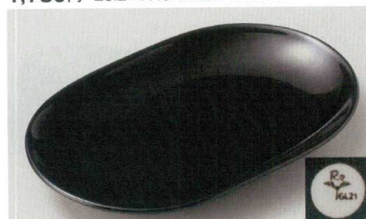
209-5-034 Pokela漆黒楕円8.5皿 1,600円 26.6×18×2.6cm 19706033