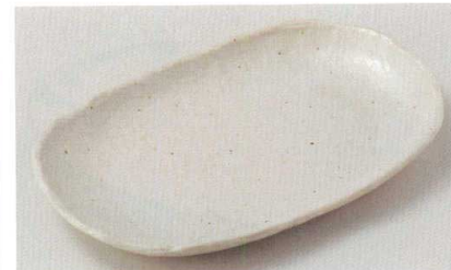
209-12-354 白粉引ワラジ楕円皿 1,080円 27×18.3×2.8cm 24304351