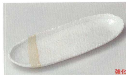
209-8-714 粉引塗分け9.0小判皿 1,500円 27×10.4×2cm 24502711