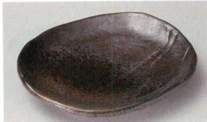
209-3-814 琥珀8.5とんかつ皿(萬古焼) 1,800円 25.5×22×4cm 57169812