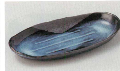
209-15-624 青流天目9.0小判皿 1,030円 26×12.9×1.7cm 24415621