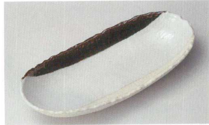
209-7-714 アメ塗分9.0舟型トレー 1,550円 27.5×11×2.5cm 23304712