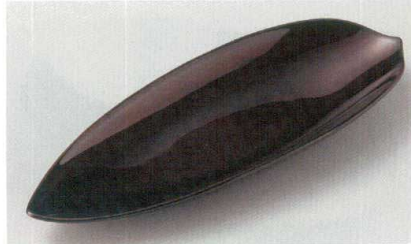
209-4-354 うるしブラウンハス型長皿大 1,770円 27.1×10.6×2.8cm 19604353