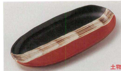
209-9-734 黒朱サビハケ楕円焼物皿 1,240円 25.5×12.8×1.8cm 19608733