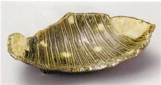
21-5-284 織部小紋しのぎ変形尺皿 4,400円 31.5×21×7cm 20入 01504282