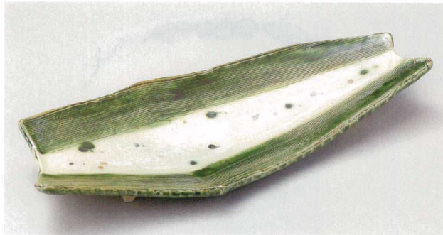
21-1-554 織部幾何紋15.0四つ足変形長盛皿 8,100円 48.5×19.5×4.7cm 02101554