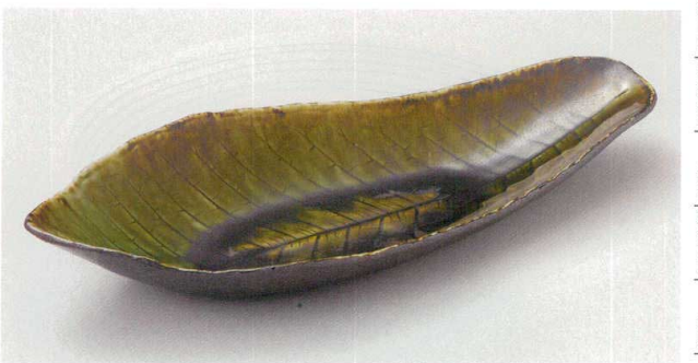
21-8-524 いぶし織部朴葉大鉢 3,400円 42.3×17.5×7cm 00704522