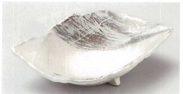
21-4-554 粉引刷毛くし目尺1寸鉢 4,400円 33×22.3×8cm 15入 00708552