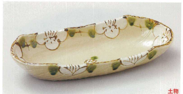
21-2-214 山茶花舟型盛鉢 4,900円 39.5×17×7cm 01104211