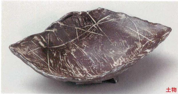
21-3-204 炭化土白刷毛目変形尺1鉢 4,700円 33×22.5×7.5cm 01507201