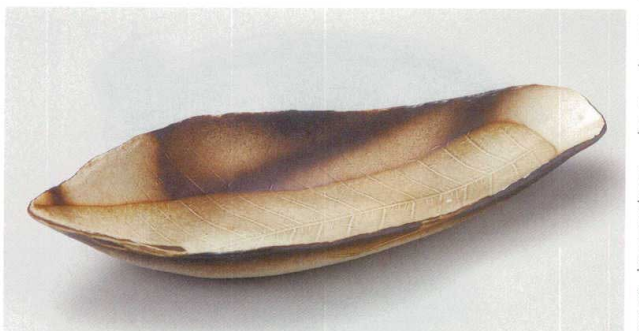
21-6-504 黒杉朴葉大鉢 3,500円 43×17.5×6.8cm 00703502