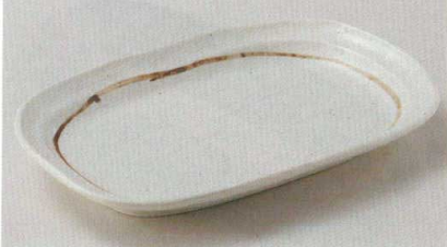
210-8-214 こくたん楕円皿 1,350円 23×13.5×3.5cm 21008214