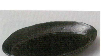
210-15-814 琥珀8.0小判皿(萬古焼) 890円 24×17×4cm 57166812