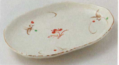
210-11-374 粉引ラインスバ皿 1,100円 24.5×16×3cm 21607371