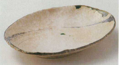
210-12-814 かすみ志野8.0小判皿(萬古焼) 1,050円 24.8×16.5×3.8cm 24711811