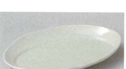
210-14-814 織部流線8.0小判皿(萬古焼) 890円 24×17×4cm 24112812