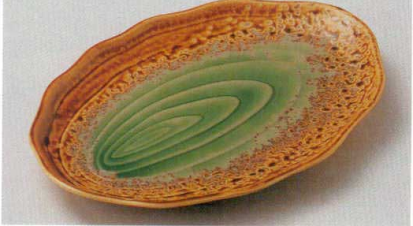
210-7-754 鉄釉一珍ライン小判鉢 1,390円 24.8×19.2×5.4cm 49306752