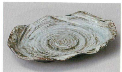
210-3-624 白刷毛8.0小判皿 1,730円 24.5×17×3.2cm 21003624 210-4-624 白刷毛5.5小判皿 800円 16.5×12×2.8cm 21004624