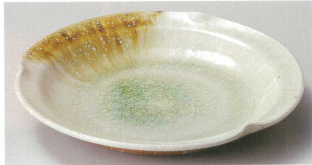
217-4-274 伊賀三ッ押尺深皿 6,700円 29.7×5cm 14107271