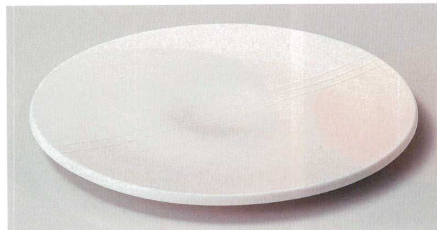
217-3-214 薄桃月憩いプレート 6,000円 30.3×2.2cm 21703214