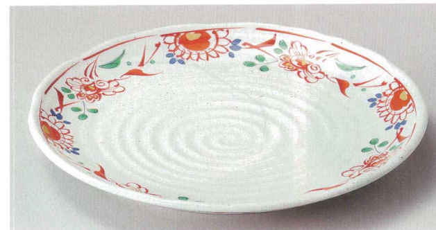
217-7-624 華万葉10.0皿 2,200円 30×3.5cm 30入 20509603