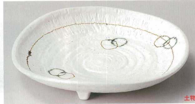
217-6-214 白釉彫入り三ツ足盛皿 4,700円 30×6cm 14401211