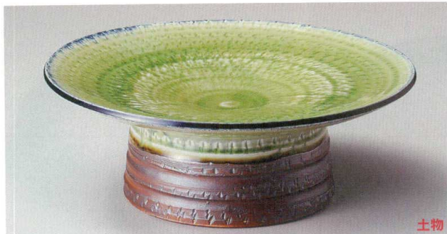
217-1-714 手造り灰釉10.0高台鉢 20,000円 30×11.5cm 14003711