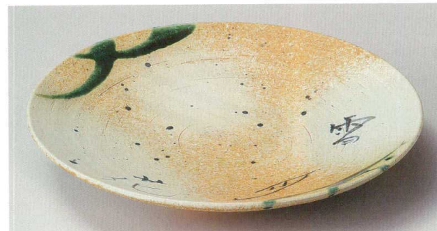
217-5-284 織部雪月花9.0皿 5,800円 28.5×4.5cm 15入 21705284