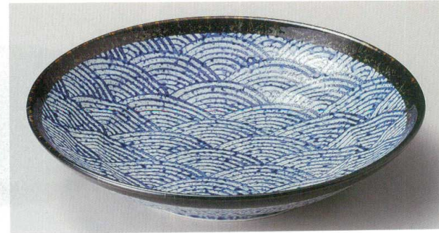
217-8-554 青海波9.5ミツワ皿 1,760円 28.8×6cm 20入 14612551