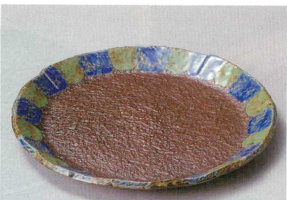
218-11-794 きらめき9.0丸皿 3,500円 28.5×2.5cm 16210792