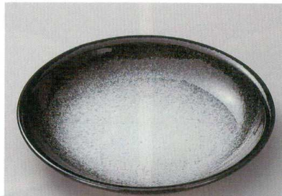
218-2-714 雲海10.0大皿 6,300円 28.8×4.7cm 55404781