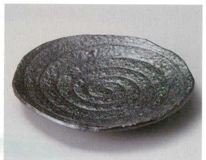
218-6-504 南蛮天目足付丸9.0皿 3,900円 26.5×4cm 14603501