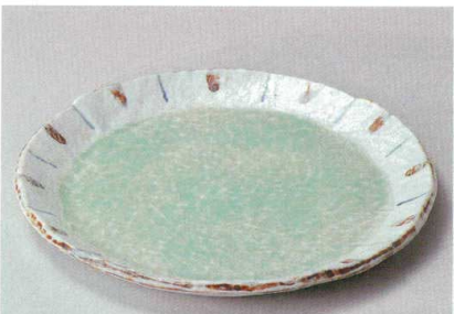
218-10-714 ヒワ釉瀬十草9.0丸皿 3,620円 28.7×2.8cm 21810714