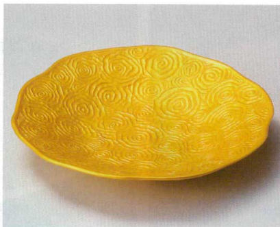
218-5-554 ゴールド渦彫9.0皿 4,500円 28.2×4.3cm 21805554