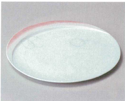
218-7-524 ピンク吹ラスター三日月フラットプレート(L) 3,850円 26.8×2.2cm 21807524