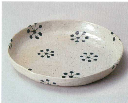
218-4-714 藍染9.0丸皿 4,640円 28×3.5cm 21804714