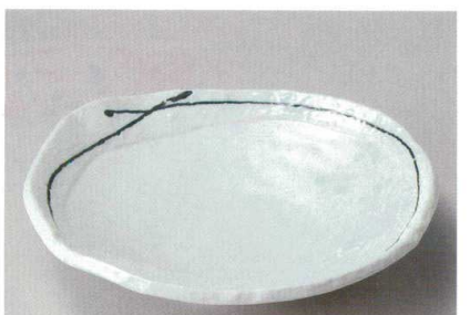
218-12-524 黒結び9寸盛込皿 3,200円 27.8×5.9cm 14503521