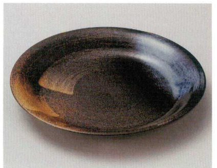
220-10-674 白雪丸9.0皿 1,500円 28.8×3.7cm 16107012