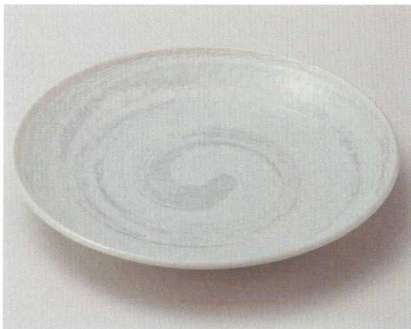
220-9-204 荒引大皿 2,200円 29×5.4cm 22009204