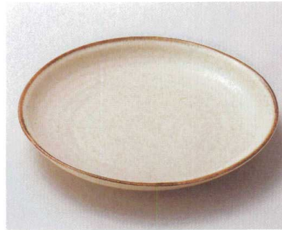
227-11-274 粉引7寸皿 960円 23×3.2cm 15913271