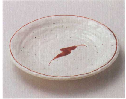
227-6-674 唐辛子7.0皿 1,850円 23×3.3cm 15615671