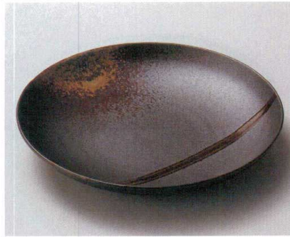
227-7-354 南蛮吹流し7.5皿 1,290円 23.3×3.8cm 15910351