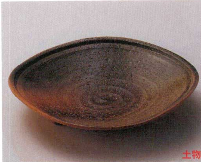
227-1-274 黒いぶし三ッ足7.5皿 4,400円 23×4.8cm 15701271