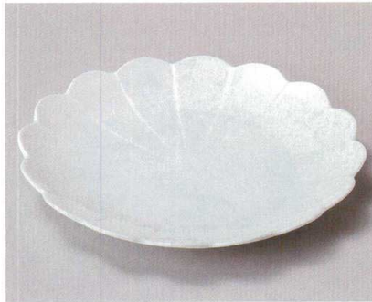
227-4-634 福寿草8.0皿 2,100円 23.5×2.4cm 22704634