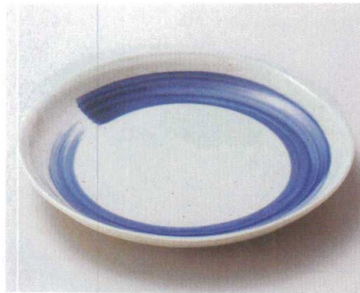
227-10-374 御深井大文字三ツ山7.0皿 960円 23.5×3.5cm 17010372