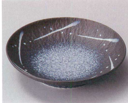
227-2-554 黒釉白一珍トナリ8.0高台皿 3,100円 23.5×5.3cm 22702554