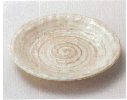
227-12-504 東風石目7.0皿 950円 23×3.2cm 14907501