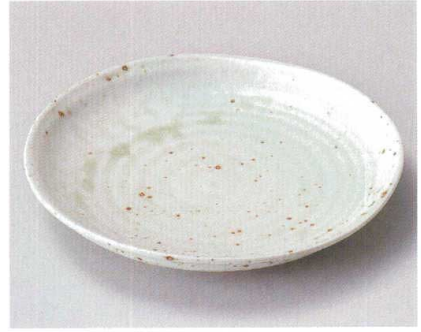
227-9-204 白いらぼ7.0皿 1,050円 23.3×3.4cm 22709204