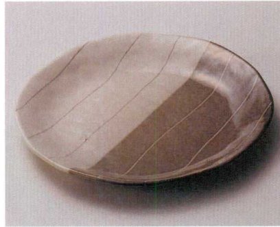
227-5-794 黒化粧晩夏7.5丸皿 2,100円 23.5×2.5cm 21707793