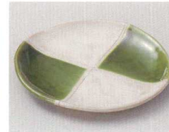
241-15-714 オリベ市松5.0皿 770円 15.3×14.7×1.7cm 25704711