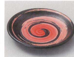
241-21-554 朱黒黒御影5.0皿 640円 15.2×2cm 24121554