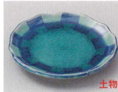
241-18-714 市松5.0フルーツ皿 680円 15.5×2cm 25514711