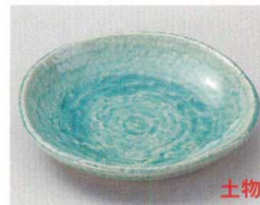
241-24-724 トルコ5.0フルーツ皿 560円 15.3×2.6cm 25524721