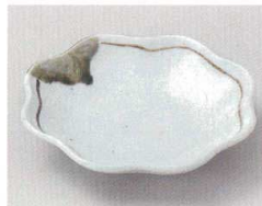
241-23-724 志野織部掛茶筋5.0フルーツ皿 580円 15.3×2.7cm 28327272