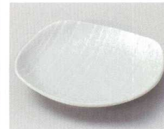
241-31-504 白木目四角取皿 270円 15.5×15.5×2.5cm 28532503

盛鉢 14P~ 楕円鉢 細鉢 38P~ 刺身 向付 46P~ 中鉢 小鉢 64P~ 小付 珍珠 100P~ 細長皿 128P~ 突出皿 焼物皿 142P~ 仕切皿 のり皿 串焼皿 161P~ 盛皿 166P~ 角皿 (鉢類) 174P~ 楕円皿 206P~ 丸皿 212P~ 和皿 前菜皿 7~7.5寸 235P~ 細小皿 小皿 252P~ 有田焼大皿 萬古焼大皿 264P~ 組皿 (大) 270P~ 天皿 吞水 取鉢 280P~ 松花堂 288P~ 蓋向 煮物碗 円菓子碗 298P~ むし碗 306P~