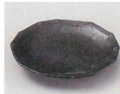
241-29-504 天目12角銘々皿 270円 15.5×2cm 24129504