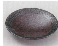
241-25-034 ショコラ取皿 520円 15.5×2.5cm 28320032