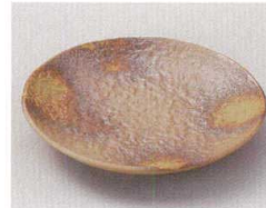
241-14-374 美膳岩5.0皿 770円 15.5×2.7cm 25702371