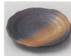
241-26-374 黒備前吹き銘々皿 390円 15.2×14.5cm 25528371