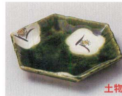
241-8-364 織部椿6角皿 880円 15.5×13.5×1.8cm 25504361