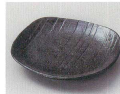
241-30-504 黒木目四角取皿 270円 15.5×15.5×2.5cm 28527503