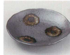
241-20-354 南蛮吹銘々皿 660円 15.2×2.5cm 28026352