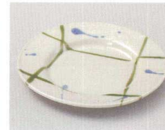
241-4-794 乱舞フルーツ皿 980円 15.4×14.5×1.6cm 28222792