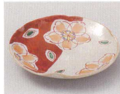
241-2-714 錦花紋5.0皿 1,550円 15.3×15.3×2.8cm 24102714