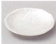
241-28-504 粉引12角銘々皿 270円 15.5×2cm 24128504