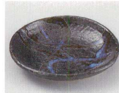
241-19-554 黒柚桂川丸5.0皿 660円 15.2×2.6cm 80入 28122552