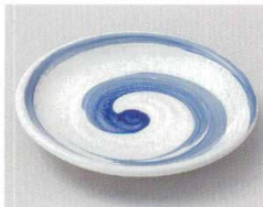
241-22-554 青嵐粉引5.0皿 640円 15.2×2cm 24122554