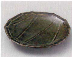
241-27-504 織部12角銘々皿 270円 15.5×2cm 24127504