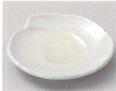
241-12-524 ヒワ吹巻型フルーツ皿 850円 15.4×3cm 24112524