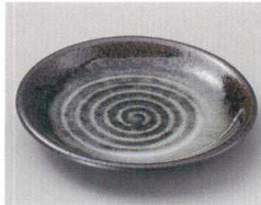
241-17-114 おぼろ月5.0皿 730円 15.2×2cm 24117114