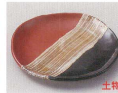
241-9-734 黒朱サビハケ5.0プレート 870円 15.5×14.7×1.6cm 28020732