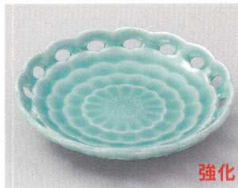
241-1-554 深海青地透かしフルーツ皿 1,700円 15.3×3cm 25408551