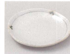
241-10-714 みつば5.0取皿 850円 15.5×1.7cm 24110714 241-11-714 みつば4.0丸皿 630円 12.7×1.7cm 24111714