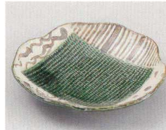
241-13-274 織部チリ花型5.0取皿 800円 15.5×15.5×3cm 27625273