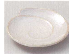
241-16-114 彩釉うず銘々皿 710円 15.5×15×3cm 28027112