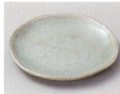
241-7-714 白雲5.0取皿 950円 15.3×1.8cm 24107714