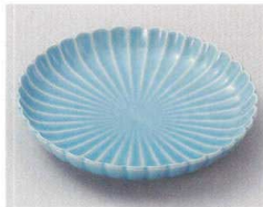
241-6-194 トルコ菊型5.0皿 950円 15.5×2.7cm 60入 27615193