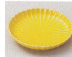
241-5-194 黄菊型5.0皿 950円 15.5×2.7cm 60入 27614193