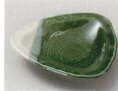
243-10-214 織部ヌリ分三角フルーツ皿 700円 15×3cm 24310214