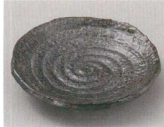
243-11-504 南蛮天目足付丸4.8皿 700円 14.3×3cm 24311504