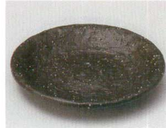
243-25-354 黒伊賀風4.5皿 630円 14.1×1.9cm 24325354