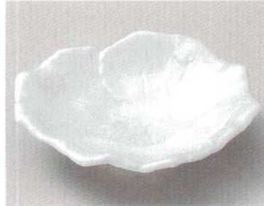
243-6-524 青白磁葉型取皿 980円 14.5×13×4cm 28309523