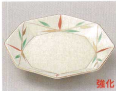
243-1-714 金彩芦八角5.0皿 1,800円 14.5×2.2cm 27802783