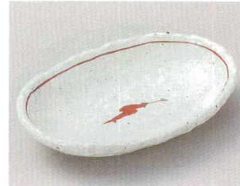
243-4-674 唐辛子4.5小判皿 1,050円 14.5×9.3×2.5cm 27804671