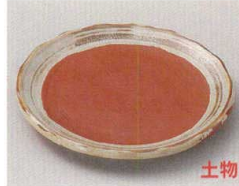
243-8-734 朱サビハケ取皿 760円 14.5×1.7cm 25706731