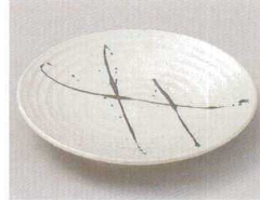
243-15-714 やすらぎ銘々皿 580円 13.2×1.8cm 25917711