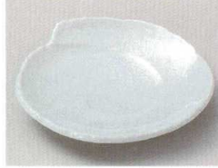
243-18-674 白シエル銘々皿 620円 15×2.7cm 28315672