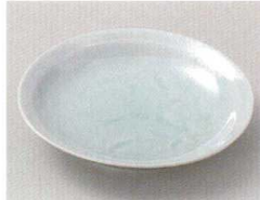
243-23-374 青白磁つゆ草フルーツ皿(美濃焼) 520円 14.8×2.5cm 27917373