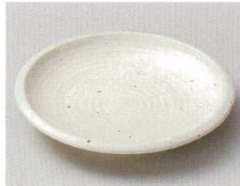
243-28-204 白マツくくりて4寸皿 350円 14.4×2.2cm 28528202