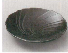
243-20-034 紺斑点取皿 600円 14.3×2.7cm 24320034