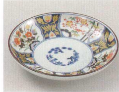
243-7-694 染錦紋様取皿(有田焼) 850円 14.5×3cm 10入 24307694