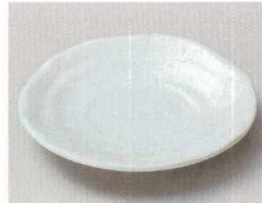
243-30-504 白楕円うず取皿 280円 15×14.5×2.3cm 24330504