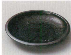
243-29-204 黒マツくくりて4.0皿 350円 14.4×2.2cm 27928203