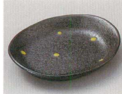
243-13-354 黒ゆず黄水玉銘々皿 690円 15×12.2×2.5cm 28307352