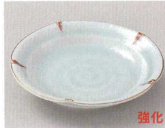
243-2-714 赤絵青磁花型フルーツ皿 1,600円 15×3cm 25406711