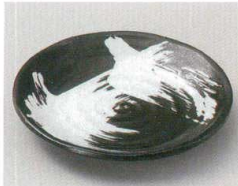
243-27-204 白刷毛六兵衛4.0皿 440円 14.2×2cm 27922203