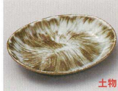
243-12-354 益子荒刷毛銘々皿 690円 15×12.2×2.5cm 28315353