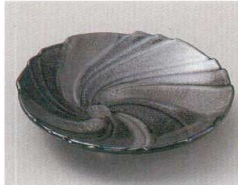
243-22-554 銀彩風車14cm取皿 560円 14.3×2.7cm 24322554