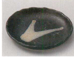
243-19-204 銀彩黒4.5丸皿 600円 14.5×2cm 28517202