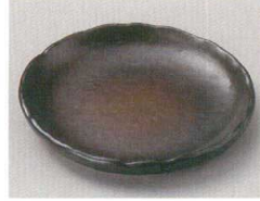
243-21-204 備前風4.5丸皿 600円 14.3×2cm 25920201