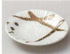
243-24-754 金色流し取り皿 510円 14.5×2.5cm 24324754