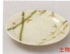
243-5-714 草紋織部5.0丸皿 950円 15×2.1cm 25420711