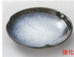
243-3-714 雲海三ツ押5.0丸皿 1,340円 14.8×3.2cm 55410781