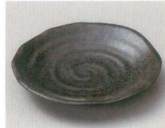
243-31-504 黒楕円うず取皿 280円 15×14.5×2.3cm 24331504

盛鉢 14P~ 楕円鉢 組鉢 38P~ 刺身 向付 46P~ 中鉢 小鉢 64P~ 小付 珍味 100P~ 細長皿 128P~ 突出血 焼物皿 142P~ 仕切皿 のり皿 串焼皿 161P~ 盛皿 166P~ 角皿 (踏鉢) 174P~ 楕円皿 206P~ 丸皿 212P~ 和皿 前菜皿 7ル=9証 235P~ 組小皿 小皿 252P~ 有田焼大皿 瀬古焼大皿 264P~ 組皿 (大) 270P~ 天皿 吞水 取鉢 280P~ 松花堂 288P~ 蓋向 煮物碗 円菓子碗 298P~ むし碗 306P~