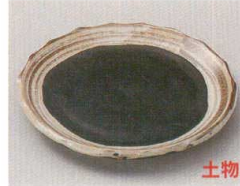
243-9-734 黒サビハケ取皿 760円 14.5×1.7cm 25707731