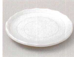
243-14-714 やすらぎ5.0取皿 680円 14.5×1.8cm 25708711