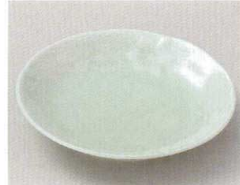
243-26-374 もえぎ鉄仙フルーツ皿(美濃焼) 480円 14.8×2.5cm 27714373