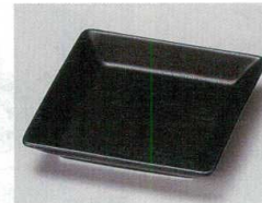
251-28-754 シンプル黒マット正角皿 490円 11.8×11.8×2.2cm 28628753