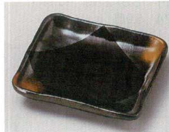
251-6-054 ビードロ正角皿 1,100円 12.3×12.3×2cm 28431053