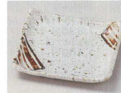
251-14-714 うのふストライプ4.0角皿 690円 12×12×2.5cm 28524713