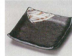
251-15-794 黒伊賀十草4.0角皿 680円 12.3×12.2×2.5cm 28620793