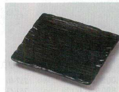
251-22-634 十草千筋角小皿黒マット 600円 12×12×1.5cm 28624633