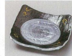
251-5-354 南蛮銀彩角銘々皿 1,140円 12.4×12×3.2cm 25827351