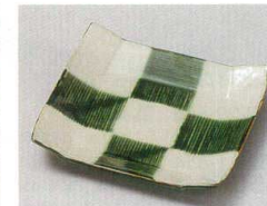
251-20-204 織部市松コヨリ取皿 650円 12.1×12.1×1.7cm 25120204