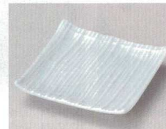
251-23-714 スタレ銘々皿 600円 11.6×11.6×2.5cm 28627713