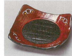
251-4-354 南蛮赤絵角銘々皿 1,140円 12.4×12×3.2cm 26005351