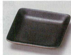
251-12-714 黒釉スワン角取皿 720円 12×12×2.3cm 25112714