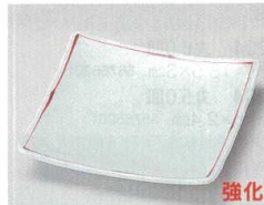
251-11-794 赤ライン正角銘々皿 760円 12×12×1.8cm 28613793