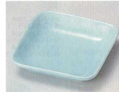
251-13-674 深山青磁角小皿 720円 10.6×10.6×1.9cm 54878671