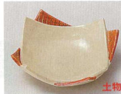
251-2-714 赤絵重ね皿(小) 1,510円 11×11×3.6cm 25809711