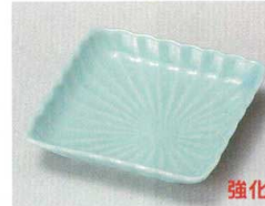
251-3-354 翡翠菊形角皿 1,170円 11.5×11.5×2cm 28703353