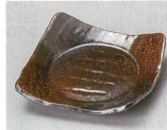
251-7-354 南蛮吹流し角銘々皿 920円 12.4×12×3.2cm 26022351