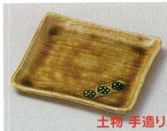
251-1-734 黄瀬戸角銘々皿 2,030円 12×12×1.6cm 26402731