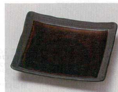
251-17-714 アメ釉潤黒銘々皿 660円 12.4×12.4×2cm 90入 28713783