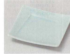
251-9-374 青白磁四寸角皿(美濃焼) 800円 11×11×1.4cm 28708373