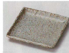
251-27-714 益子結晶銘々皿 500円 11.8×11.8×1.8cm 26417711