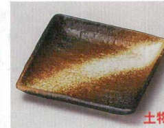
251-29-714 黒備前銘々皿 430円 12×12×1.7cm 26426781