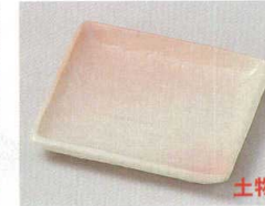
251-30-714 桜志野角銘々皿 430円 12×12×1.7cm 26428781