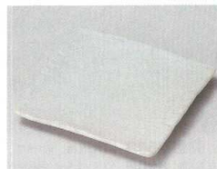
251-21-634 十草千筋角小皿うのふ 600円 12×12×1.5cm 28625633