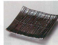
251-24-714 鉄砂スタレ銘々皿 600円 11.6×11.6×2.5cm 28717713