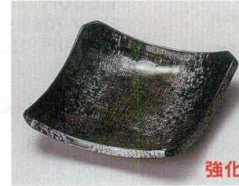
251-8-714 黒緑彩銘々皿 900円 11×11×2.5cm 100入 28707783