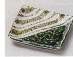
251-10-704 織部ストライプ正角銘々皿 770円 12.5×12.5×2cm 25110704