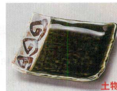
251-18-714 織部ライン角銘々皿 660円 12.2×12.2×2.3cm 90入 28715783