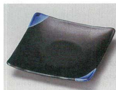
251-16-724 ルリ黒マット4.0正角皿 660円 12.5×12.5×1.7cm 28531723