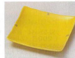
251-19-714 黄釉二彩正角銘々皿 650円 12.2×12.2×1.9cm 25119714