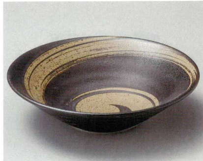
26-5-274 武蔵野リップル8.0鉢 2,200円 26.2×7cm 01513271