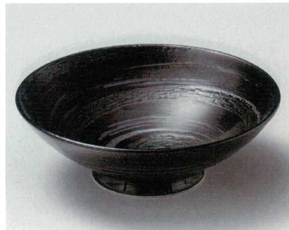
26-11-554 早瀬黒8.0麵鉢 1,200円 24.5×7cm 02611554