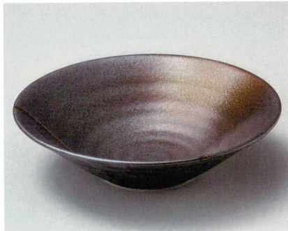
26-1-354 南蛮吹流しリップル8.0鉢 2,820円 26.2×6.9cm 02211352