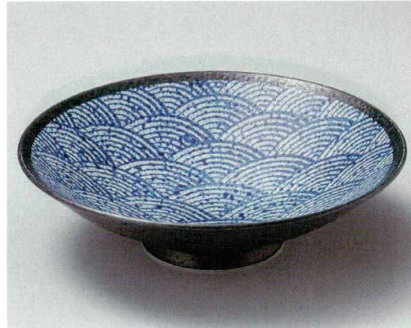
26-6-554 青海波黒9.0盛鉢 1,750円 28.3×7.5cm 02606554