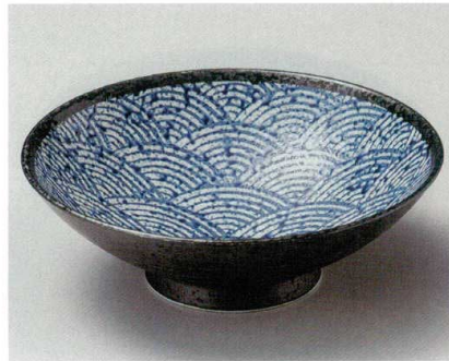
26-9-554 青海波黒8.0麵鉢 1,240円 24.5×7cm 02609554