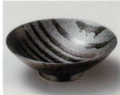
26-13-554 流彩ライン黒8.0麵鉢 1,200円 24.5×7cm 02613554