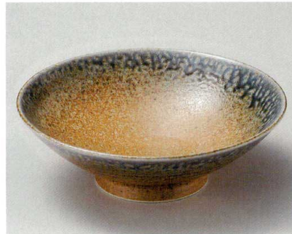
26-12-554 砂地藍流し8.0麵鉢 1,200円 24.5×7cm 02612554