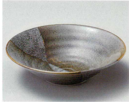
26-3-654 山がすみリップル8.0鉢 2,100円 26.4×7cm 01413651