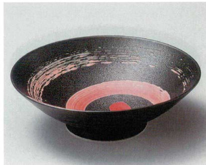
26-8-554 朱嵐黒御影8.0麵鉢 1,500円 24.5×4.7cm 02608554