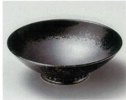
26-10-554 黒真珠8.0麵鉢 1,200円 24.5×7cm 02610554