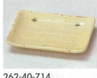
262-40-714 黄瀬戸織部角小皿 270円 10.5×8×1.6cm 27839711