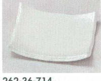
262-36-714 ちぎり白小皿 350円 9×9×1.5cm 26236714