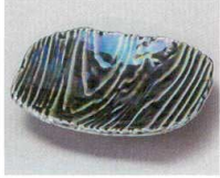
262-11-214 光彩木目角皿 680円 10×9.2×2cm 29302213