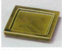
262-23-274 鉄織部角皿 小 520円 9.5×9.5×1.5cm 27814271