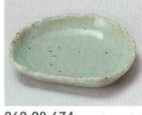
262-28-674 益子均窯半月小皿 400円 9.8×8.8×1.5cm 26228674