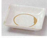
262-21-724 白釉丸抜正角銘々皿 560円 10.8×10.8×2.6cm 29427723