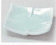
262-24-204 青白磁組皿 520円 8×8×1.7cm 27730201