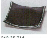
262-35-714 ちぎり黒小皿 350円 9×9×1.5cm 26235714