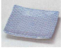
262-17-524 青海波10cm角小皿 600円 10.2×10.2×1.8cm 26217524