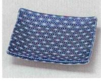
262-18-524 麻の葉 (濃紺) 10cm角小皿 600円 10.2×10.2×1.8cm 26218524