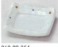
262-29-354 二色水玉角小皿 400円 7×6.8×1.7cm 30114352