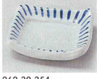
262-30-354 線十草角小皿 400円 7×6.8×1.7cm 29825353