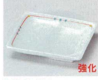
262-19-704 胸筋長角変り千代久 570円 9.3×8×1.5cm 26219704