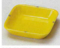
262-22-714 黄釉二彩正角小皿 550円 8.2×8.2×1.8cm 26222714