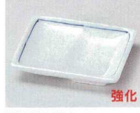
262-20-704 青ライン長角変り千代久 570円 9.3×8×1.5cm 26220704