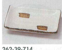
262-39-714 志野刷毛目角小皿 270円 10.5×8×1.6cm 27841711