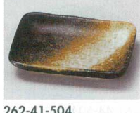
262-41-504 備前風長角小皿 260円 10.5×8.2×1.8cm 26241504