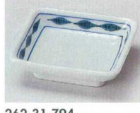
262-31-794 点十草小皿 390円 8.5×7.6×2.5cm 27739791