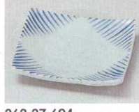
262-27-694 千筋松華堂角小皿 450円 10×10×1.5cm 10入 31133692