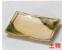
262-2-734 織部手起長角小皿 830円 11×9×1.6cm 27831731