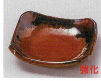
262-15-714 みのり正角3.0皿 630円 8.7×8.7×2.3cm 26215714