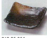
262-25-354 備前風金茶吹正角チョウ 490円 8.5×8.5×2.5cm 30025352