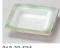
262-32-524 ヒ7吹正角小皿 (267-04) (中国製) 380円 9×9×2cm 10入 27604521