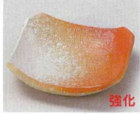
262-12-704 雪どけ3.0正角皿 670円 8.7×8.7×2.3cm 29328703