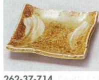
262-37-714 黄灰釉角小皿 350円 10.5×10.5×2cm 26237714