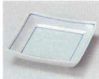
262-4-254 呉須線角小皿 800円 10×10×2cm 27216251