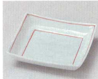
262-3-254 赤線角小皿 1,000円 10×10×2cm 30005252