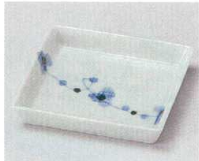
262-5-694 帯花紋 (青) 角小皿 (有田焼) 800円 8×8×1.4cm 10入 26205694