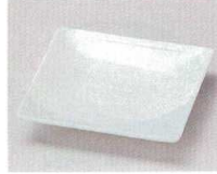
262-8-654 そぞ正角小皿 白 720円 9×9×1.7cm 26208654