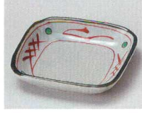
262-16-714 赤絵小皿 620円 8×8×1.5cm 27907781