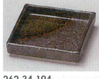
262-34-194 黒伊賀角小皿 370円 7.7×7.7×1.3cm 27740191