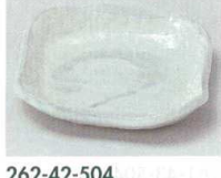
262-42-504 アジアン粉引正角小皿 230円 10.2×10.2×1.8cm 26242504