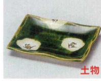
262-13-364 織部椿角小皿 660円 11.5×9.3×1.6cm 27832361