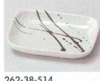
262-38-514 黒筆流粉引釉長角小皿 280円 10.6×8.2×1.5cm 30039512