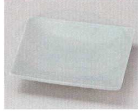
262-9-654 そぞ正角小皿 青白 720円 9×9×1.7cm 26209654