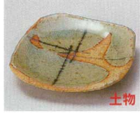
262-10-714 灰釉タタキ3.0皿 720円 9.5×9.5×2.6cm 29303713