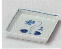
262-7-694 すみれ角小皿 (有田焼) 570円 8×8×1.4cm 10入 26207694