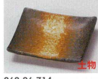
262-26-714 黒備前正角小皿 400円 10×10×2cm 30030781