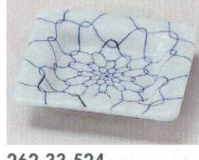
262-33-524 網目正角小皿 (267-34) (中国製) 380円 9×9×2cm 30026522