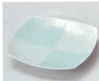
262-1-694 青磁市松角小皿 (有田焼) 1,450円 10×10×2cm 5入 26201694