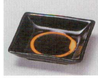
262-14-724 黒釉丸抜正角銘々皿 630円 10.8×10.8×2.6cm 26214724