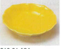
263-36-194 黄桔梗型3.0皿 360円 10.1×2.2cm 200入 29537193