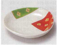
263-22-694 小花三角姫小皿 480円 8.5×8.5×1.5cm 10×16入 27909691