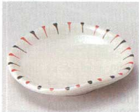
263-37-714 二色十草(赤)たわみ小皿 350円 9.2×8.3×2.2cm 29547173