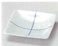
263-1-694 チェックプレート(SS)B(有田焼) 1,000円 9×9×2cm 5入 26301694