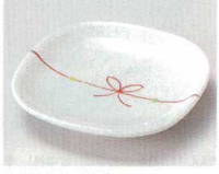
263-28-694 結び四方姫小皿 450円 8.5×8.5×1.5cm 10×24入 29815693