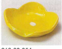
263-32-354 黄梅小皿 420円 7.8×7.2×1.7cm 30111352