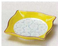
263-4-694 黄さくら角小皿(有田焼) 900円 8.5×8.5×1.7cm 10×16入 27914691