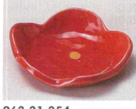
263-31-354 赤梅小皿 420円 7.8×7.2×1.7cm 30110352