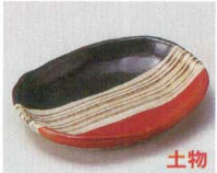
263-17-734 黒朱サビハケ楕円豆皿 550円 10.5×8.2×1.6cm 27925731