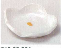
263-33-354 白梅小皿 400円 7.8×7.2×1.7cm 30112352