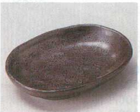
263-41-504 錆天目小判小皿 200円 9.3×7.2×1.9cm 29935503