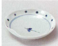
263-14-694 千鳥水玉小皿(有田焼) 750円 10.5×10×2.5cm 10×16入 27822691