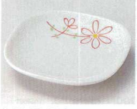
263-29-694 小菊四方姫小皿 450円 8.5×8.5×1.5cm 10×24入 29813693