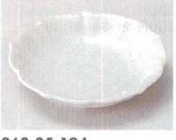
263-35-194 青白桔梗型3.0皿 360円 10.1×2.2cm 200入 29538193