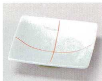
263-2-694 チェックプレート(SS)R(有田焼) 1,000円 9×9×2cm 5入 26302694