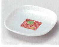
263-25-694 波もみじ四方姫小皿 450円 8.5×8.5×1.5cm 10×24入 29816693