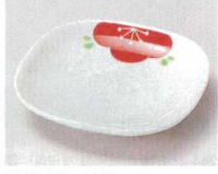
263-26-694 紅梅四方姫小皿 450円 8.5×8.5×1.5cm 10入 30024692