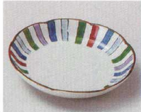
263-15-694 錦十草小皿(有田焼) 650円 10.5×2cm 5×48入 29331693