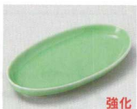
263-6-194 ヒワ楕円小皿 700円 13.5×7.1×1.7cm 29516192