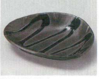
263-30-724 黒織部流し三角型小皿 450円 12.3×10.2×2.2cm 17613721