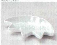
263-10-694 晴(竹)豆皿(有田焼) 860円 7.5×12×2cm 5入 26310694