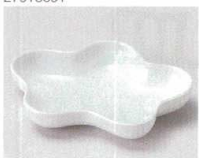
263-11-694 晴(梅)豆皿(有田焼) 860円 8.5×11×2cm 5入 26311694