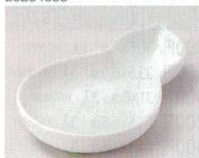
263-9-694 晴(瓢)豆皿(有田焼) 860円 7×11.5×2cm 5入 26309694