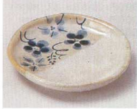
263-21-794 雪化粧藍花3.3小皿 480円 9.8×1.9cm 29425793