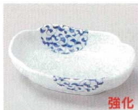
263-3-054 タコ唐草木甲皿 990円 11×8×3cm 29204053