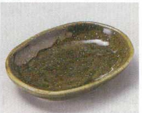
263-42-504 錆部小判小皿 200円 9.3×7.2×1.9cm 29934503