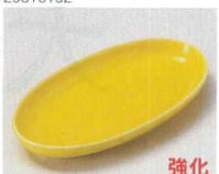
263-12-194 黄楕円小皿 700円 13.5×7.1×1.7cm 29515192