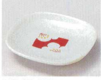
263-27-694 白梅四方姫小皿 450円 8.5×8.5×1.5cm 10×24入 29814693