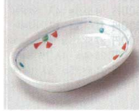
263-19-054 手描き割花小判型小皿 530円 9.8×8.2×1.8cm 29612052