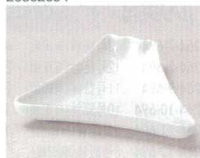
263-8-694 晴(山)豆皿(有田焼) 860円 7×11×2cm 5入 26308694