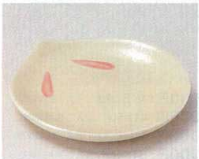
263-39-714 うさぎ小皿 350円 8.8×8.6×1.2cm 29630713