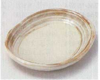
263-24-794 くりちよこ小判小皿 450円 10.5×8×1.3cm 27927791