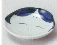
263-13-694 お福さん小皿(有田焼) 750円 10.5×10×2cm 10入 27821691