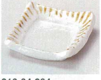
263-34-284 サビ十草三二角小皿 400円 6.7×2cm 150入 30117282