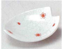
263-16-694 さくら桜鉢 650円 11.6×9.5×3.5cm 10入 29526692