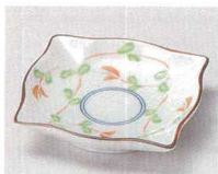
263-5-694 廻り赤絵角小皿(有田焼) 700円 8×8×1.7cm 10×16入 27913691