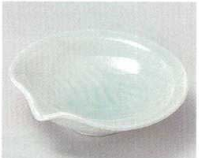
263-18-214 青白磁彫片口3.3皿 540円 10.5×11×3cm 27212211