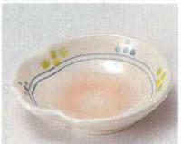
263-40-714 萩風早春瓢型小皿 260円 9.5×2.5cm 56220781