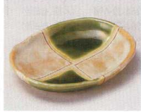
263-20-714 オリベ市松小判小皿 520円 10.6×8.2×1.7cm 27926711