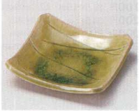
263-23-714 ビーロ口銘々皿 560円 11.9×11.9×1.7cm 26420711