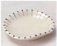
263-38-714 二色十草(青)たわみ小皿 350円 9.2×8.3×2.2cm 29542713