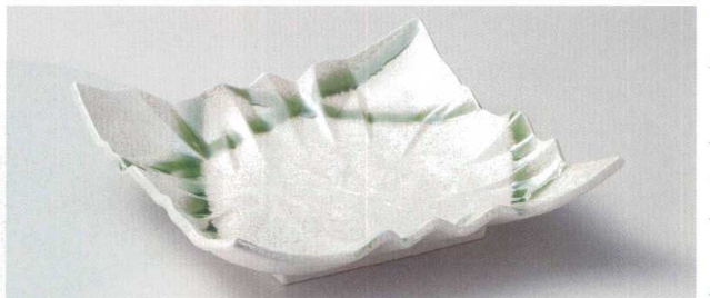
265-9-694 錦ラスターグリーン格子折紙10号皿(有田焼) 18,500円 32.5×32.5×9cm 2入 26509694