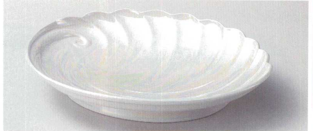
265-2-694 ラスターあわび盛込皿(有田焼) 28,000円 41×33×6.7cm 1入 22916693