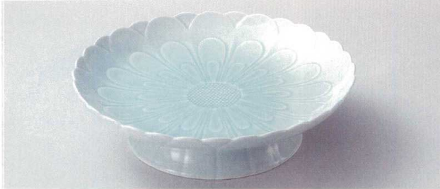
265-1-694 青白磁菊彫高台盛皿(有田焼) 39,500円 36.5×9.5cm 1入 16715691