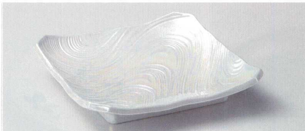
265-8-694 ラスター渦盛皿(有田焼) 13,000円 31.5×31.5×6cm 1×6入 16707691