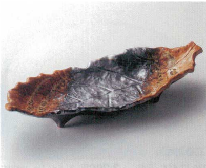
269-4-814 南蛮一珍13.0木ノ葉皿(萬古焼) 2,500円 41×17.5×5.5cm 17111811