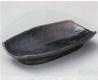
269-7-814 琥珀10.0長角盛皿(萬古焼) 1,950円 31×18.5×5.5cm 57161812