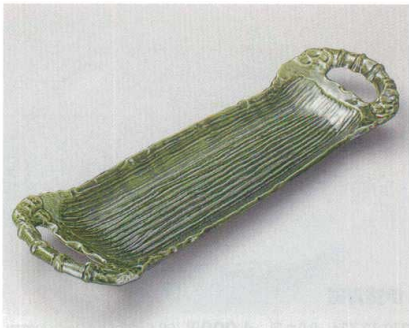
269-6-814 織部16.0手付長皿(萬古焼) 3,200円 50×17.3×5.8cm 17113811