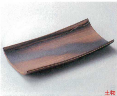
269-9-814 13.0小判皿(萬古焼) 3,200円 39.5×29.3×3cm 15610812 269-10-814 11.0小判皿(萬古焼) 2,650円 33.7×25.5×3cm 15611812