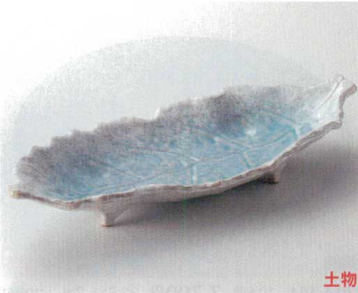
269-1-814 砂ビードロ13.0木ノ葉皿(萬古焼) 2,500円 41×17.5×5.5cm 17110811