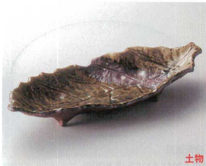
269-2-804 青雲13号葉形皿(萬古焼) 2,300円 41×17.5×5.5cm 20入 23203803