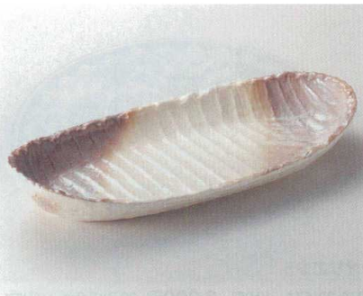
269-8-814 かすみ志野12.0舟形皿(萬古焼) 2,500円 37.5×18.5×5cm 17112811