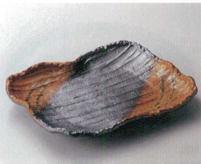
269-12-814 南蛮一珍12.0角大皿(萬古焼) 5,100円 37×31×4.7cm 13509812