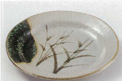
織部ヌリ分芦 土物

279-1-524 深口丸6.5皿 2,900円 20×2.7cm 16008521 279-2-524 深口丸5.5皿 2,000円 17.8×2.2cm 16007521