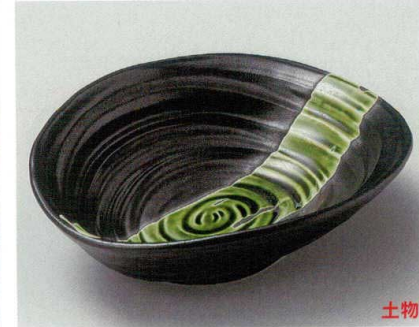
28-13-214 織部流したわみ鉢 2,300円 24.8×21.7×7cm 02007213