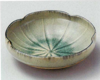
28-1-794 御深井花型大鉢 6,600円 24.5×7.4cm 01703793