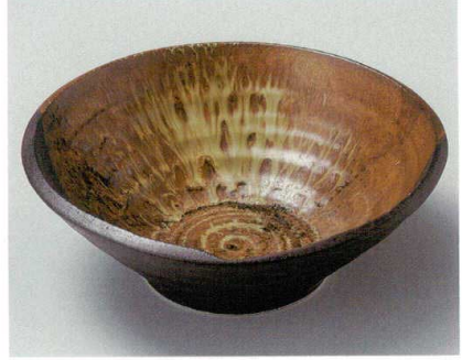
28-3-054 武山富士型8.5鉢 4,400円 26×8.6cm 03221051 28-4-054 武山富士型7.0鉢 2,500円 23×6.5cm 03220051