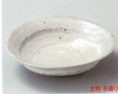
28-2-254 粉引ひねり8寸鉢 7,350円 25.3×24×7.1cm 01605252