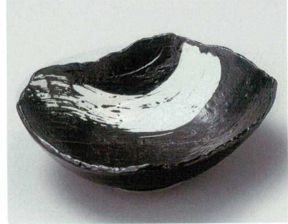
28-7-374 黒炭白刷毛大鉢(美濃焼) 4,200円 27×23×8cm 01705373