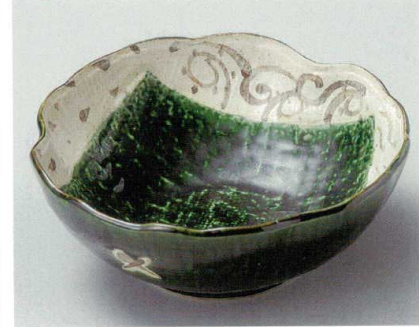
28-10-504 織部とちり8.0深鉢 2,700円 24×9cm 01908503