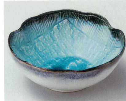
28-9-284 スカイ手作り風鉢(大) 3,550円 24×9.5cm 20入 02809284