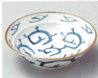
28-8-184 手描唐草8.0浅井 3,500円 24.9×7.8cm 76807183