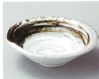
28-11-254 白茶刷毛たわみ鉢(大) 3,400円 26×25×7.8cm 02006252