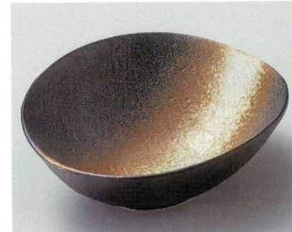
28-12-504 備前風変型大鉢 2,650円 24×20.5×8.8cm 02307501