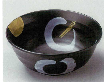
28-6-214 銀彩花7.5鉢 3,600円 23×9.4cm 02211211