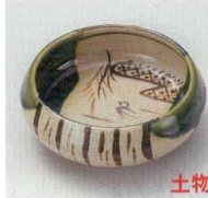
288-9-714 織部松型鉢 2,400円 12×8.3×3cm 29218711 288-10-714 織部丸千代口 1,200円 5×3.5cm 29219711