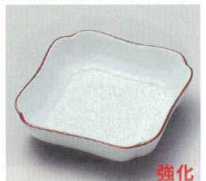
288-27-354 緑彩花四角小鉢 1,320円 11×11×4cm 30334352