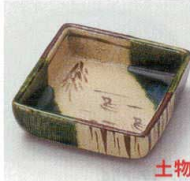
288-7-714 織部仕切鉢 3,000円 11×11×3cm 29216711