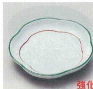
288-28-354 新瑞花四角小鉢 1,320円 11×11×4cm 29234351