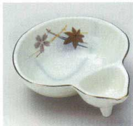
288-15-204 白吹竜田川瓢仕切鉢 1,200円 13×11×3.8cm 29323201