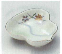
288-16-204 白吹竜田川瓢鉢 1,200円 11.1×11.2×3.2cm 29322201