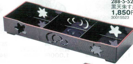
288-5-524 黒天朱すかし彫三ツ仕切弁当 (ABS) 1,850円 36.3×12.5×5.5cm 30015523