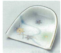
288-25-204 白吹竜田川箕型 1,200円 11.6×12.8×4cm 30029203