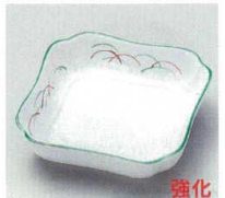
288-21-354 武蔵野花丸皿 1,210円 11.5×2cm 29233351