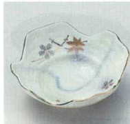
288-18-204 白吹竜田川四ツ山鉢 1,200円 11.7×11.9×4.5cm 29319201