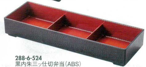
288-6-524 黒内朱三ツ仕切弁当 (ABS) 1,800円 36.3×12.5×5.5cm 30016523