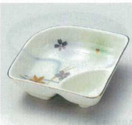
288-14-204 白吹竜田川扇型仕切鉢 1,200円 13×14.9×3.8cm 29603201