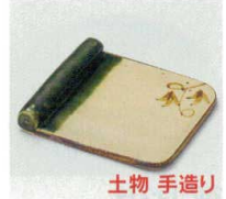
288-12-714 織部淵折角皿 2,050円 11×11×2.5cm 29217711