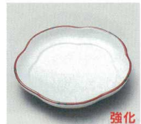
288-30-354 緑彩五ツ山皿 1,210円 11.3×1.8cm 30010351