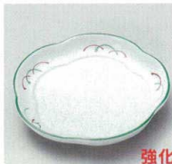
288-20-354 武蔵野五つ山皿 1,210円 11.3×1.8cm 29232351