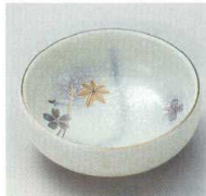
288-17-204 白吹竜田川丸鉢 1,200円 11×4.4cm 29320201