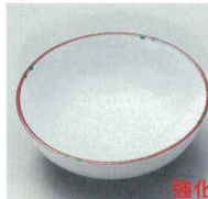
288-23-354 武蔵野丸型小鉢 910円 11.5×4cm 29231351