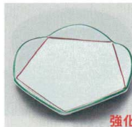
288-29-354 緑彩花丸皿 1,210円 11.5×2cm 30335352