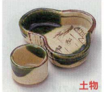
288-8-714 織部角鉢 2,400円 11×11×3cm 29214711