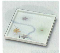
288-19-204 白吹竜田川角皿 1,200円 11.2×11.2×1cm 30014201