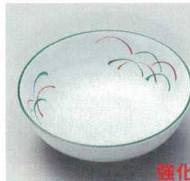
288-22-354 武蔵野花四角小鉢 1,320円 11×11×4cm 29230351