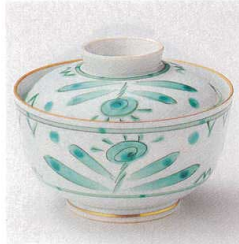
301-2-364 青彩花絵蓋向 5,200円 12×9.2cm 30102364