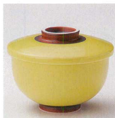
301-23-284 イエロー大むし碗 1,700円 11×8.8cm(350cc) 60入 32130282