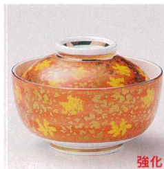
301-16-754 朱巻金雲ちらし煮物碗 3,200円 12×7.8cm 30521751

細長皿 128P~ 突出皿 焼物皿 142P~ 仕切皿 のり皿 串焼皿 161P~