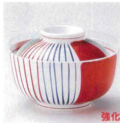
301-8-704 赤間取十草円菓子碗 3,900円 φ11.9×8.3cm 30108704