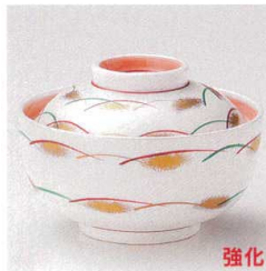
301-7-754 銀彩武蔵野煮物碗 3,950円 12×8cm 30511751