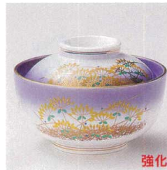
301-9-204 安曇野円菓子碗 4,000円 11.8×8cm 30808201