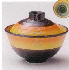
301-12-284 二色吹き渦影蓋物 3,450円 12.7×10.2cm 40入 30417281