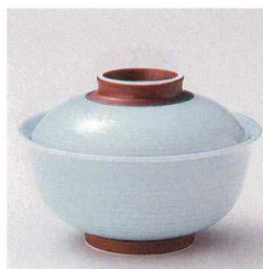
301-22-284 青白錆巻反円菓子碗(大) 1,750円 13×9.5cm 50入 30122284