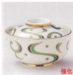
301-11-704 金唐草円菓子碗 3,800円 11.5×7.5cm 30519701