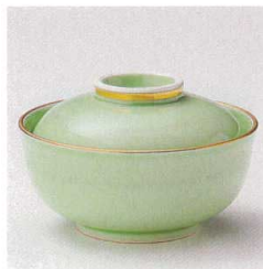
301-17-694 潤金グリーン釉蓋物(有田焼) 3,200円 12.6×8.3cm 5×12入 31223693