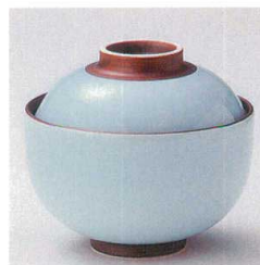
301-24-284 青白磁円菓子碗大 1,500円 11×9.8cm 60入 30124284