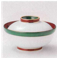
301-6-694 潤赤巻グリーン蓋物(有田焼) 4,500円 13×8cm 5×12入 31207693