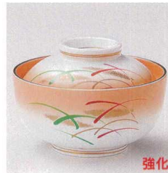
301-10-204 加茂川円菓子碗 4,000円 11.8×8cm 30619201