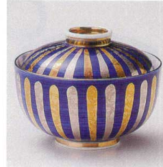
301-5-694 呉須巻金銀十草蓋物(有田焼) 5,500円 11.5×9cm 5入 30105694