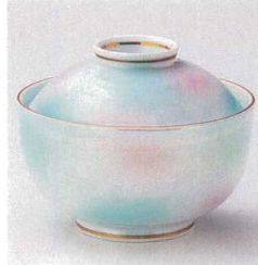
301-3-694 パール蓋物(有田焼) 5,400円 12×9.5cm 5×12入 31403693