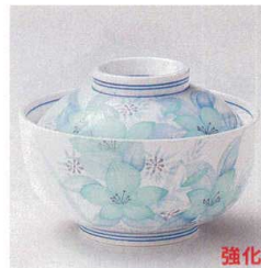
301-20-204 津和野円菓子碗 2,900円 11.7×8cm 53712201