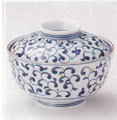
301-1-364 錦唐草蓋向 5,600円 12×9.2cm 30101364