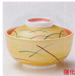
301-14-754 金彩むさしの煮物碗 3,250円 12×7.8cm 30522751