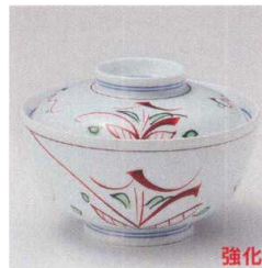
301-19-204 手描き京小花円菓子碗 4,100円 11.8×9cm 30119204