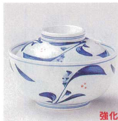
301-18-204 清里円菓子碗 3,000円 12×7.8cm 31714202