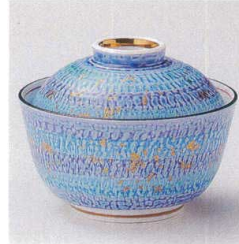
301-4-554 トルコ三彩金付円菓子碗 5,200円 11.8×8.8cm 30902551