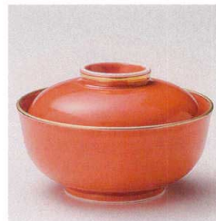
301-15-694 潤金オレンジ釉蓋物(有田焼) 3,200円 12.6×8.3cm 5×12入 31224693

細長皿 128P~ 突出皿 焼物皿 142P~ 仕切皿 のり皿 串焼皿 161P~