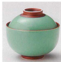
301-25-284 ヒスイ錆巻円菓子碗(大) 1,500円 11×9.8cm 50入 30125284

細小皿 小皿 252P~ 有田焼大皿 萬古焼大皿 264P~ 組皿(大) 270P~ 天皿 吞水 取鉢 280P~