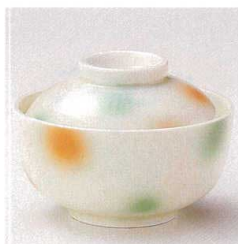
301-21-284 水玉二色吹円菓子碗 2,600円 12×8cm 50入 31716282