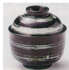
305-26-284 白ハケ円菓子碗 810円 9.7×10cm 50入 31913282