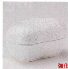
305-8-554 ラスターピンクー珍石面蓋物 3,200円 13×9.5×7cm 40入 30523551