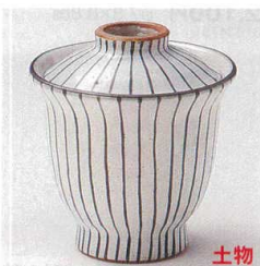
305-23-714 粉引十草小吸碗 2,200円 8.5×9.3cm(130cc) 32606712