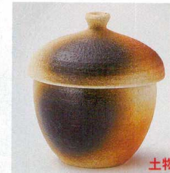
305-5-214 備前風煮物碗 1,950円 8.7×11.3cm 31115211