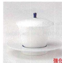
305-16-554 青巻蓋付デザートカップソーサー付 2,400円 12×9.3cm(90cc) 50入 32809552