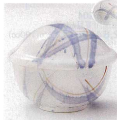
305-20-214 白マット具須散しむし碗 1,950円 9.5×8.2×8cm(170cc) 31209211