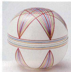
305-7-054 糸巻蓋物 4,500円 9.8×10cm 31614052