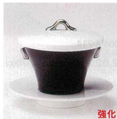
305-13-754 白蓋(皿付)スイーツカップ 2,600円 8.7×9cm(120cc) 31905753 305-14-754 白磁受皿 580円 12×1.5cm 31906753