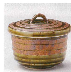
305-27-754 鉄釉織部駒筋大むし 860円 9×8.5cm(250cc) 31805751