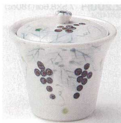
305-24-554 白志野ぶどう蓋物 1,980円 9.5×9.2cm 31714553