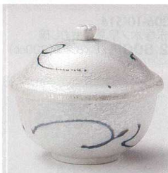
305-18-524 筆遊びラスター楕円蓋物 2,250円 9.6×8.2×8.9cm 30518524