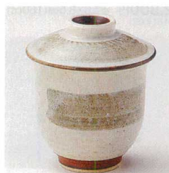
305-25-714 茶刷毛目むし碗 1,060円 7.4×9.4cm(180cc) 31619711