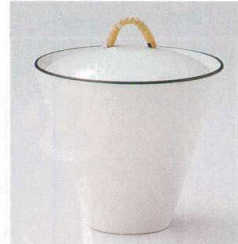
305-3-204 ハボンリドボール 1,530円 11.2×9.7cm 31326203