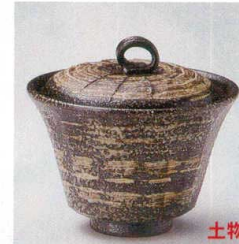
305-4-214 焼ゾフタ付おしゃれ鉢 2,350円 11.3×9cm 31111211