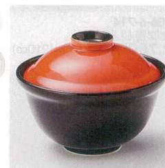
305-22-704 塗分赤黒福碗 2,250円 10.8×8.5cm 31906702