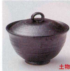
305-2-214 黒陶煮物碗 2,650円 12.9×11cm 31309213