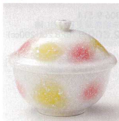
305-19-524 二色吹楕円蓋物 1,800円 9.6×8.2×8.9cm 30519524