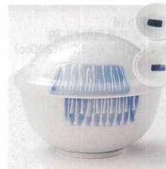
305-21-284 せせらぎ姫むし碗 1,950円 9.6×8.5cm(170cc) 80入 31210281