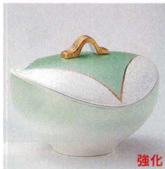
305-6-554 ヒワ吹七宝紋蓋物 4,750円 11×9cm 40入 30801551