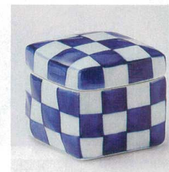
305-10-694 染付市松角陶箱(中)(有田焼) 1,800円 8.5×8.5×7.5cm 1入 30510694