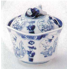
305-1-284 古染閑入蓋物 3,250円 10.5×10.5×10.5cm 50入 30706281