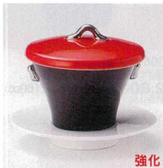
305-11-754 赤蓋(皿付)スイーツカップ 2,600円 8.7×9cm(120cc) 31903753 305-12-754 白磁受皿 580円 12×1.5cm 31904753