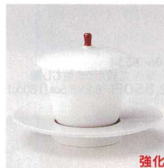
305-15-554 赤巻蓋付デザートカップソーサー付 2,400円 12×9.3cm(90cc) 50入 32810552