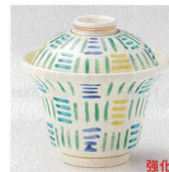
305-17-714 アジロ煮物碗(小) 3,870円 10×10cm 30517714