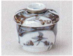
307-14-284 万両角むし 1,300円 8×6.5cm(180cc) 60入 32024282