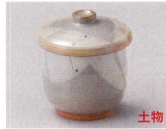
307-11-714 街灯りむし碗 1,300円 8.1×9cm(190cc) 31232711