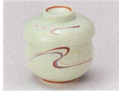
307-18-754 緑袖京帯流水むし碗 1,150円 φ7.4×8.8cm(200cc) 31315751