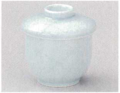
307-15-674 深山青磁むし碗 1,270円 8.2×9.3cm(200cc) 54870671