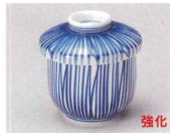
307-6-704 千筋むし碗 1,580円 8.1×8.1×8.8cm(240cc) 31120701