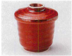
307-13-284 紅むし碗 1,300円 8.5×7.2cm(200cc) 5入 30713284