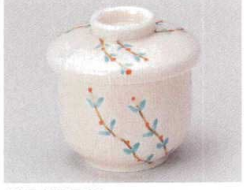
307-30-734 ピンク矢来むし碗 930円 8×8.8cm(250cc) 31801731