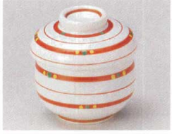
307-24-524 三色吹並形むし碗(中)(115-09)(中国製) 1,050円 7.6×8.7cm(190cc) 6入 31824521