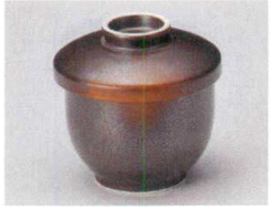
307-19-754 焼締め蒸し碗(小) 1,150円 φ7.8×8.5cm(150cc) 32109753