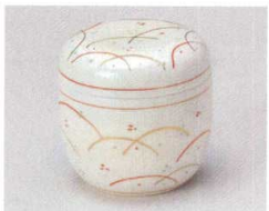
307-5-524 武蔵野夏目形むし碗(中)(111-33)(中国製) 1,600円 7.8×7.8cm(180cc) 32214522