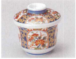
307-20-714 金彩錦草花むし碗 1,100円 8.4×9.7cm(230cc) 31716711