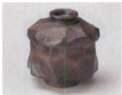
307-3-284 炭化土しのぎむし碗 1,800円 8.5×6.3cm(160cc) 72入 31818283