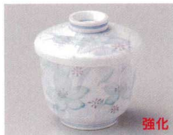
307-2-204 津和野京型むし碗 1,850円 8.3×8.4cm(180cc) 6入 53715201