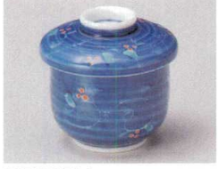
307-29-734 千段巻ブドウむし碗 930円 8×8.8cm(250cc) 31806731