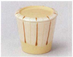
307-10-714 錆十草むし碗 1,330円 7.2×7cm(150cc) 32708712