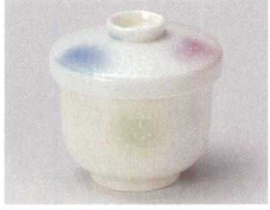
307-23-524 白吹水玉並型むし碗(中)(中国製) 1,050円 7.6×8.7cm(190cc) 30723524