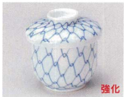
307-4-704 青白磁あみむし碗(大) 1,780円 8.1×8.1×8.8cm(240cc) 31037701