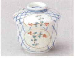
307-25-754 玉つづりむし碗 1,050円 φ7.4×8.8cm(200cc) 31312751