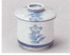
307-28-714 桔梗むし碗 950円 7.1×8cm(160cc) 31704711