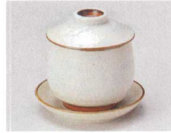
307-16-714 ソバ志野むし碗 1,150円 8.4×9cm(230cc) 31617711