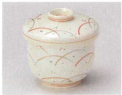
307-8-524 むさしの並形むし碗(中)(115-33)(中国製) 1,450円 7.6×8.7cm(190cc) 6入 31616521