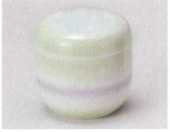
307-21-524 二色吹夏目形むし碗(中)(111-12)(中国製) 1,100円 7.8×7.8cm(180cc) 32224522