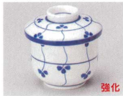
307-7-734 三ツ葉むし碗 1,530円 8×8.8cm(250cc) 32102732