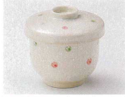
307-22-524 三色吹夏目形むし碗(中)(111-09)(中国製) 1,100円 7.8×7.8cm(180cc) 6入 31804521