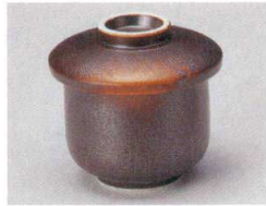
307-12-754 焼締め蒸し碗(大) 1,300円 φ8.2×8.8cm(180cc) 32201753