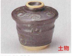
307-31-214 一珍うずむし碗 920円 8.1×9.1cm(160cc) 31326211