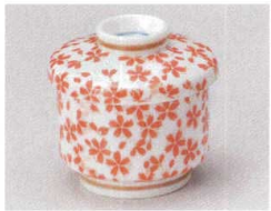
307-9-284 なづな角むし 1,350円 8×6.4cm(180cc) 60入 32110282