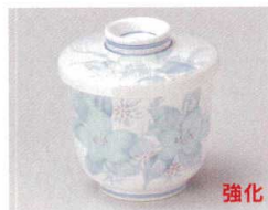
307-1-204 津和野むし碗 1,850円 8×9.5cm(230cc) 31823203