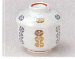
307-27-754 七宝むし茶碗 960円 φ7.4×8.8cm(200cc) 31627751