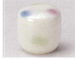
307-17-714 ソバ志野受皿 440円 10.4×1.8cm 31618711