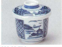
308-38-714 間取山水むし碗 490円 8.4×9.7cm (230cc) 30838714