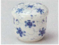
308-17-514 花つづりむし碗 700円 7.6×8cm (220cc) 32237512