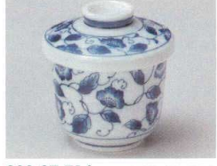
308-37-714 葉唐草むし碗 490円 8.4×9.7cm (230cc) 31935711