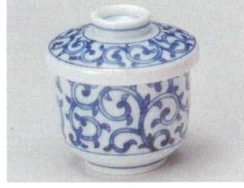
308-25-204 青唐草むし碗 550円 8.4×9.3cm (230cc) 31922201