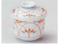
308-28-674 赤小花むし(蓋付) 580円 8×9cm (230cc) 10入 31913671 308-29-674 赤小花むし(身) 320円 31914671