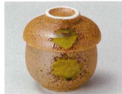
308-7-264 伊賀織部吹きむし碗 700円 7.3×8.5cm (210cc) 60入 30807264