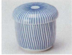
308-14-514 十草むし碗 700円 7.6×8cm (220cc) 32236512