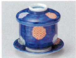
308-2-714 丸紋祥瑞むし碗 860円 8.2×9.1cm (250cc) 31712711 308-3-714 丸紋祥瑞受皿 440円 10.7×1.8cm 31713711