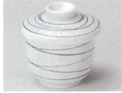
308-19-264 粉引ラインむし碗 590円 8×9cm (230cc) 60入 30819264