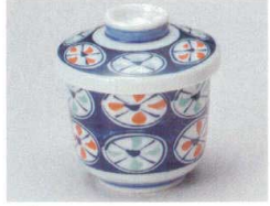
308-22-714 風紋むし碗 590円 8.4×9.7cm (230cc) 31906711