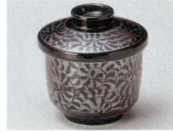
308-18-504 天目唐草むし碗 580円 9.2×9.7cm (250cc) 32130503