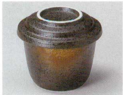
308-4-154 備前風白吹りパーシブル蒸碗 880円 8.3×8.3cm (210cc) 30804154