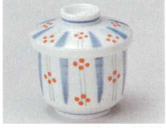
308-30-674 梅十草むし(蓋付) 580円 8×9cm (230cc) 10入 31911671 308-31-674 梅十草むし(身) 320円 31912671