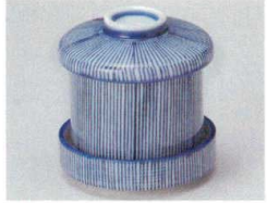
308-15-724 千筋十草むし碗 700円 7.1×8cm (160cc) 31829721 308-16-724 千筋十草受皿 350円 8.4×2.3cm 31830721