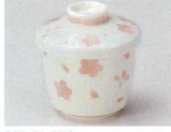
308-36-374 ざくらざくら蒸し碗(美濃焼) 430円 9.4×9.5cm (230cc) 32235373