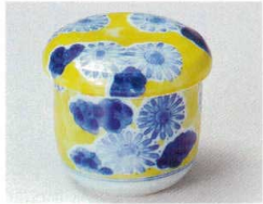
308-9-354 黄地草花むし碗 720円 7.8×8.2cm (200cc) 30809354