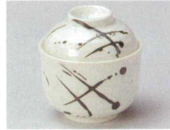
308-12-514 黒筆流粉引釉蓋物 700円 8.8×9.2cm (170cc) 32621512