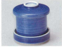
308-20-724 刷毛目むし碗 610円 7.1×8cm (160cc) 31835721 308-21-724 刷毛目むし受皿 350円 8.4×2.3cm 31836721