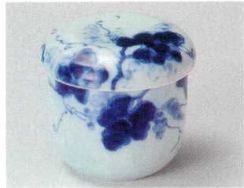
308-8-354 ぶどうむし碗 720円 7.8×8.2cm (200cc) 30808354