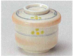
308-11-794 早春むし碗 830円 8.0×7.6cm (230cc) 31711791