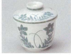
308-26-674 グリン桔梗むし(蓋付) 540円 8×9cm (220cc) 10入 31923671 308-27-674 グリン桔梗むし(身) 300円 31924671