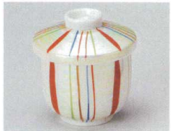
308-5-754 パール色十草むし碗 880円 7.2×8.5cm (150cc) 31338751