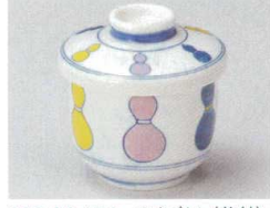
308-34-674 ひさごむし(蓋付) 580円 8×9cm (230cc) 10入 31915671 308-35-674 ひさごむし(身) 320円 31916671