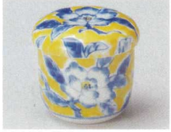
308-23-374 黄彩花紋蒸し碗(美濃焼) 650円 8.5×8cm (200cc) 32030373