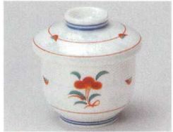
308-10-704 古赤絵むし碗 680円 9.5×9.5×9.5cm (220cc) 31928701