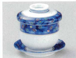
308-1-714 帯木の葉むし碗 840円 8.2×9.1cm (250cc) 31726711