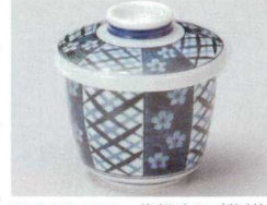
308-32-674 梅祥瑞むし(蓋付) 540円 8×9cm (220cc) 10入 31920671 308-33-674 梅祥瑞むし(身) 300円 31921671