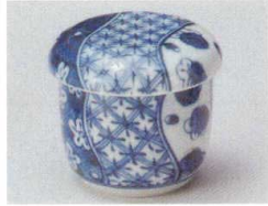
308-13-514 祥瑞むし碗 700円 7.6×8cm (220cc) 32238512