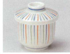
308-24-504 色十草むし碗 520円 9.2×9.7cm (250cc) 32226503