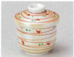
308-6-754 パールらせんむし碗 890円 7.2×8.5cm (150cc) 31626751