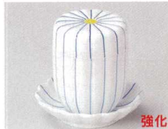
309-30-714 細十草菊型むし碗 2,270円 7×8.8cm(160cc) 30930714 309-31-714 細十草受皿 930円 10×2.5cm 30931714