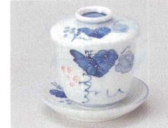
309-38-714 一珍ブドウむし碗 1,050円 7.8×9.3cm(220cc) 31721711 309-39-714 一珍ブドウ受皿 670円 10.5×1.7cm 31722711