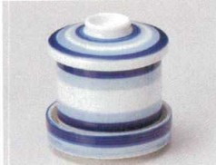
309-1-714 二色筋小むし碗 700円 7.1×8.1cm(160cc) 31833711 309-2-714 二色筋受皿 320円 8.4×2.3cm 31834711