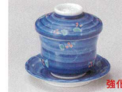
309-9-734 呉須巻ブドウ小むし碗 1,450円 7.2×8.2cm(160cc) 31125731 309-10-734 呉須巻ブドウ受皿 730円 10.2×1.5cm 31126731