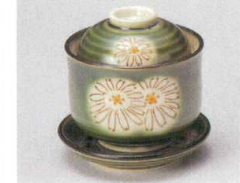
309-28-714 織部菊むし碗 1,100円 8.2×8.4cm(150cc) 31309711 309-29-714 織部菊受皿 400円 9.8×1.8cm 31310711