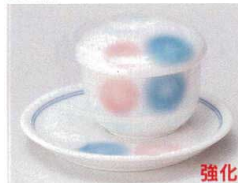
309-42-754 二色水玉蒸し碗 1,000円 φ7.3×6cm(130cc) 31609751 309-43-754 蒸し碗受皿スプーン置型 600円 φ13×1.7cm 31610751