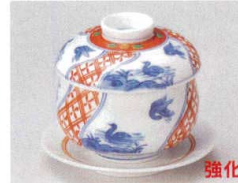
309-24-554 強化万層むし碗 2,400円 8.5×8.5cm(190cc) 80入 32013552 309-25-554 強化万層受皿 520円 20入 32014552