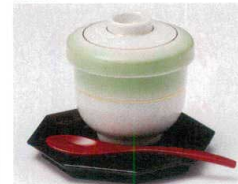
309-59-524 ヒツ吹金銀夏目形むし碗(中)(115-04)(中国製) 1,100円 φ7.6×8.7cm(190cc) 6入 31733521 309-60-524 うるみ八角スプーン置受皿(ABS) 450円 12×12×1.2cm 31913523 309-61-524 朱むしスプーン(アクリル) 160円 13×2.5cm 31909523