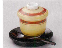
309-35-754 金彩赤駒筋むし碗 940円 φ7.2×8.5cm(150cc) 31625751 309-36-754 万能丸型スプーン置蒸台 550円 φ12×1.7cm 31339751 309-37-754 うるみスプーン(木製) 380円 φ2.8×12.7cm 31323751