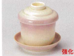
309-3-714 紫吹むし碗 1,200円 7.2×8.5cm(160cc) 31305711