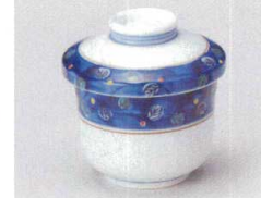
309-7-714 帯木の葉小むし碗 810円 7.5×8.5cm(160cc) 31724711 309-8-714 帯木の葉受皿 400円 10.7×1.8cm 31727711