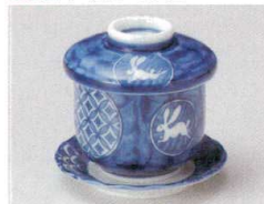
309-54-714 京祥瑞むし碗 840円 8.2×9.1cm(250cc) 31810711 309-55-714 京祥瑞受皿 400円 10.7×1.8cm 31811711