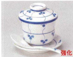
309-11-734 三つ葉小むし碗 1,450円 7.2×8.2cm(160cc) 31122731 309-12-734 三つ葉受皿 730円 10.2×1.5cm 31123731 309-13-734 三つ葉スプーン(小) 750円 2.6×1.3cm 31124731