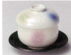
309-14-524 三色吹塵丸形むし碗(小)(118-09)(中国製) 1,050円 6.5×7.1cm(120cc) 32119522 309-15-524 黒ケヤキ木目むし受皿(ABS) 420円 10.4×1.7cm 32332523