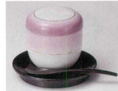
309-47-524 紫吹金銀夏目形むし碗(中)(111-07)(中国製) 1,150円 φ7.8×7.8cm(180cc) 6入 31706521 309-48-524 黒丸型スプーン置受皿(ABS) 600円 11.8×1.8cm 31908523 309-49-524 黒むしスプーン(アクリル) 160円 13×2.5cm 31914523