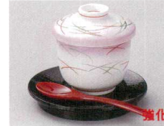
309-18-524 紫吹武蔵野京型むし碗 2,100円 7.4×8.2cm(210cc) 31033521 309-19-524 黒淵朱隅切千筋むし受皿(ABS) 700円 10×10cm 32342523