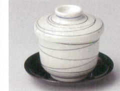
309-40-524 梨地ラインむし碗 520円 8×9cm(230cc) 31932521 309-41-524 溜丸11.8cmむし受皿(ABS) 450円 11.8×2cm 32328523