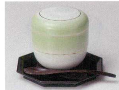
309-44-524 ヒツ吹金銀夏目形むし碗(中)(111-04)(中国製) 1,150円 φ7.8×7.8cm(180cc) 6入 31705521 309-45-524 黒八角スプーン置受皿(ABS) 450円 12×12×1.2cm 31924523 309-46-524 溜むしスプーン(アクリル) 160円 13×2.5cm 31925523