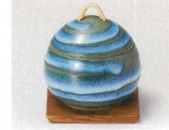
309-20-184 グリーン渦焼杉台付むし碗 1,000円 9.5×8.8cm(240cc) 30920184