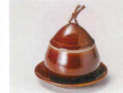
309-52-274 飴くり蒸碗 1,980円 8.5×8.8cm(150cc) 30952274 309-53-274 飴くり蒸受皿 660円 10.7×1.5cm 30953274