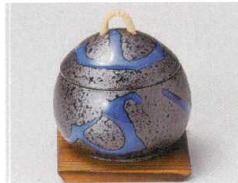
309-21-184 靑流焼杉台付むし碗 1,000円 9.5×8.8cm(240cc) 30921184