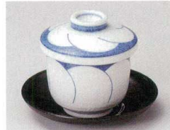
309-22-524 梅割ミニむし碗 550円 7×8cm(170cc) 30922524 309-23-524 黒丸11.8cmむし受皿(ABS) 300円 11.8×2cm 32330523