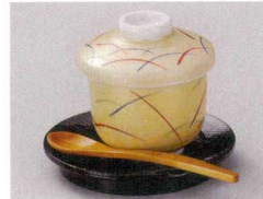
309-32-754 金彩武蔵野むし碗 880円 φ7.2×8.5cm(150cc) 31335751 309-33-754 万能丸型スプーン置蒸台 550円 φ12×1.7cm 31336751 309-34-754 竹塗リスプーン 220円 φ3×13cm 31337751