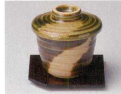
309-16-524 織部むし碗 900円 8×8.6cm(170cc) 32429522 309-17-524 うるみ隅切千筋むし受皿(ABS) 600円 10×10cm 32311523