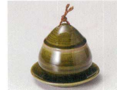
309-50-274 織部くり蒸碗 1,980円 8.5×8.8cm(150cc) 30950274 309-51-274 織部くり蒸受皿 660円 10.7×1.5cm 30951274