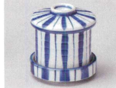
309-5-714 太十草小むし碗 700円 7.1×8.1cm(160cc) 31831711 309-6-714 太十草受皿 320円 8.4×2.3cm 31832711