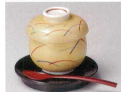
309-56-754 金彩むさしのむし碗 990円 φ7.4×8.8cm(200cc) 31322751 309-57-754 万能丸型スプーン置蒸台 550円 φ12×1.8cm 31324751 309-58-754 朱スプーン 220円 φ2.5×13.5cm 31611751