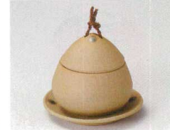
309-26-274 焼締くり蒸(大) 1,980円 9×9cm(230cc) 30926274 309-27-274 焼締くり蒸(大)皿 650円 12×1.5cm 30927274