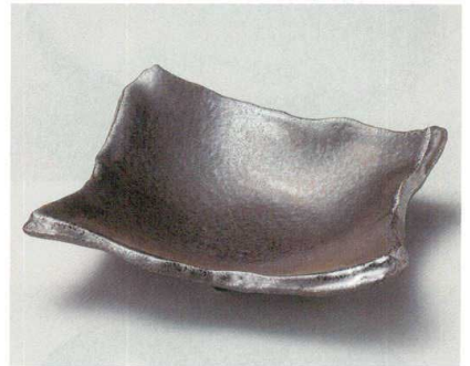
31-6-204 銀サビ黒ちぎり角皿(大) 2,800円 23.7×20.7×6.2cm 02612202