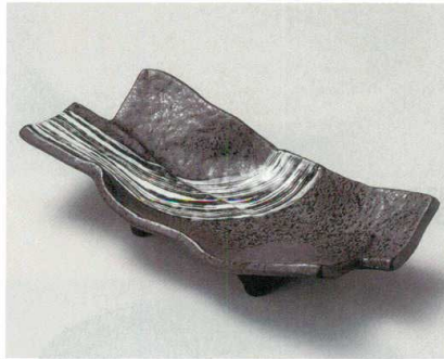
31-5-524 炭化土黒翔盛鉢(中) 3,250円 30×14.5×6.2cm 03105524