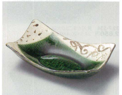
31-9-504 織部とちり長角鉢 1,700円 25.5×15.3×7cm 01308503