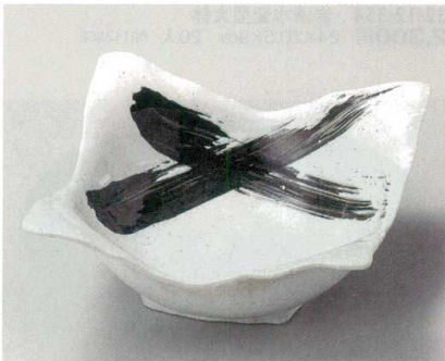
31-11-504 白黒刷毛四方鉢 1,600円 19.5×8.2cm 03308502