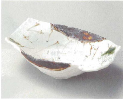
31-4-204 志野文字舟型盛鉢 3,500円 24.3×14.8×8cm 01913201