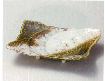
31-3-204 志野織部草花盛皿 4,200円 26×19×4.5cm 01912201