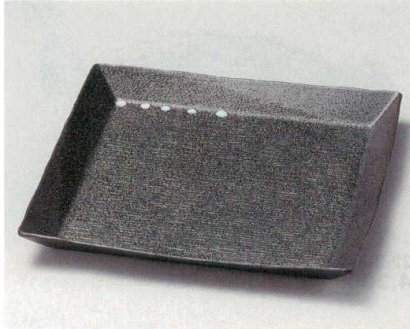
31-1-504 天目彫刻正角盛皿 3,600円 27.5×27.5×2.8cm 03101504