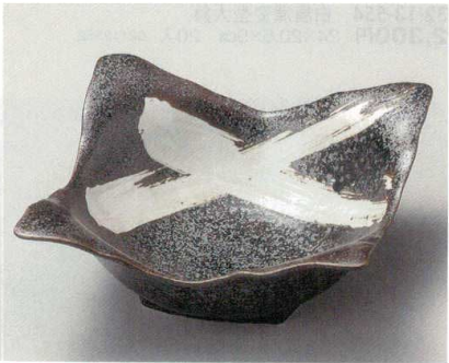
31-10-504 天目白刷毛四方鉢 1,600円 19.5×8.2cm 03307502