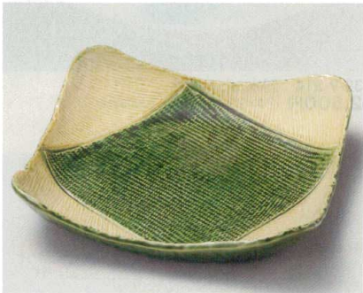
31-7-524 塗分け織部23cm正角盛鉢 1,800円 23.5×23.5×5.5cm 02303522