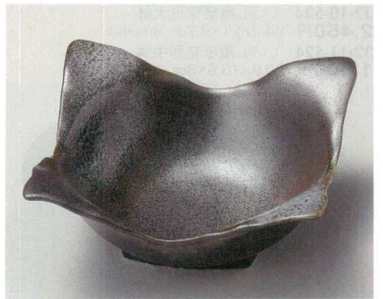
31-12-354 黒白吹四方鉢 大 1,550円 19.1×19×8.8cm 03207352