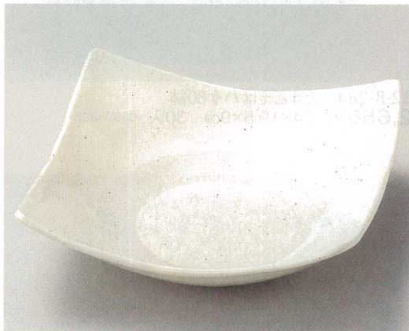
31-8-504 グレー引スクエアLボール 1,900円 21.5×21.5×7.2cm 03108504