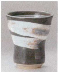
330-16-284 ネズ志野フリーカップ 700円 9×10cm(300cc) 10入 34608281