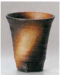
330-27-724 備前ゴブレット 580円 9.8×11cm(380cc) 34828723