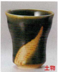
330-17-524 織部フリーカップ 700円 9×10.1cm(260cc) 34612521