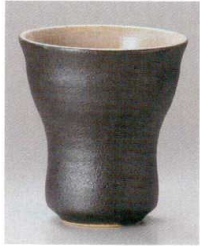
330-10-204 黒ガラス波カップ 760円 9.1×9.9cm(280cc) 6入 34609201