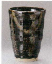
330-4-374 南蛮フリーカップ 780円 8.6×12.3cm(390cc) 10入 34105371