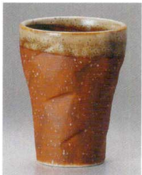
330-20-514 栗茶焼酎カップ 700円 8.7×11.3cm(300cc) 10入 34128511