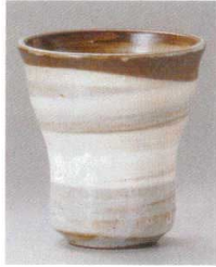
330-9-204 白刷毛目波カップ 760円 9.1×9.9cm(280cc) 6入 34607201