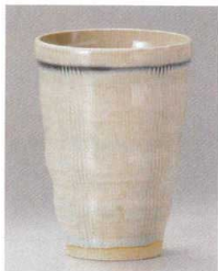
330-5-354 灰貫入ライン焼酎カップ 770円 8.8×12.3cm(360cc) 10入 34727353