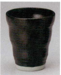
330-23-504 天目マイルドカップ 660円 9.5×11.2cm(400cc) 35326502