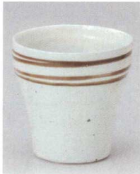
330-13-214 白釉ラインフリーカップ 710円 9.9×10cm(400cc) 35226213