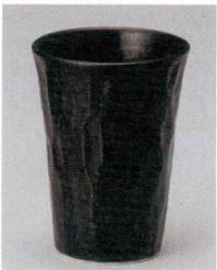
330-25-634 黒釉ソギフリーカップ 600円 8.3×11.5cm(350cc) 35017633