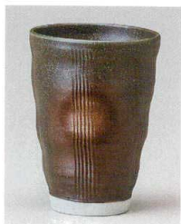
330-6-264 黒備前焼酎カップ 750円 8.8×12cm(360cc) 80入 33006264