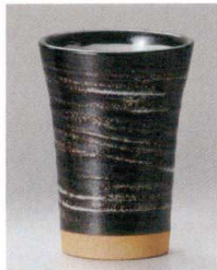
330-1-514 黒水晶白ハヘフリーカップ 780円 8.3×11.7cm(325cc) 10入 34125011