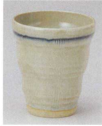
330-8-504 貫入マイルドカップ 660円 9.5×11.2cm(400cc) 6入 35327502