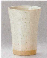
330-3-514 粉引フリーカップ 780円 8.5×11.7cm(340cc) 10入 35112512