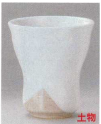
330-18-524 本粉引フリーカップ 700円 9×10.1cm(260cc) 34618521