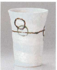
330-24-214 白釉輪フリーカップ 650円 8.3×11.2cm(300cc) 10入 34730211