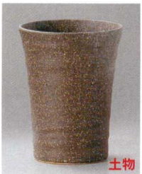
330-22-364 黒伊賀ビールコップ 680円 8.5×10.2cm(320cc) 10入 34925361