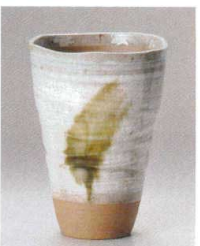
330-30-674 さざ波タンブラー 白 530円 8×11.2cm(250cc) 10入 34621671