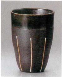
330-11-204 黒マット一珍十草フリーカップ 730円 7.8×10.5cm(300cc) 10入 34622201