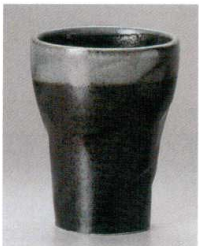
330-21-514 黒水晶焼酎カップ 700円 8.7×11.3cm(300cc) 10入 34129511