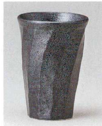
330-2-114 結晶黒フリーカップ 900円 8.5×12cm(300cc) 10入 33002114