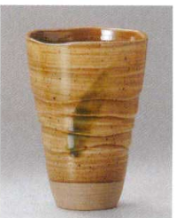
330-29-674 さざ波黄瀬戸タンブラー 530円 8×11.2cm(250cc) 10入 34620671