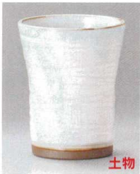
330-19-524 白釉削りフリーカップ 720円 8×10cm(250cc) 34919521