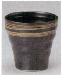
330-14-214 黒釉ラインフリーカップ 710円 9.9×10cm(400cc) 35225213