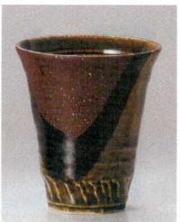
330-28-724 織部ぬり分ゴブレット 580円 9.8×11cm(380cc) 34829723