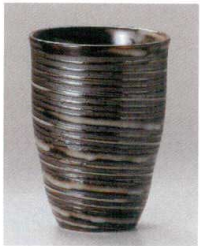
330-12-204 黒陶ウズフリーカップ 730円 7.8×10.5cm(300cc) 10入 34617201