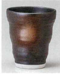
330-7-264 黒備前マイルドカップ 750円 9.5×11cm(380cc) 80入 33007264