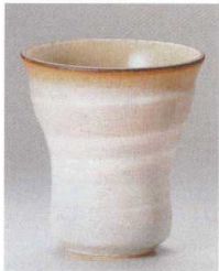
330-15-284 赤志野フリーカップ 700円 9×10cm(300cc) 60入 35614282