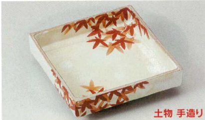
36-1-254 赤絵紅葉20cm角盛鉢 14,000円 20×20×6cm 03001252

盛鉢 14P~ 楕円鉢 組鉢 38P~ 刺身 向付 46P~ 中鉢 小鉢 64P~ 小付 珍珠 100P~