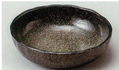
36-6-794 大河7.0丸鉢 2,580円 19.4×5.3cm 02705791

楕円皿 206P~ 丸皿 212P~ 和皿 前菜皿 7ル/海盤 235P~ 組小皿 小皿 252P~ 有田焼大皿 萬古焼大皿 264P~