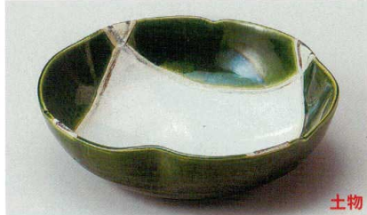
36-2-714 織部格子三ツ押盛鉢 4,800円 19.5×19.2×6.5cm 03006782