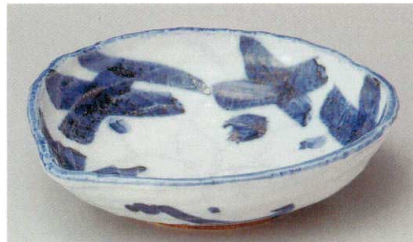
36-8-554 ゴス格子片口6.5鉢 2,000円 19.5×19×4.8cm 40入 02907551