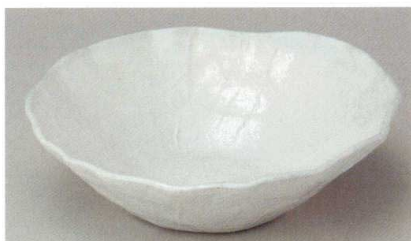
36-10-674 粉引手折サラダ鉢 1,600円 20×19.8×5.5cm 02812673

組皿 (大) 270P~ 天皿 吞水 取鉢 280P~ 松花堂 288P~ 蓋向 煮物碗 円菓子碗 298P~ むし碗 306P~