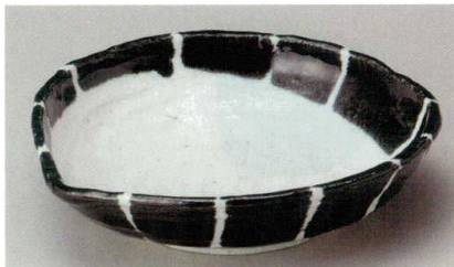
36-7-524 黒十草片口中鉢 2,100円 19.6×19×5cm 03019522

楕円皿 206P~ 丸皿 212P~ 和皿 前菜皿 7ル/海盤 235P~ 組小皿 小皿 252P~ 有田焼大皿 萬古焼大皿 264P~