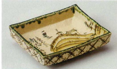
36-3-554 乾山瀨オリベ山水長角盛鉢 4,200円 20×16×5.2cm 20入 02605551

細長皿 128P~ 突出皿 焼物皿 142P~ 仕切皿 のり皿 串焼皿 161P~ 盛皿 166P~ 角皿 (鉢鉢) 174P~