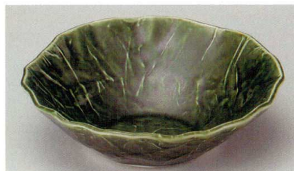
36-11-674 織部手折サラダ鉢 1,600円 20×19.8×5.5cm 02712671