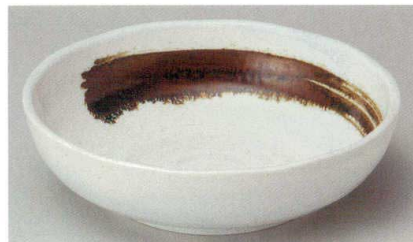
36-14-054 武蔵6.5ボール 990円 20×6cm 03014053