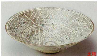
36-4-214 粉引釉ケズリ6.0鉢 3,400円 19.7×5.6cm 02704213

細長皿 128P~ 突出皿 焼物皿 142P~ 仕切皿 のり皿 串焼皿 161P~ 盛皿 166P~ 角皿 (鉢鉢) 174P~