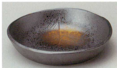
36-12-674 民芸アジ6.5盛鉢 1,600円 19.8×4cm 02906673