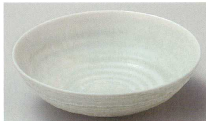
36-15-204 いこい6.0鉢 980円 19.8×6.3cm 03615204