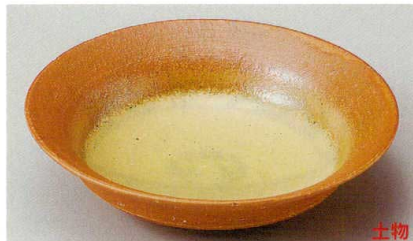
36-5-554 伊賀6.5浅鉢 3,000円 20.2×5.5cm 02414551