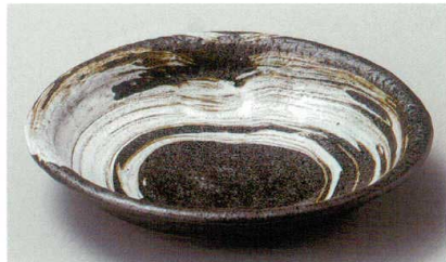
36-9-554 豪快・白舞深鉢 1,700円 20.2×19.3×6.2cm 03609554

組皿 (大) 270P~ 天皿 吞水 取鉢 280P~ 松花堂 288P~ 蓋向 煮物碗 円菓子碗 298P~ むし碗 306P~