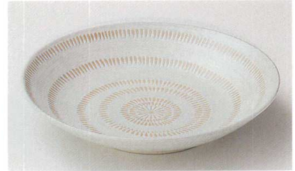
365-12-674 かな丸7.5多用皿 720円 22.7×4.6cm 39110673