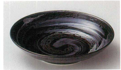
365-15-554 早瀬黒7.5ミツワ麺皿 590円 23×5cm 36515554

そば椀口揃 346P~ 三品皿 三品皿 仕切皿 353P~ 麺皿 パスタ皿 360P~ ボール 368P~ シリーズ 多用井 反井 372P~ 多用碗 飯器 フタ井 406P~ 大茶毛料 大平・中平 膳 418P~ 寿司湯呑 432P~ 長湯呑 煎茶 茶器揃 434P~ 土瓶 急須 ポット 450P~ 茶道具 抹茶碗 462P~