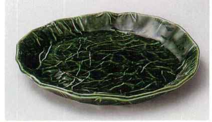
365-3-674 織部手折パスタ 1,650円 25×2.6cm 47706671