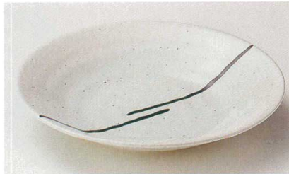
365-7-184 クラフトライン白7.5皿 980円 23.4×4.6cm 47208181