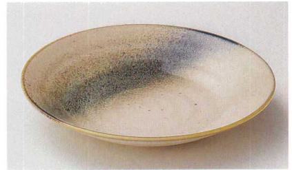
365-6-184 銀河リップル7.5皿 980円 23.4×4.6cm 47207181