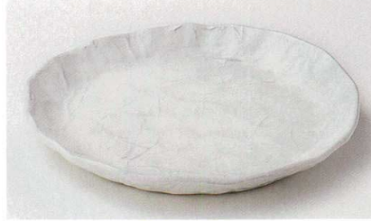
365-2-674 粉引手折パスタ皿 1,650円 25×2.6cm 36502674