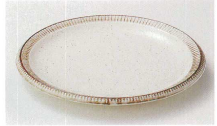
365-9-214 粉引風彫彫麺皿 960円 24×3.2cm 36509214