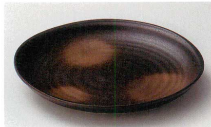
365-5-204 黒備前7.0寸皿 980円 23.2×3.5cm 39001203