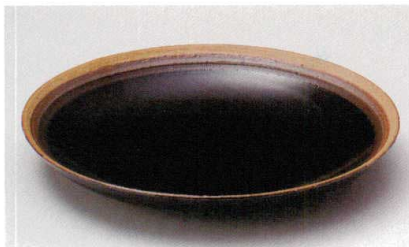
365-4-204 黒三色リング丸皿 3,700円 26×4cm 36504204