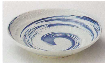
365-14-634 清流7.5めん皿 590円 22.8×4.9cm 39111633