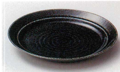
365-10-624 あい唐津8.0パスタ皿 850円 24.5×3.5cm 47909621