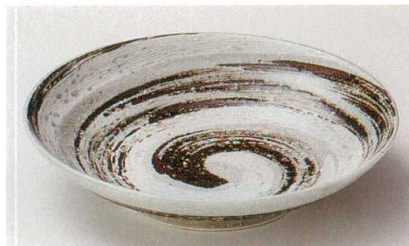
365-13-554 鳴門7.5ミツワ麺皿 590円 23×5cm 36513554