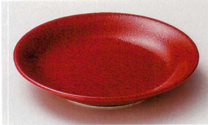
365-1-184 柚子赤斑点7.5冷やし皿 1,950円 22×4cm 36501184