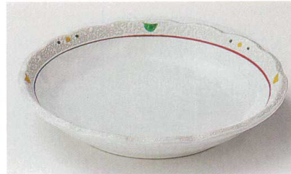
365-11-354 しなやか7.0深皿 830円 22.4×4.2cm 47210351