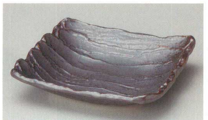
37-12-374 銀河荒ソギ中鉢 1,100円 17×17×3cm 06913372