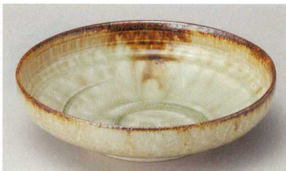
37-8-524 灰釉錆流し平鉢6.0寸 2,000円 18.5×5.3cm 02908523