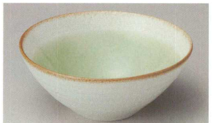
37-9-624 若草6.0盛鉢 1,250円 18.3×7.5cm 02910623