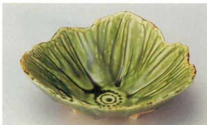
37-5-524 織部三つ足六寸鉢 2,350円 17.8×17.5×7.5cm 03101523