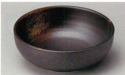
37-11-354 南蛮吹流し石目5.5ボール 1,130円 17×6cm 03012351