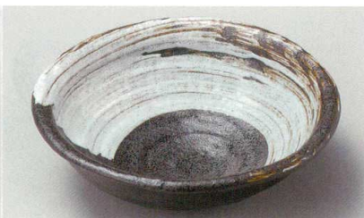
37-13-554 豪快・白翔中鉢 900円 17.3×15.8×6.2cm 03713554