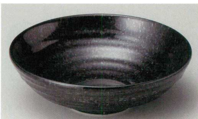
37-14-524 油滴天目6.5寸平鉢 950円 19.2×5.9cm 03332521