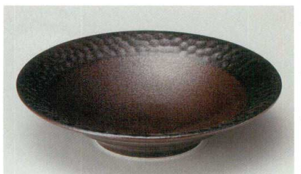
37-15-034 ショコラ多用鉢 760円 18.5×4.5cm 07115032