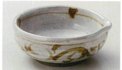
37-3-114 あめ唐草6.0片口ボール 3,550円 18×16×7.5cm 01907111