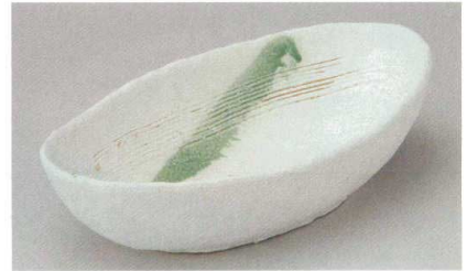
細長皿 128P~ 38-4-554 ラスターピンク花楕円鉢 3,700円 31×17.5×6cm 15入 01409552