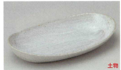
38-10-214 呉須刷毛楕円鉢 1,900円 30.2×17.5×4.2cm 03810214