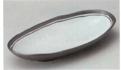
楕円皿 206P~ 38-7-204 霽石長盛皿大 3,000円 33.3×14.7×4cm 55136201