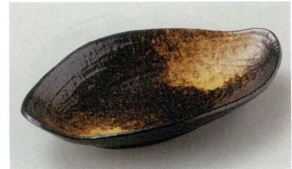
38-13-724 白刷毛盛鉢 1,300円 28.3×17.8×4.9cm 03510723