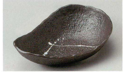
盛鉢 14P~ 38-1-214 手付丸紋盛鉢 4,100円 29×17.7×7.4cm 03801214