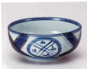
381-1-554 錆格子紋6.0ボール 1,900円 18.3×8cm 40502551