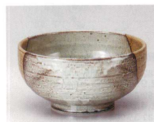
381-16-634 里がすみ高浜5.5井 1,100円 17×8.5cm 28入 39601631