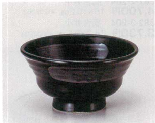
381-8-524 銀刷毛腰張4.5井 1,100円 13.5×7.2cm 39204521