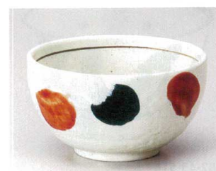
381-20-734 色うち5.5井 1,800円 17×9.5cm 39319731