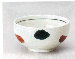
381-22-734 色うち5.0井 1,000円 15.5×7.7cm 39318731