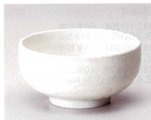
381-10-624 わらく白マット石目高浜5.5井 1,150円 17.5×8.5cm 42204621