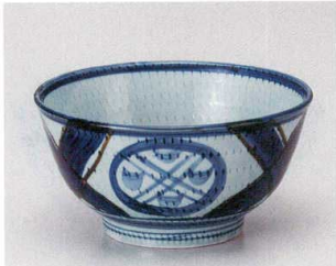
381-3-554 錆格子紋5.5井 1,430円 17×8.8cm 41901551