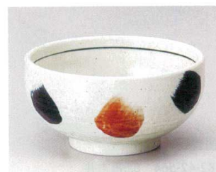
381-21-734 色うち高浜5.5井 1,200円 17.5×8.5cm 39315731