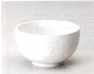
381-13-624 わらく白マット石目5.0井 950円 15.5×7.7cm 39703621