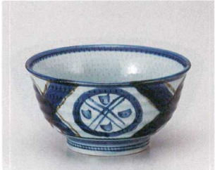
381-4-554 錆格子紋5.0反種井 1,250円 15.5×8cm 42103551