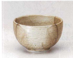
381-19-634 里がすみ石目4.2井 750円 13×8cm 48入 39604631