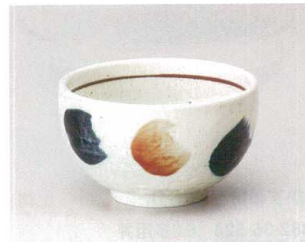
381-23-734 色うち4.2井 780円 13×8cm 39321731 381-24-734 色うち4.0井 630円 12.5×7.2cm 39320731