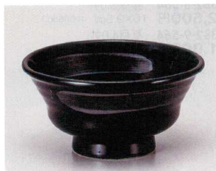
381-6-524 銀刷毛腰張5.5井 1,500円 16.3×8.6cm 39202521