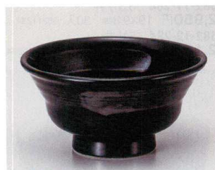
381-5-524 銀刷毛腰張6.0井 1,950円 18×9.5cm 39201521