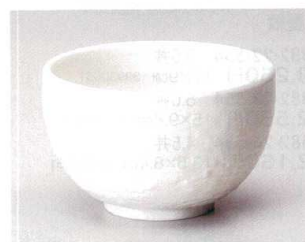
381-9-624 わらく白マット石目深口5.0井 1,350円 15.9×9.5cm 39701621