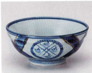
381-2-554 錆格子紋玉6.0井 1,760円 18.7×8.5cm 41721551