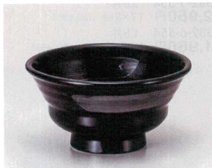
381-7-524 銀刷毛腰張5.0井 1,200円 15×8cm 39203521