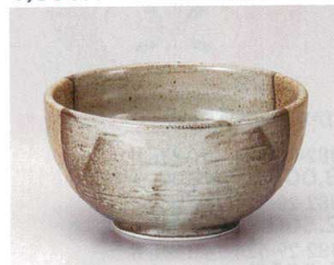
381-18-634 里がすみ石目5.0井 930円 15.1×8cm 40入 39603631