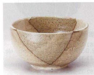
381-17-634 里がすみ石目5.5井 1,600円 17.3×9.5cm 28入 39602631