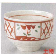
413-24-524 格子花いっぶく碗 930円 10.1×7cm 44833522