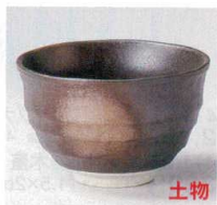
413-21-724 備前いっぶく碗 900円 10×7.4cm 41321724