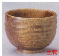
413-15-514 備前ゆったり碗 1,000円 10.1×7.4cm (350cc) 43428511