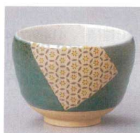
413-17-724 小紋小井 950円 10.2×7.3cm 43431721