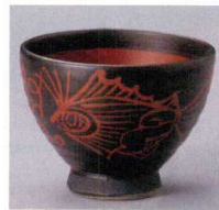
413-2-524 鉄釉魚紋高台碗 1,800円 10.5×8cm 43804523