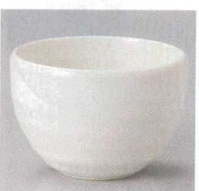
413-28-674 白釉姫井 700円 10.5×7.3cm 43521671