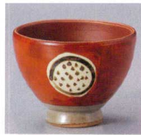
413-1-524 朱巻鎖点紋高台碗 2,000円 10.3×8cm 43802523

そば類口揃 346P~ 二品皿 三品皿 仕切皿 353P~ 麵皿 ハスタ皿 360P~ ボール 368P~ シリーズ併 多用丼 反井 372P~ 多用碗 飯器 フタ丼 406P~ 大茶毛料 大平中平 睦 418P~ 寿司湯呑 432P~ 長瀬呑 煎茶 茶器揃 434P~ 土瓶 急須 ポット 450P~ 茶道具 抹茶碗 462P~