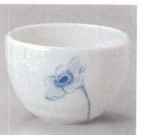
413-31-184 ブルーホビーころろ碗 600円 10.5×7.3cm 43922183