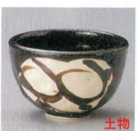
413-29-524 黒釉草紋いっぶく碗 680円 10.4×6.5cm 43512521