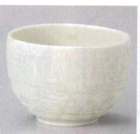
413-32-204 いこいたっぶり碗 580円 10.6×7.2cm 44731202