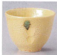
413-8-714 黄瀬戸いっぶく碗 1,190円 10.5×10.3×7.9cm 43818713