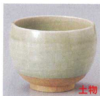
413-10-214 緑唐津たっぶり碗 1,150円 10×7.8cm 10入 43416211