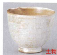
413-5-514 窯変渦多用碗 1,500円 10.2×8.5cm 44814512