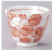
413-7-514 赤呉須花ゆとり碗 1,400円 9.7×7.7cm 44812512