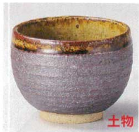
413-13-504 南蛮ビードロー服碗 1,050円 10×7.4cm (330cc) 41313504