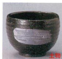
413-11-514 刷毛ゆったり碗 1,100円 10.1×7.4cm 43426511