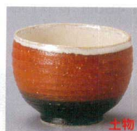
413-12-514 赤黒ゆったり碗 1,100円 10.1×7.4cm 44822512