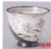
413-3-514 紫舞花多用碗 1,600円 10.3×8.6cm 44811512