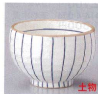
413-9-734 粉引呉須十草姫小井 1,160円 9.7×6.6cm 43420731