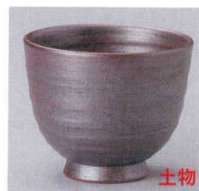
413-4-514 鉄砂多用碗 1,500円 10.2×8.5cm 44813512