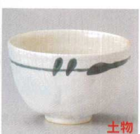
413-30-524 せせらぎいっぶく碗 680円 10.4×6.5cm 43511521