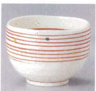
413-22-514 粉引赤絵たっぶり碗 890円 10×7.4cm 43833513