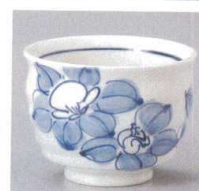
413-6-514 呉須花ゆったり碗 1,400円 10.1×7.8cm 44815512