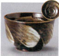
413-27-354 益子荒刷毛たっぶり碗 740円 10.1×6.5cm (250cc) 49740352