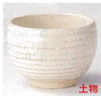
413-14-504 白萩一服碗 1,050円 10×7.4cm (330cc) 41314504