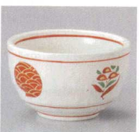
413-33-354 粉引赤絵丸紋3.5深口小鉢 530円 10.3×6.5cm 43531351