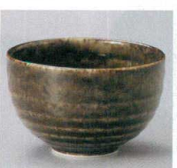
413-35-674 窯変織部いっぶく碗 450円 10.5×6.5cm (300cc) 43237671