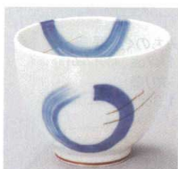
413-16-214 まる印多用碗 950円 10.4×8.2cm 43425211