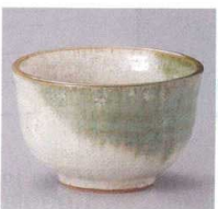
413-26-354 カイヤギ織部たっぶり碗 810円 10.1×6.5cm (250cc) 43501351