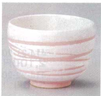
413-20-724 ピンク渦小井 900円 10.2×7.3cm 43432721