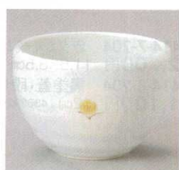
413-18-354 ブルー山茶花小井 920円 10.6×7.2cm 44911352