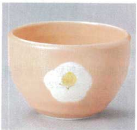
413-19-354 ピンク山茶花小井 920円 10.6×7.2cm 44910352