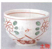
413-23-524 二輪花いっぶく碗 930円 10.1×7cm 44831522