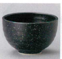
413-34-674 黒銀いっぶく碗 450円 10.5×6.6cm 44931672