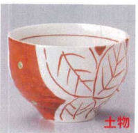
413-25-524 木の葉いっぶく碗 930円 10.1×7cm 44832522