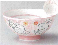
425-37-264 白磁スマイルうさぎ子供茶碗 480円 10.5×5cm 180入 42537264