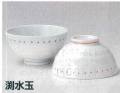
洩水玉 425-21-374 BL中平(美濃焼) 350円 11.3×6cm 45535373 425-22-374 PK中平(美濃焼) 350円 11.3×6cm 45536373