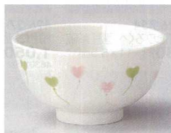
425-35-654 風船中平 320円 11×5.8cm 45341653