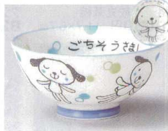
425-41-264 ごちそうさま子供茶碗 480円 10.5×5cm 180入 42541264

そば縁口皿 346P~ 二品皿 三品皿 仕切皿 353P~ 麺皿 ハスタ皿 360P~ ボール 368P~ シリーズ併 多用丼 反井 372P~ 多用碗 飯器 フタ井 406P~ 大茶・毛料 大平・中平 睦 418P~ 寿司湯呑 432P~ 長湯呑 煎茶 茶器揃 434P~ 土瓶 急須 ポット 450P~ 茶道具 抹茶碗 462P~