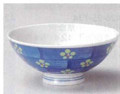
425-36-514 小梅中平 270円 11.9×5.1cm 46540512