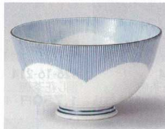
425-24-274 梅十草軽量茶碗 650円 11×6.8cm 45512273