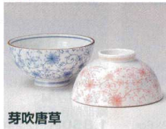
芽吹唐草 425-13-204 青茶碗(軽量) 550円 11.8×5.7cm 45144203 425-14-204 赤茶碗(軽量) 550円 11.8×5.7cm 45143203