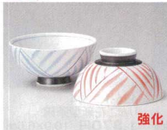
強化 425-11-714 赤絵間取十草中平 580円 11.5×5.7cm 42511714 425-12-714 ゴス間取十草中平 580円 11.5×5.7cm 42512714