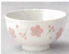
425-33-374 さくらさくら中平(美濃焼) 350円 11×6cm 45340373