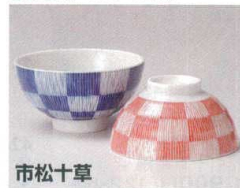
市松十草 425-19-374 BL大平(美濃焼) 380円 12×6.5cm 45150373 425-20-374 RD中平(美濃焼) 350円 11.3×6cm 45149373