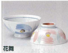
花舞 425-1-794 大平 650円 13.2×6cm 45142793 425-2-794 中平 580円 12×5.6cm 45141793