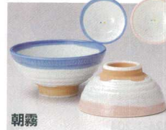
朝霧 425-9-714 大平 590円 13×5.9cm 44732711 425-10-714 中平 550円 11.3×5.2cm 44731711