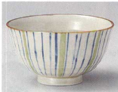
425-27-374 二色十草飯碗 500円 11.5×6.3cm 42527374