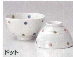
ドット 425-7-714 飯碗 大 600円 11.6×6.6cm 45136713 425-8-714 飯碗 小 550円 10.8×6.2cm 45135713