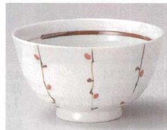
425-26-374 白梅飯碗 500円 11.5×6.5cm 42526374