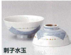
刺子水玉 425-3-714 大平 640円 13.2×6.1cm 44724711 425-4-714 中平 550円 11.8×5.4cm 44723711