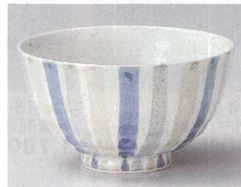
425-25-714 ナシ地三色十草中平 600円 11.3×6.4cm 120入 45328783