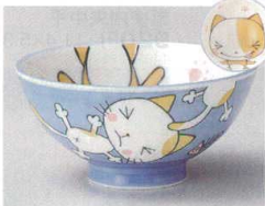
425-38-264 ブルーネコ子供茶碗 480円 10.5×5cm 180入 42538264