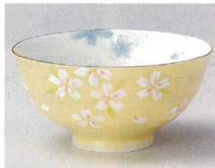
425-29-284 京梅黄巻茶碗 450円 11.5×5.6cm 120入 42529284