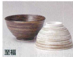
至福 425-17-204 手引飯碗(大) 430円 12×6.5cm 45146203 425-18-204 手引飯碗(小) 400円 10.8×6.5cm 45145203