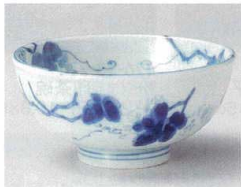
425-28-554 藍染ぶどう軽量茶碗 500円 11.5×5.6cm 45517553