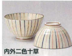
内外二色十草 425-5-714 飯碗 大 600円 11.6×6.6cm 45138713 425-6-714 飯碗 小 550円 10.8×6.2cm 45137713