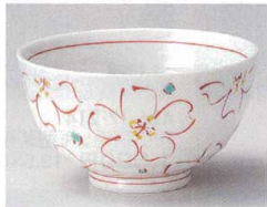
425-23-714 赤絵花多用碗 800円 11×6.5cm 45435713