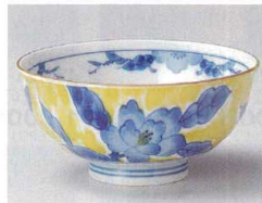
425-30-374 黄彩花紋中平(美濃焼) 440円 11.5×5.6cm 45534373