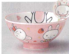
425-40-264 ピンクウサギ子供茶碗 480円 10.5×5cm 180入 42540264