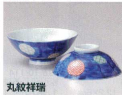
丸紋祥瑞 425-15-714 中平 490円 11.8×4.9cm 44259711 425-16-714 大平 540円 12.8×5.2cm 44260711