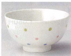
425-34-654 水玉飯碗 320円 11×5.8cm 46341652