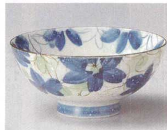
425-31-284 香(青)茶碗 350円 11.5×5.4cm 120入 42531284