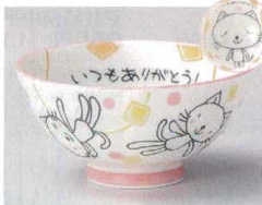
425-39-264 いつもありがとう子供茶碗 480円 10.5×5cm 180入 42539264