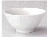
429-33-664 さざ波茶碗 370円 12×6cm 42933664