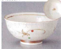
429-10-374 粉引赤絵唐草茶碗 560円 11.8×5.5cm 45040371