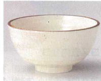
429-38-214 白ハンテン茶碗 320円 11×5.8cm 42938214