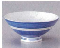
429-26-734 茶筋呉須刷毛中平 410円 12.3×5.5cm 45530733