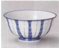
429-41-714 太十草汁碗 480円 12×5.7cm 45117711