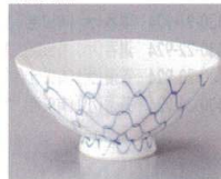
429-20-714 外アミ厚口中平 440円 12.2×5.7cm 45127711