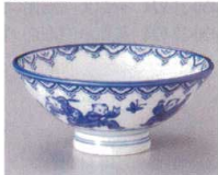
429-34-714 内外唐子中平 360円 12×5.5cm 45533713