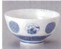
429-32-374 丸紋山水大平(美濃焼) 380円 12×6.5cm 45531373