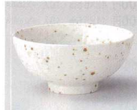
429-31-204 白いらば六兵衛中平 380円 11.7×5.5cm 42931204