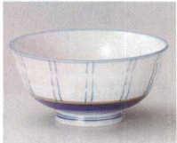
429-42-714 二本刷毛目汁碗 480円 12×5.7cm 45118711

糸線口蓋 346P~ 二品皿 三品皿 仕切皿 353P~ 類皿 バスタ皿 360P~ ボール 368P~ シリーズ 多用丼 反井 372P~ 多用碗 飯器 フタ丼 406P~ 大茶毛料 大平・中平 418P~ 寿司湯呑 432P~ 長湯呑 煎茶 茶器揃 434P~ 土瓶 急須 ホット 450P~ 茶道具 抹茶碗 462P~