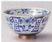
429-16-034 古染草花中平 540円 11×6.5cm 42916034