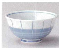
429-5-734 一珍十草汁碗 610円 12×5.9cm 42905734