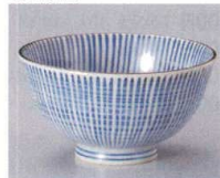
429-19-704 千段十草中平 480円 11×6cm 45115701