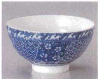
429-30-374 波祥瑞大平(美濃焼) 380円 12×6.5cm 45532373