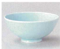
429-4-674 深山青磁茶碗 620円 12×5.3cm 54868671