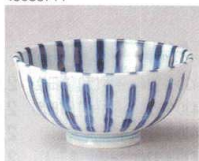
429-12-034 濃十草茶碗 550円 11.5×5.6cm 42912034