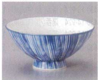
429-24-714 ハケメ厚口中平 410円 12.2×5.7cm 45128711