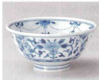
429-23-034 間取草花中平 420円 12.5×6cm 42923034