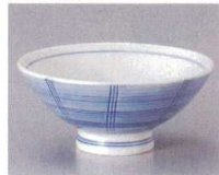
429-27-734 削り格子中平 410円 12.3×5.5cm 45529733