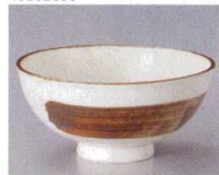
429-15-714 サビ刷毛目中平 550円 12×5.8cm 45111711