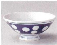
429-28-714 水玉中平(厚口) 410円 12×5.5cm 42928714