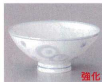
429-3-714 丸紋中平 620円 11.2×5cm 45036781