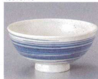
429-14-714 ゴス刷毛目中平 550円 12×5.8cm 45112711