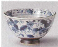
429-17-034 古染彩華中平 540円 11×6.5cm 42917034