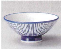
429-35-724 厚口腰ルリ刷毛目中平 340円 12.3×5.4cm 42935724