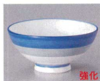
429-1-704 二色ライン中平 630円 11.5×5.5cm 45037701