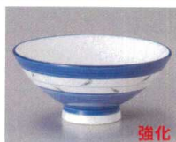
429-6-714 花つなぎ中平 600円 11.5×5.2cm 45038711