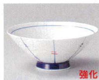
429-2-714 新芽十草中平 630円 11.6×5cm 42902714