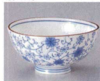
429-13-274 芽吹き唐草軽量茶碗 550円 11.8×6cm 45518273