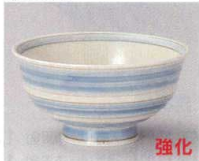
429-40-704 クリーム二色ライン汁碗 880円 11.3×5.8cm 45001701