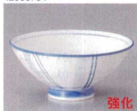
429-11-794 親子十草中平 560円 11.6×5.2cm 45105791