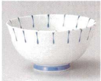
429-36-034 瀧十草中平 360円 11×6cm 42936034