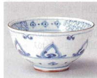
429-21-204 故宮茶碗 430円 11×6cm 42921204