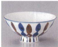
429-29-714 二色点十草厚口中平 410円 12.2×5.7cm 46529712