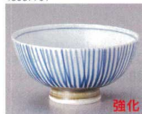
429-7-714 錆卷十草中平 600円 11.5×5.7cm 45511713