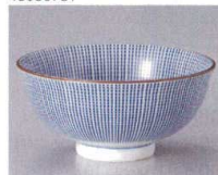
429-9-654 千段十草中平 600円 11.8×5.5cm 45502653