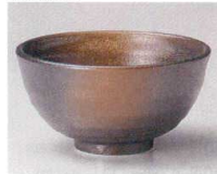
429-39-214 黒備前茶碗 320円 11×5.8cm 42939214