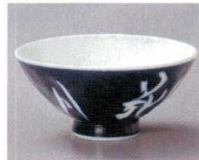
429-25-714 雪月花厚口中平 410円 12.2×5.7cm 46528712