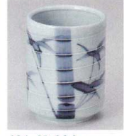
436-41-284 竹長湯呑 480円 6.2×8cm(160cc) 20入 49335281