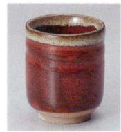
436-13-204 赤ウノフ湯呑 650円 7×8.9cm(200cc) 49043201