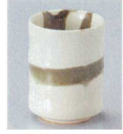
436-31-514 薄墨流し湯呑 500円 6.4×8.4cm(160cc) 10入 46424513