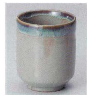
436-5-204 均霰長湯呑 730円 7×8.8cm(200cc) 48829201