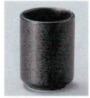
436-22-254 黒結晶湯呑 580円 6.2×8.2cm(160cc) 20入 50526252