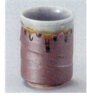
436-34-204 雷雲切立湯呑 500円 6.2×8.4cm(170cc) 49428201