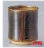
436-18-214 織部湯呑 630円 7.2×7.8cm(205cc) 46334213