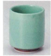
436-20-204 ヒツ貫入切立(小) 600円 7×8.2cm(190cc) 49133201