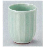
436-19-194 ヒツ16角湯呑 600円 6.8×8.5cm(220cc) 50436192