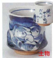
436-1-734 ダルマねじり型湯呑 770円 7.5×8.5cm(250cc) 10入 48330731

そば罎口罎 346P~ 二品皿 三品皿 仕切皿 353P~ 種皿 ハスタ皿 360P~ ボール 368P~ シリーズ# 多用丼 反井 372P~ 多用碗 飯器 フタ丼 406P~ 大茶毛料 大平・中平 陸 418P~ 寿司湯呑 432P~ 長湯呑 煎茶 茶器揃 434P~ 土瓶 急須 ポット 450P~ 茶道具 抹茶碗 462P~