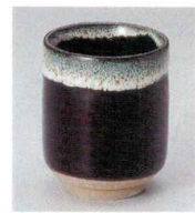
436-14-204 黒ウノフ流し湯呑 650円 7×8.9cm(200cc) 49042201