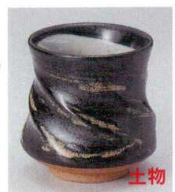
436-2-734 黒釉黄ハケねじり型湯呑 720円 7.5×8.5cm(250cc) 10入 48331731