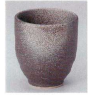
436-26-364 黒伊賀長湯呑 540円 7.5×8.5cm(230cc) 10入 49041361