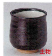
436-7-734 黒六ベエ湯呑 720円 7.8×8.5cm(280cc) 10入 48322731