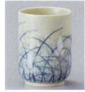
436-27-714 武蔵野長湯呑 540円 6.1×8.4cm(220cc) 49329711