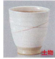
436-28-214 粉引線彫湯呑 540円 7.5×8cm(165cc) 10入 49134211