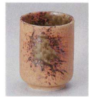
436-12-624 伊賀の里湯呑(小) 600円 6.6×8.6cm(190cc) 49130621