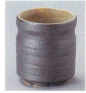
436-24-204 黒ガラス湯呑(小) 570円 6.9×7.8cm(190cc) 49137201