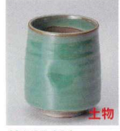
436-37-034 均霰ベコ組湯呑 小 460円 6.3×8.5cm 10入 46132033