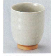
436-42-274 貫入腰丸湯呑 470円 6.8×8.5cm(200cc) 20入 49047271