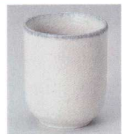
436-3-624 月の香長湯呑 750円 6.8×8.2cm(190cc) 46327623