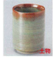
436-33-254 緑釉長湯呑 500円 6.5×8.3cm(160cc) 20入 50330252