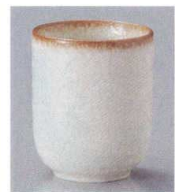
436-4-624 若草長湯呑 750円 6.8×8.2cm(190cc) 46325623