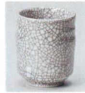
436-21-214 すみ貫入湯呑 640円 7.3×8.7cm(230cc) 10入 43621214