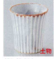
436-40-214 ねずみ志野十草反湯呑 480円 7×7.6cm(125cc) 20入 49139211