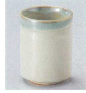
436-35-204 青磁口均霰湯呑 500円 6.3×8.4cm(170cc) 48830201