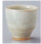
436-17-714 白雲湯呑 630円 8.4×8cm(180cc) 46335713