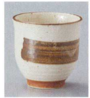
436-15-714 茶刷毛目湯呑 640円 7.5×7.5cm(160cc) 46337713