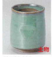
436-36-034 均霰ベコ組湯呑 大 500円 6.6×9cm 10入 46131033