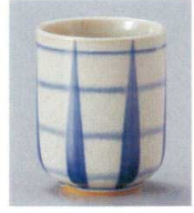
436-30-714 御深井十草長湯呑 540円 6.5×8cm(200cc) 49229711