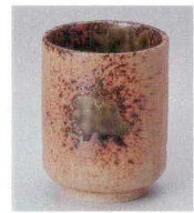
436-11-624 伊賀の里湯呑(大) 670円 7×9cm(240cc) 49034621