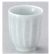
436-9-724 青磁削長湯呑 720円 6.8×8cm(160cc) 10入 49328721