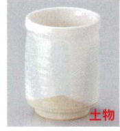
436-32-524 本粉引湯呑 550円 6.5×8.7cm(190cc) 10入 49135521