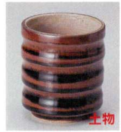
436-16-214 天目湯呑 630円 7.2×7.8cm(205cc) 46125213