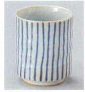
436-23-204 うのふ十草湯呑(小) 570円 6.8×8.3cm(190cc) 46416203