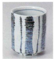
436-8-284 水晶十草湯呑 700円 7.2×8.3cm(200cc) 100入 50427282