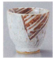
436-10-714 うのふストライプ湯呑 690円 8.4×8cm(180cc) 46333713