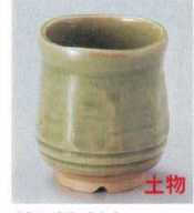
436-39-214 灰釉ケズリ湯呑 480円 7×8.2cm(185cc) 20入 49144211