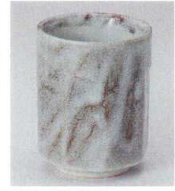
436-25-274 八角ソギ青志野湯呑 550円 7×9cm(200cc) 20入 49046271