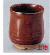
436-38-214 鉄砂ケズリ湯呑 480円 7×8.2cm(185cc) 20入 49143211