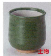
436-6-734 グリーン六ベエ湯呑 720円 7.8×8.5cm(280cc) 10入 48329731