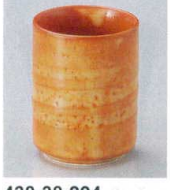
438-38-204 赤志野長湯呑 300円 6×7.7cm(120cc) 49444201