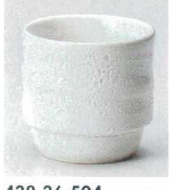
438-36-504 白スタック湯呑 300円 6.7×6.6cm 43836504