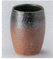
438-3-204 備前たる湯呑 1,300円 5.5×7.5cm(120cc) 49403201