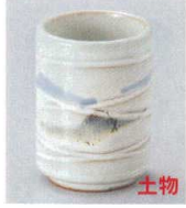
438-19-214 うずしお湯呑 590円 5.8×8cm(120cc) 20入 49420211