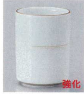
438-11-054 灰呉須線長湯呑 750円 6.2×8.2cm(160cc) 10入 49316051