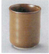
438-20-034 ブラウン長湯呑 420円 6.3×7.9cm(150cc) 10入 49242031