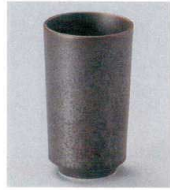
438-4-204 黒マット長湯呑 1,150円 5.5×10cm(140cc) 46403203