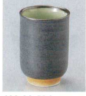
438-22-514 グレー刷毛ミニ湯呑 400円 5.3×7.8cm(130cc) 30入 49431511