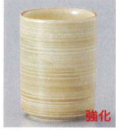
438-10-054 茶刷毛長湯呑 750円 6.2×8.2cm(160cc) 10入 49317051