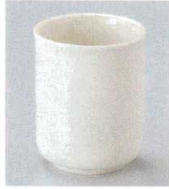
438-21-034 ホワイト長湯呑 420円 6.3×7.9cm(150cc) 10入 49241031