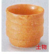
438-25-254 赤志野スタック湯呑 360円 6.9×6.5cm(140cc) 46524253