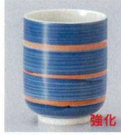
438-8-704 駒筋(青)長湯呑 880円 6.5×8.3cm(180cc) 10入 49216701