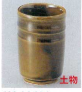
438-34-254 織部コップ 320円 5.8×8.9cm(140cc) 20入 46532253