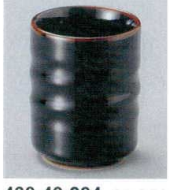
438-40-284 天目湯呑 260円 6×7.7cm(120cc) 160入 50344282