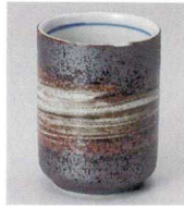
438-14-624 白刷毛湯呑(大) 690円 6.5×8.6cm(190cc) 49330621