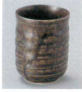
438-28-204 いらぼこげ茶反湯呑 350円 6.2×8cm(170cc) 46523203