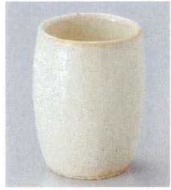
438-2-204 粉引たる湯呑 1,300円 5.5×7.5cm(120cc) 49404201