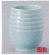
438-1-054 青白磁六兵衛長湯呑 1,500円 6.5×8cm(170cc) 50407052

そば罎口罎 346P~ 二品皿 三品皿 仕切皿 353P~ 麺皿 ハスタ皿 360P~ ボール 368P~ シリーズ# 多用井 皮井 372P~ 多用碗 飯器 フタ井 406P~ 大茶毛料 大平・中平 陸 418P~ 寿司湯呑 432P~ 長湯呑 煎茶 茶器揃 434P~ 土瓶 急須 ポット 450P~ 茶道具 抹茶碗 462P~