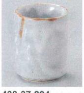
438-37-204 嵐志野長湯呑 300円 6×7.7cm(120cc) 49443201