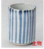
438-16-514 呉須十草コブ茶 650円 5.8×8cm(150cc) 20入 49417511