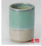
438-15-514 ヒワ流コブ茶 650円 5.8×8cm(150cc) 20入 49412511