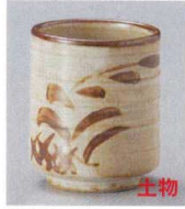
438-12-734 乾山風芦絵長湯呑 730円 6.2×7.5cm(170cc) 10入 49326731