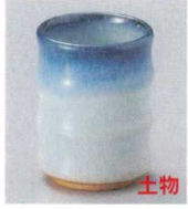
438-17-514 青流シコブ茶 650円 5.8×8cm(140cc) 20入 50619512