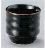
438-24-274 スタック湯呑黒天目 350円 6.5×6.5cm(150cc) 20入 49446271