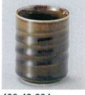
438-42-284 織部湯呑 260円 6×7.7cm(120cc) 160入 50348282