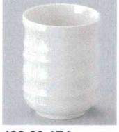
438-30-674 白釉長湯呑 330円 6.4×8cm(160cc) 10入 49438671