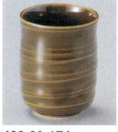
438-31-674 織部長湯呑 330円 6.4×8cm(160cc) 10入 49439671