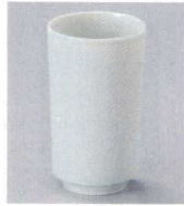
438-5-204 青白長湯呑 1,150円 5.5×10cm(140cc) 46404203