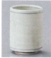
438-13-734 マット湯呑(小) 720円 6×8.1cm(150cc) 10入 49324731