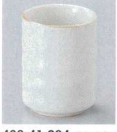
438-41-284 白志野湯呑 260円 6×7.7cm(120cc) 160入 50345282