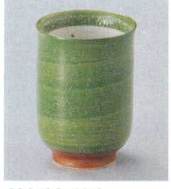
438-23-514 グリーンミニ湯呑 400円 5.3×7.8cm(130cc) 30入 49432511