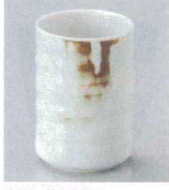
438-35-204 白志野流し湯呑 350円 6×8.4cm(140cc) 49440201