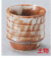
438-26-254 ネズミ志野スタック湯呑 360円 6.9×6.5cm(140cc) 46526253