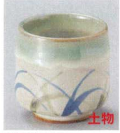
438-9-214 ヒスイ芦湯呑 850円 6.5×6.8cm(155cc) 46409213