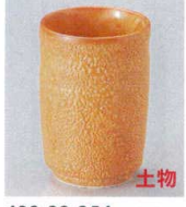
438-32-254 赤志野コップ 320円 5.8×8.9cm(140cc) 20入 46531253