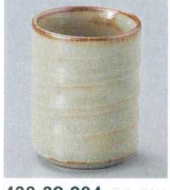
438-39-284 貴入小湯呑 270円 6×7.7cm(120cc) 120入 50347282