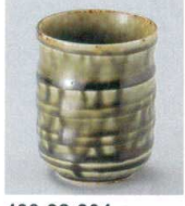
438-29-204 いらぼ織部反湯呑 350円 6.2×8cm(170cc) 46522203