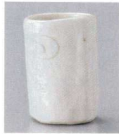
438-6-204 ねり込み湯呑(小) 1,040円 5.5×8.4cm(120cc) 49405201