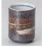
438-18-624 白刷毛湯呑(小) 610円 6×8cm(150cc) 49422621