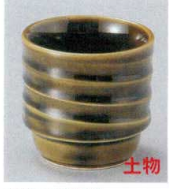
438-27-254 織部スタック湯呑 360円 6.9×6.5cm(140cc) 46525253