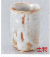
438-33-254 ネズミ志野コップ 320円 5.8×8.9cm(140cc) 20入 46533253