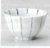
442-26-694 麦わら十草 仙茶(有田焼) 850円 9×5.5cm 5×4.8入 47629693