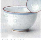
442-34-694 内外草花干茶(有田焼) 800円 9×5.5cm(150cc) 10入 50214691