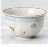
442-35-694 花小紋反仙茶(有田焼) 800円 9×5.5cm(180cc) 10入 50212691