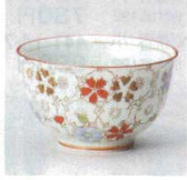
442-18-924 らんまん干茶(有田焼) 1,000円 8.9×5.3cm(130cc) 10入 50207921