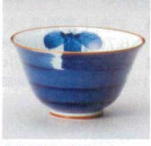
442-24-694 刷毛善内ぶどう反仙茶(有田焼) 850円 9.5×5.5cm(150cc) 10入 50218691