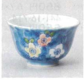
442-16-694 枝梅厚潤反干茶(有田焼) 1,100円 9.5×6cm(150cc) 10入 50221691