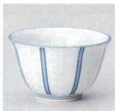
442-3-694 一珍十草反干茶(有田焼) 1,400円 9.5×5.5cm(190cc) 10入 50202691