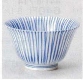
442-9-924 乱千筋反干茶(有田焼) 1,200円 9.5×5.5cm(100cc) 10入 44209924