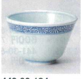
442-32-694 たご唐草反仙茶(有田焼) 800円 9.5×6cm(200cc) 10×16入 50213691