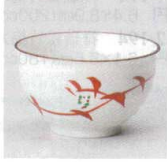
442-19-924 錦唐草干茶(有田焼) 900円 9×5.3cm(130cc) 10入 50231921