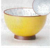
442-25-694 黄さくら干茶(有田焼) 900円 8.5×5.5cm(180cc) 10入 50229691