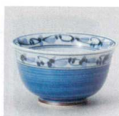
442-7-694 菊地紋 仙茶(有田焼) 1,300円 9.5cm 5×4.8入 47603693