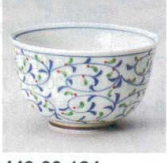
442-33-694 都唐草反仙茶(有田焼) 800円 9×5.5cm(180cc) 10入 51427692