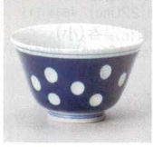
442-15-694 水玉反干茶(有田焼) 1,100円 9.5×5.5cm(200cc) 10入 50227691