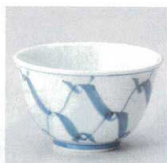
442-5-694 京網反干茶(有田焼) 1,400円 9.5×6cm(190cc) 10入 50203691