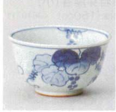
442-8-694 平成ぶどう反仙茶(有田焼) 1,400円 9.5×5cm(150cc) 5入 51402692