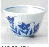
442-30-694 青磁桔梗反干茶(有田焼) 800円 9.5×5.5cm(200cc) 10入 50224691