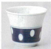
442-2-924 新水玉反干茶(有田焼) 1,600円 7.6×6.8cm 10入 44202924