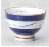
442-20-694 帯松葉 仙茶(有田焼) 950円 8.5×6cm 5×4.8入 47616693