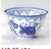
442-29-694 唐子反干茶(有田焼) 900円 9×5.5cm(150cc) 10入 50230691