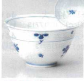
442-27-694 幸梅反仙茶(有田焼) 800円 9.5×5.5cm(150cc) 10入 50219691