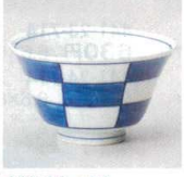
442-23-694 濃市松反仙茶(有田焼) 950円 9.5×5.5cm(190cc) 10入 50226691