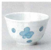
442-4-694 香梅反干茶(有田焼) 1,400円 9.5×6cm(190cc) 10入 50205691