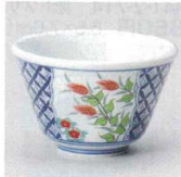
442-14-694 錦麦牡丹反仙茶(有田焼) 1,100円 9.5×6cm(200cc) 10入 51414692