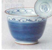
442-11-924 コス巻桔梗干茶(有田焼) 1,000円 8.5×7.5cm(130cc) 10入 50206921