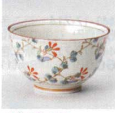
442-28-694 草花反仙茶(有田焼) 800円 9×5.5cm(150cc) 10入 51432692