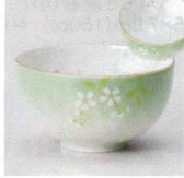
442-10-694 花あかり京仙茶(有田焼) 1,200円 8.8×5cm(180cc) 10入 50234691