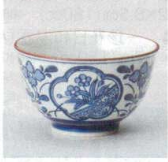
442-17-924 古染万歴干茶(有田焼) 1,000円 9.5×5cm 10入 44217924