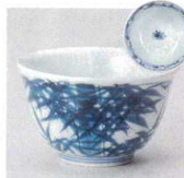
442-6-694 呉竹厚潤反干茶(有田焼) 1,400円 9.5×5.5cm(190cc) 10入 50204691