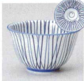
442-1-694 内外刷毛反干茶(有田焼) 1,700円 9.5×6cm(190cc) 10入 50201691

そば罎口 346P~ 二品皿 三品皿 仕切皿 353P~ 繕皿 ハスタ皿 360P~ ボール 368P~ シリーズ 多用丼 反井 372P~ 多用碗 飯器 フタ丼 406P~ 大茶・毛料 大平・中平 陸 418P~ 寿司湯呑 432P~ 長湯呑 煎茶 茶器揃 434P~ 土瓶 急須 ポット 450P~ 茶道具 抹茶碗 462P~