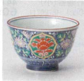
442-13-694 古伊万里木甲京仙茶(有田焼) 1,100円 8.5×6cm(150cc) 10入 51416692