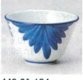
442-31-694 大輪菊厚潤反干茶(有田焼) 800円 9.5×6cm(200cc) 10入 50223691