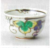
442-22-694 豆彩ぶどう反仙茶(有田焼) 950円 9×5.5cm(180cc) 10入 51410692