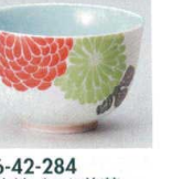
446-42-284 菊紋外ビスク煎茶 390円 8.6×5.6cm(150cc) 150入 44642284