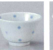
446-5-214 水玉厚口反干茶 460円 9.3×5.5cm(170cc) 49822211