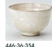
446-36-354 粉引煎茶 410円 8.8×5.7cm(150cc) 44636354