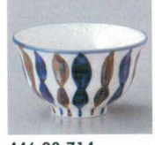
446-23-714 二色点十草厚口煎茶 420円 9.5×5.3cm(200cc) 51041712