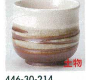
446-30-214 白釉渦玉湯呑 420円 7.5×6.3cm(160cc) 20入 44630214