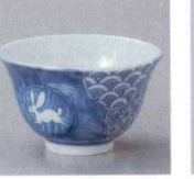
446-11-714 京祥瑞反干茶 450円 9.2×5.5cm(180cc) 49825711