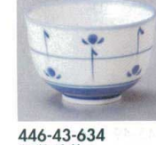
446-43-634 新芽干茶 390円 8.5×5.5cm(170cc) 120入 49927631