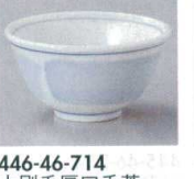
446-46-714 太刷毛厚口干茶 380円 9.8×5.3cm(180cc) 49841711