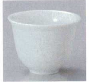
446-9-374 青白磁つゆ草反煎茶 450円 7.6×6cm(120cc) 49940371