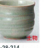
446-28-214 亀甲貫入玉湯呑 420円 7.5×6.3cm(160cc) 20入 44628214