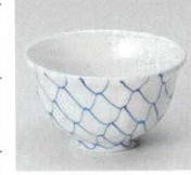
446-15-714 アミ厚口反干茶 440円 9.5×5.3cm(200cc) 49837711