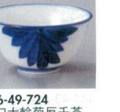
446-49-724 厚口大輪菊反干茶 380円 9.8×5cm(180cc) 49838721