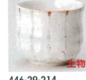
446-29-214 白志野十草玉湯呑 420円 7.5×6.3cm(160cc) 20入 44629214