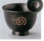
446-17-634 黒うず干茶 430円 9.2×7cm(230cc) 47141633