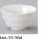
446-32-204 白班点変型干茶 410円 9.4×5.2cm(160cc) 50747202