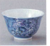
446-10-714 山ブドウ反干茶 450円 9.4×5.2cm(180cc) 49823711