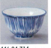
446-24-714 刷毛目厚口反干茶 420円 9.4×5.3cm(200cc) 49835711