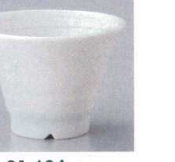
446-21-634 白EL干茶 420円 9.2×6.8cm(190cc) 50948632