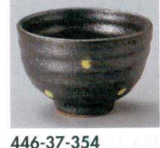
446-37-354 黒ゆず黄水玉煎茶 410円 8.8×5.8cm(160cc) 50744352