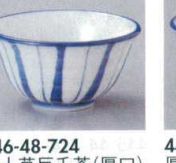
446-48-724 太十草反干茶(厚口) 380円 9.8×5cm(180cc) 49844721