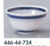
446-44-724 厚口二色筋反干茶 390円 9.8×5cm(180cc) 49843721