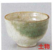
446-2-354 カライキ織部煎茶 460円 8.8×6cm(160cc) 47129353