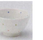
446-7-654 水玉干茶 450円 9.1×5.5cm(170cc) 5入 50918652