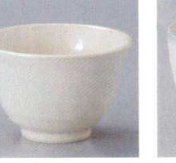
446-13-034 ホワイト反干茶 450円 8.6×5.6cm(150cc) 20入 49644031