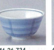
446-26-734 削り格子干茶 410円 9.8×5cm(180cc) 47430733