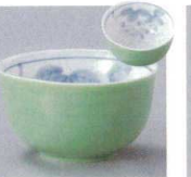
446-4-284 外グリーンドウ煎茶 460円 8.7×4.7cm(150cc) 120入 50912282