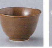
446-12-034 プラウン反干茶 450円 8.6×5.6cm(150cc) 20入 49643031