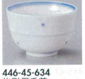
446-45-634 梅彫反干茶 370円 8.4×5.5cm(170cc) 49746631