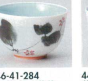
446-41-284 ツタ外ビスク煎茶 390円 8.6×5.6cm(150cc) 150入 44641284