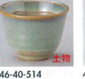
446-40-514 均窯反干茶 400円 8.2×5.9cm(150cc) 20入 49649511