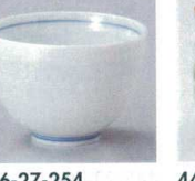
446-27-254 青白磁小干茶 400円 8.3×5.8cm(150cc) 49928251