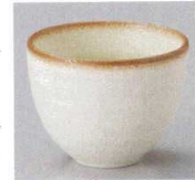
446-8-624 若草湯呑 450円 7.7×6cm(150cc) 47137623