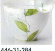
446-31-284 リーフスリム干茶 420円 7.8×5.9cm(150cc) 120入 44631284