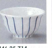
446-25-714 ゴス十草反干茶(厚口) 420円 9.7×5.4cm(200cc) 49839711