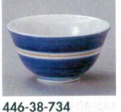
446-38-734 茶筋呉須刷毛干茶 410円 9.8×5cm(180cc) 47431733