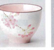
446-19-284 塗り分け桜スリム干茶 430円 7.8×5.9cm(150cc) 120入 44619284