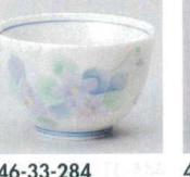
446-33-284 すみれ小煎茶 400円 7.8×5.9cm(120cc) 160入 44633284