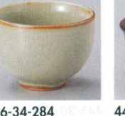
446-34-284 口サビ貫入煎茶 400円 8×5.5cm(150cc) 120入 50931282