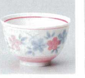
446-18-284 薄墨桜反煎茶(赤) 430円 9.1×5.6cm 120入 44618284