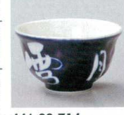
446-22-714 雪月花反干茶(厚口) 420円 9.3×5.1cm(200cc) 49836711