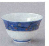
446-3-714 帯木の葉反干茶 460円 9.6×5.5cm(180cc) 49821711