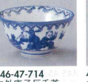
446-47-714 内外唐子反干茶 380円 9.8×5.3cm(180cc) 47439713