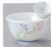
446-1-714 ナデシコ反干茶 480円 8.5×5cm(180cc) 49918711

そば壺口揃 346P~ 二品皿 三品皿 仕切皿 353P~ 種皿 バス夕皿 360P~ ボール 368P~ シリーズ併 多用丼 反丼 372P~ 多用碗 飯器 フタ丼 406P~ 大茶毛料 大平・中平 睦 418P~ 青司湯呑 432P~ 長湯呑 煎茶 茶器揃 434P~ 土瓶 急須 ポット 450P~ 茶道具 抹茶碗 462P~