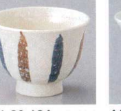
446-20-634 二色十草干茶 430円 9.2×7cm(230cc) 47142633