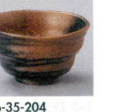
446-35-204 黒備前吹き変型六兵衛干茶 410円 9.4×5.3cm(170cc) 49645201