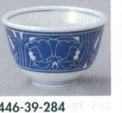
446-39-284 花紋煎茶 400円 9×5.6cm(200cc) 120入 50929282