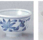
446-6-634 鉄仙厚口干茶 460円 9×5.8cm(170cc) 120入 49832631