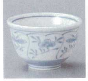
446-16-284 なつな厚口反煎茶 430円 9×5.8cm(200cc) 120入 50925282