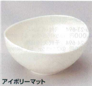
アイボリーマット

45-22-354 楕円5.0鉢 630円 16.5×15.4×6.4cm 09532353 45-23-354 楕円4.0鉢 380円 13.5×13×6.4cm 09533353 45-24-354 楕円3.5鉢 330円 11×10.5×5.3cm 09534353