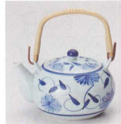
453-10-924 万暦唐草4号土瓶(M)(有田焼) 2,500円 420cc 3入 47913923