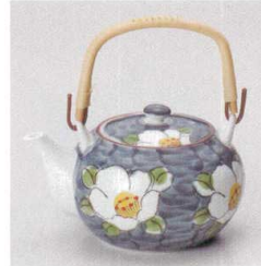
453-4-924 白花4号土瓶(有田焼) 2,500円 600cc 3入 47915923