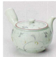
453-24-924 うず唐草2.5号急須(M)(有田焼) 2,400円 360cc 50405921