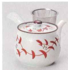
453-11-924 錦唐草3号大急須(M)(有田焼) 3,500円 600cc 3入 50424921