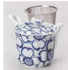
453-19-924 大輪花U付急須(青)(有田焼) 4,000円 350cc 3入 45319924