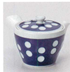
453-23-924 水玉2.5号急須(有田焼) 3,000円 320cc 50407921