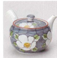
453-25-924 白花急須(有田焼) 2,400円 380cc 47925923