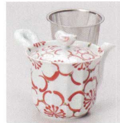
453-20-924 大輪花U付急須(赤)(有田焼) 4,000円 350cc 3入 45320924