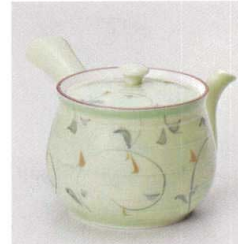
453-15-924 うず唐草3号大急須(M)(有田焼) 2,800円 600cc 3入 50423921