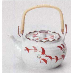
453-3-924 錦唐草4号土瓶(M)(有田焼) 2,700円 420cc 3入 50312921