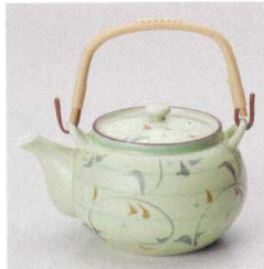
453-2-924 うず唐草4号土瓶(M)(有田焼) 2,800円 550cc 3入 50309921