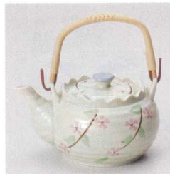
453-7-924 しだれ花4号土瓶(M)(有田焼) 2,400円 420cc 3入 47912923