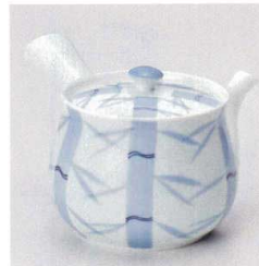
453-13-924 手描笹3号大急須(M)(有田焼) 2,900円 600cc 3入 50425921