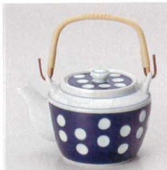
453-1-924 水玉4号土瓶(有田焼) 3,000円 540cc 3入 50317921