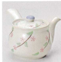
453-12-924 しだれ花大急須(M)(有田焼) 2,800円 600cc 3入 45312924