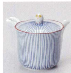
453-18-924 千筋U付大急須(有田焼) 3,300円 600cc 3入 45318924