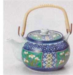
453-5-924 グリーンアヤメ4号土瓶(有田焼) 2,700円 500cc 3入 50313921