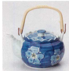
453-8-924 大梅4号土瓶(M)(有田焼) 2,300円 420cc 3入 50324921