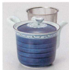
453-16-924 ゴス桔梗大急須(U)(有田焼) 3,300円 380cc 3入 50418921