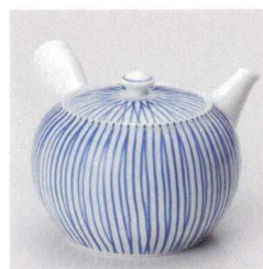
453-21-924 乱千筋2.5号急須(有田焼) 3,300円 340cc 45321924