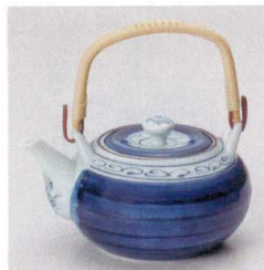
453-6-924 ゴス巻桔梗4号土瓶(有田焼) 2,700円 400cc 3入 50427921