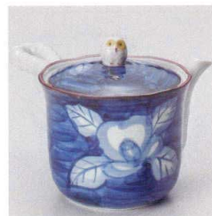
453-17-924 ダミ椿U付大急須(有田焼) 3,300円 600cc 3入 45317924