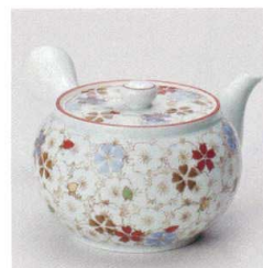
453-22-924 らんまん2.5号急須(M)(有田焼) 3,300円 360cc 50402921