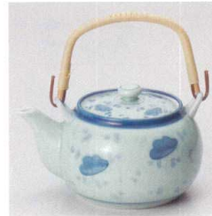
453-9-924 花の舞4号土瓶(有田焼) 2,300円 550cc 3入 50321921