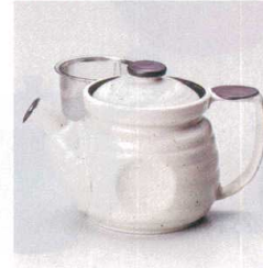
459-11-354 粉引ポット(U)カゴ 2,500円 550cc 45911354