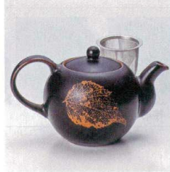
459-2-714 天目木の葉ポット(アミ付) 4,500円 600cc 51120711