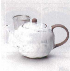
459-1-714 白志野ポット(アミ付) 4,300円 600cc 51119711