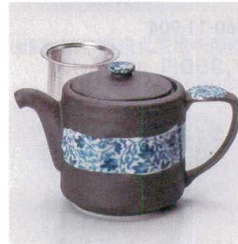
459-20-284 オビ唐草ポット 2,100円 15×9×11cm(400cc) 48入 52311282