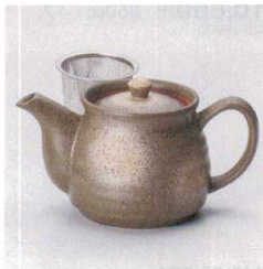
459-24-374 白吹きポット 2,000円 18×11×10.5cm(540cc) 45924374