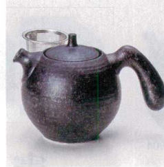
459-3-204 銀黒玉ポット 3,300円 16×9.8×11cm(400cc) 45903204