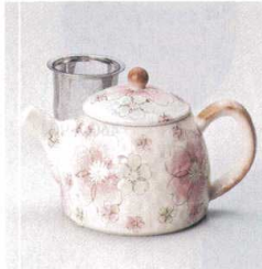
459-8-514 モダン桜ポットUカゴ付 2,700円 500cc 45908514