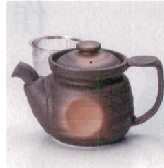
459-10-354 黒備前ポット(U)カゴ 2,500円 550cc 45910354