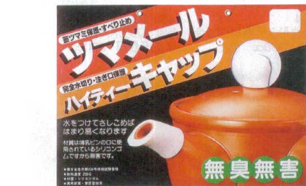
459-21-814 白ハイティーキャップ(大)50ヶ 14,000円 48620813 459-22-814 白ハイティーキャップ(小)50ヶ 13,000円 48619813 459-23-814 白ハイティーキャップ(特大)30ヶ 9,800円 48621813

そば焼口壺 346P~ 二品皿 三品皿 仕切皿 353P~ 種皿 バスタ皿 360P~ ボール 368P~ シリーズ井 多用井 反井 372P~ 多用碗 飯器 フタ井 406P~ 大茶・毛科 大平・中平 陸 418P~ 寿司湯呑 432P~ 長湯呑 煎茶 茶器揃 434P~ 土瓶 急須 ポット 450P~ 茶道具 抹茶碗 462P~