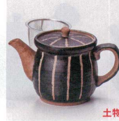
459-4-714 畵クサ(黒)ポット(大)(アミ付) 3,200円 500cc 51010711 459-5-714 畵クサ(黒)ポット(小)(アミ付) 3,000円 365cc 51009711