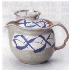
459-14-364 唐津草文ポット 2,400円 15.5×11×12cm(480cc) 6入 52220362