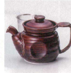
459-12-554 飴釉ポット(U)カゴ 2,500円 550cc 45912554