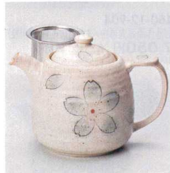
459-19-284 クリーム花ポット 2,200円 15×9×11cm(450cc) 48入 52312282