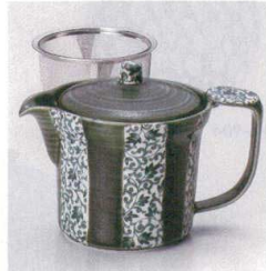
459-9-284 オリベ十草ポット 2,650円 15.5×10.5×11cm(430cc) 48709283