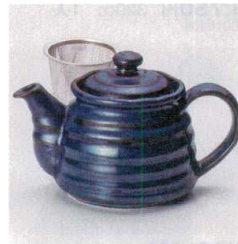
459-26-514 なまこポット Uカゴ付 1,900円 480cc 6入 48717513