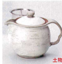
459-15-364 白刷毛目2.5号ポット(U) 2,400円 15.5×11×12cm(480cc) 6入 51006361