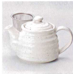
459-25-514 粉引ポット Uカゴ付 1,900円 480cc 6入 48718513