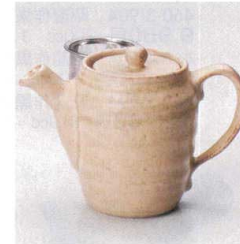
459-17-514 淡茶ポット(U)付 2,300円 460cc 6入 51019511