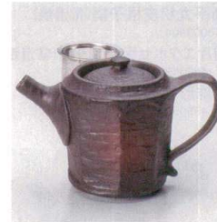
459-16-514 黒伊賀ポット(U)付 2,300円 460cc 6入 51003511