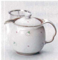
459-13-364 豆うさぎポット 2,400円 15.5×11×12cm(480cc) 6入 52219362