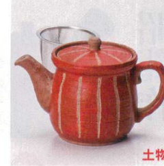
459-6-714 畵クサ(赤)ポット(大)(アミ付) 3,200円 500cc 51008711 459-7-714 畵クサ(赤)ポット(小)(アミ付) 3,000円 365cc 51007711