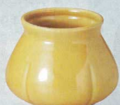
468-34-694 骨入(有田焼) 3,550円 12.5×9.5cm 37534692