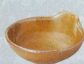
468-37-694 安楽 手付とんすい (有田焼) 1,600円 12.5×5cm 37537692