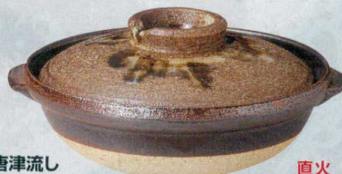
唐津流し 468-8-694 5.5号土鍋(有田焼) 5,200円 17×9.5cm 37508692 468-9-694 6.5号土鍋(有田焼) 6,600円 19×10cm 37509692 468-10-694 8号土鍋(有田焼) 15,700円 24×13cm 37510692 468-11-694 9号土鍋(有田焼) 21,000円 27×14cm 37511692 468-12-694 10号土鍋(有田焼) 28,000円 30×14.5cm 37512692 468-13-694 11号土鍋(有田焼) 32,500円 32.5×17cm 37513692