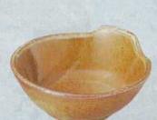
468-38-694 安楽 手付反とんすい (有田焼) 1,600円 12×5cm 37538692