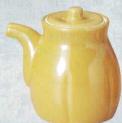
468-33-694 ボンス(有田焼) 4,700円 9.5×12cm (400cc) 37533692