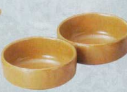
468-36-694 丸二品 薬味入 (有田焼) 2,500円 16.5×8.5×3.5cm 37536692