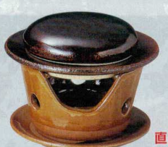
468-29-694 穴あき石焼 一式(有田焼) 3,800円 10.5×3cm・穴あき皿15.5×2cm 37529692 468-30-694 コンロ台一式(丸小)(有田焼) 3,850円 12×7.8cm・台皿14×1.7cm 燃料入8×2.5cm 37530692