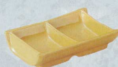
468-32-694 竹型二品 薬味入(有田焼) 2,500円 14.5×9×3.5cm 37532692