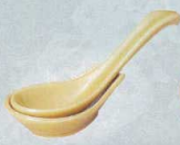
468-35-694 安楽 台付レンゲ(小) (有田焼) 2,250円 5×1.5cm・台皿×9×6.5×3cm 37535692