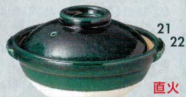
468-21-694 グリーン交趾5号土鍋(有田焼) 6,900円 15×4cm 37521692 468-22-694 グリーン交趾6.5号土鍋(有田焼) 8,900円 16.5×3cm 37522692 468-23-694 グリーン交趾4.3号土鍋(有田焼) 6,900円 13.5×3cm 37523692 468-24-694 グリーンコンロ一式(有田焼) 5,600円 12×9cm・台皿15×2cm 燃料入6.2×2.5cm 37524692