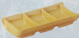
468-31-694 竹型三品 薬味入(有田焼) 3,800円 19×9×3cm 37531692