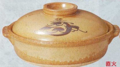
468-1-694 深土鍋10号(有田焼) 25,600円 30×16.5cm 37501692