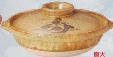
468-2-694 5.5号土鍋(有田焼) 4,100円 17.5×9cm 37502692 468-3-694 6.5号土鍋(有田焼) 5,500円 19×10cm 37503692 468-4-694 8号土鍋(有田焼) 13,000円 24×13cm 37504692 468-5-694 9号土鍋(有田焼) 17,200円 27×14cm 37505692 468-6-694 10号土鍋(有田焼) 23,500円 30×14.5cm 37506692 468-7-694 11号土鍋(有田焼) 27,200円 33×15.5cm 37507692