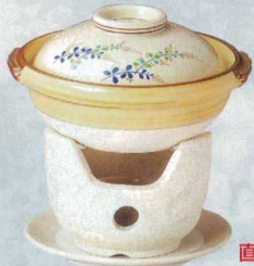
468-26-694 白釉 三方コンロ一式(有田焼) 4,000円 11.5×8cm・台皿14.2×2cm 燃料入6×2.5cm 37526692