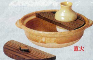
468-28-694 湯豆腐鍋 5.5号(有田焼) 5,000円 17×9.5cm 37528692