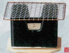
468-27-694 グリーン正角 コンロ一式(網)(有田焼) 9,100円 11.5×11.5×9cm・陶網9.5×9.5×1cm 金網14.5×14.5×0.2cm 37527692