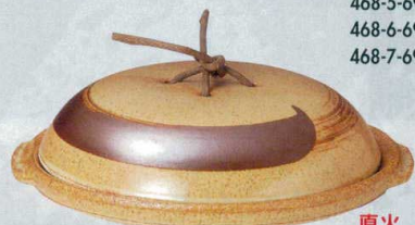
468-14-694 6.5号蓋付陶板(有田焼) 5,000円 19×6cm 37514692 468-15-694 9号蓋付陶板(有田焼) 18,000円 28.5×8cm 37515692 468-16-694 11号蓋付陶板(有田焼) 26,900円 32.5×10cm 37516692