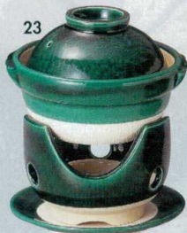
468-25-694 秋金巻京風 5号鍋(有田焼) 7,000円 15×8.5cm 37525692