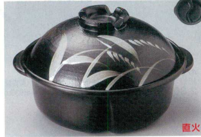
471-10-814 嵯峨野9号仕切鍋(萬古焼) 7,550円 31×φ28×18cm 49921813