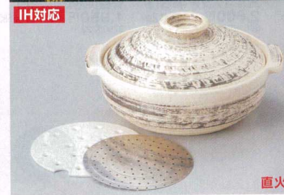
IH対応 471-25-814 錆刷毛目9号IH鍋(萬古焼) 10,500円 31×φ27.3×15.5cm 37711812