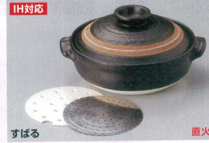
IH対応 すばる 471-26-814 6号IH鍋(萬古焼) 6,500円 22×φ19×11.5cm 36515811 471-27-814 7号IH鍋(萬古焼) 7,850円 25×φ22×13cm 49933813 471-28-814 8号IH鍋(萬古焼) 9,200円 28×φ25×15cm 36516811 471-29-814 9号IH鍋(萬古焼) 10,500円 31.5×φ27.2×16cm 36517811 471-30-814 10号IH鍋(萬古焼) 13,000円 35×φ30.5×17cm 37719812