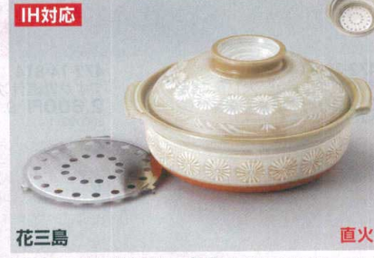
花三島 471-20-814 7号IH鍋(萬古焼) 6,700円 24.5×φ21.5×12.5cm 37712812 471-21-814 8号IH鍋(萬古焼) 7,500円 27.5×φ24.5×14cm 36512811 471-22-814 9号IH鍋(萬古焼) 8,800円 31×φ28×16cm 36513811 471-23-814 10号IH鍋(萬古焼) 12,000円 34×φ30.5×17cm 36514811