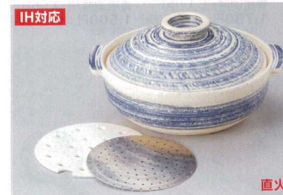
IH対応 471-24-814 呉須刷毛目9号IH鍋(萬古焼) 10,500円 31×φ27.3×15.5cm 37710812