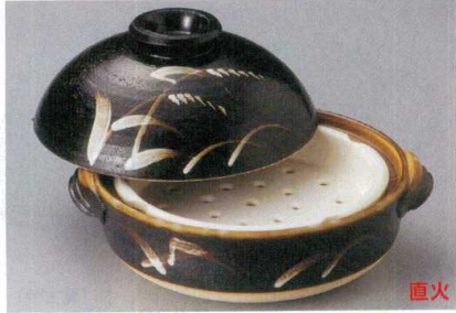
471-3-814 嵯峨野9号むし鍋(萬古焼) 9,800円 33.5×φ28.5×19cm 49849813