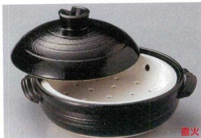
471-1-814 黒釉らせん9号むし鍋(萬古焼) 8,800円 32.5×φ28×18.5cm 49848813