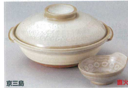
京三島 471-12-814 5.5号鍋(萬古焼) 1,950円 18.5×φ17×9cm 36448811 471-13-814 6号鍋(萬古焼) 2,050円 20.3×φ18.6×10cm 36449811 471-14-814 7号鍋(萬古焼) 3,100円 23×φ21.3×11cm 36450811 471-15-814 8号鍋(萬古焼) 4,000円 26.5×φ24.5×14cm 36451811 471-16-814 9号鍋(萬古焼) 5,400円 29.4×φ27.5×15cm 36452811 471-17-814 10号鍋(萬古焼) 7,650円 32.5×φ30.2×16cm 36453811 471-18-814 11号鍋(萬古焼) 12,000円 36×φ33.8×18cm 36454811 471-19-814 香水(萬古焼) 530円 13.5×12.3×5.7cm 36455811