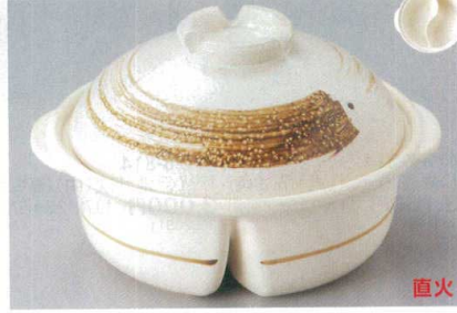
471-11-814 鉄刷毛目9号仕切鍋(萬古焼) 7,550円 31×φ28×18cm 36431811