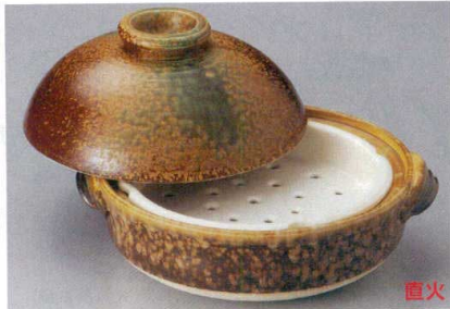
471-2-814 南蛮織部9号むし鍋(萬古焼) 9,300円 33.5×φ28.5×19cm 49850813