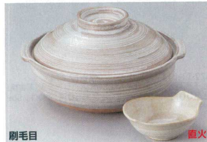
刷毛目 471-4-814 6号鍋(萬古焼) 2,500円 21.7×φ19.5×11.5cm 36458811 471-5-814 7号鍋(萬古焼) 4,000円 24.5×φ22×13cm 36459811 471-6-814 8号鍋(萬古焼) 5,100円 27.5×φ25.2×15cm 36460811 471-7-814 9号鍋(萬古焼) 6,700円 30.7×φ28.3×16.5cm 36461811 471-8-814 10号鍋(萬古焼) 9,400円 33.5×φ31×18.5cm 36462811 471-9-814 香水(萬古焼) 670円 14.6×13×5.5cm 36463811