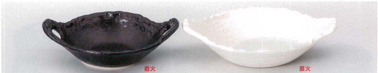
481-1-814 黒6号変形陶板(萬古焼) 1,700円 24.3×18.8×6.8cm 48101814