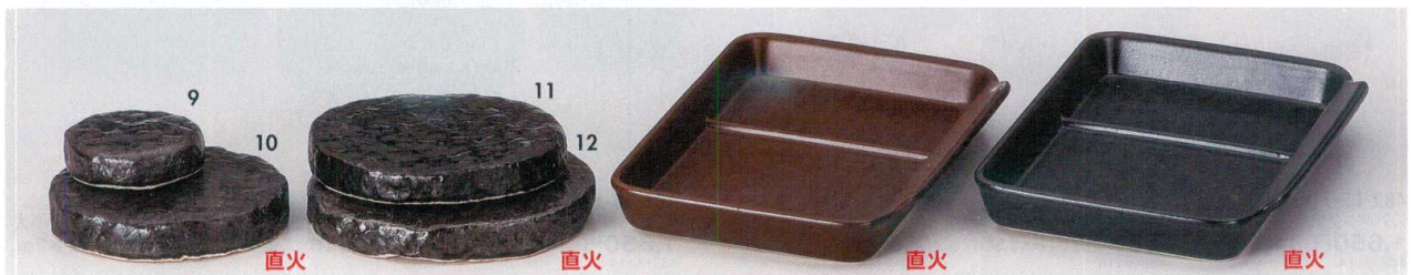
481-9-524 黒織部石焼プレート2.5吋 1,300円 8.5×8×2.4cm 38319522