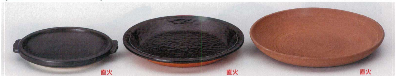
481-15-754 黒うず陶板 2,400円 24×21.7×3.3cm 38713752