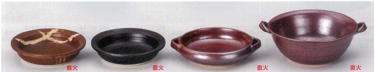
481-5-714 黄瀬戸柳川鍋 1,450円 16.7×3.8cm 48105714