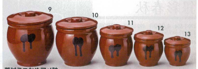
蓋付ミニかめアメ釉

489-5-504 口切3号カメ 960円 10.8×10cm(460cc) 48905504 489-6-504 口切2号カメ 750円 9.8×8.7cm(300cc) 48906504 489-7-504 口切1号カメ 600円 8.3×7.3cm(180cc) 48907504 489-8-504 口切ミニカメ 480円 6.8×6.8cm(120cc) 48908504