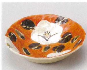
57-13-714 赤濃山茶花5.0鉢 2,050円 15.5×3.6cm 05713714