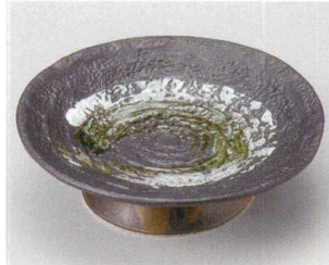
57-4-204 黒備前渦高台6.0皿 2,200円 19.8×6cm 05512203