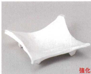
57-11-554 白釉ちぎり向付 2,070円 20×19×4.7cm 30入 06007551