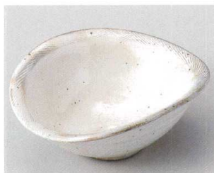
57-20-634 粉引櫛目楕円向付 1,900円 15.6×6cm 06714632

盛鉢 14P~ 楕円鉢 組鉢 38P~ 刺身 向付 46P~ 中鉢 小鉢 64P~ 小付 珍珠 100P~ 細長皿 128P~ 突出皿 焼物皿 142P~ 仕切皿 のり皿 串焼皿 161P~ 盛皿 166P~ 角皿 (鉢替鉢) 174P~ 楕円皿 206P~ 丸皿 212P~ 和皿 前菜皿 丸・楕円 235P~ 組小皿 小皿 252P~ 有田焼大皿 黄古焼大皿 264P~ 粗皿 (大) 270P~ 天皿 吞水 取鉢 280P~ 松花堂 288P~ 蓋向 煮物碗 円菓子鉢 298P~ むし鉢 306P~