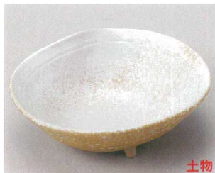
57-16-794 白吹雪片押5.0鉢 2,000円 14.8×12.8×5.3cm 05716794