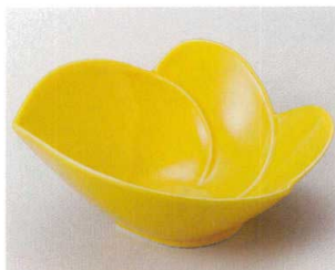
57-15-204 黄交趾かぶ型鉢 2,000円 18.8×15.5×8cm 05411203