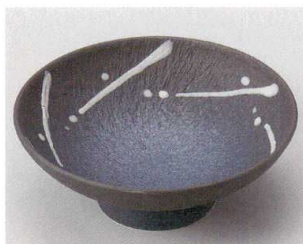
57-14-554 黒釉白一珍トナリ向付 2,050円 16×6cm 05714554