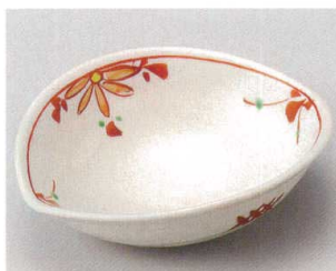
57-19-704 赤絵花つなぎすげ傘向付 1,900円 17.3×15×5.3cm 05719704