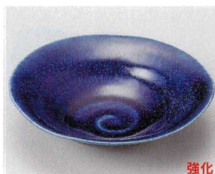
57-17-714 紺勾玉平鉢 1,990円 19.3×5.4cm 05717714