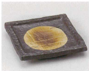
57-10-284 春月角測前菜皿 2,100円 17.5×3cm 40入 18823281