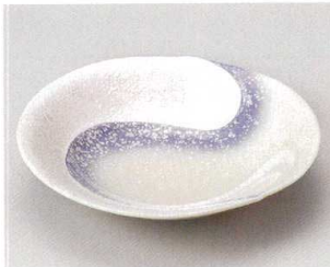
57-1-524 パープル吹ラスター勾玉平鉢(中) 2,250円 16.7×16×4cm 05701524