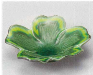
57-12-754 緑釉黄流し花型向付 2,050円 19×5cm 05306753