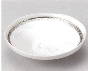
57-3-524 プラチナ彩たわみ5.5寸向付 2,200円 16.7×16.4×4.8cm 05703524