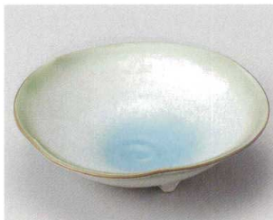
57-7-714 若草三ツ足付6寸浅鉢 2,100円 18×5cm 52611711