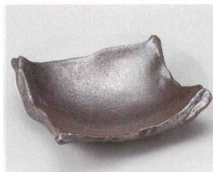
57-9-204 銀サビ黒ちぎり角皿(中) 2,100円 17.7×16×5cm 05216203