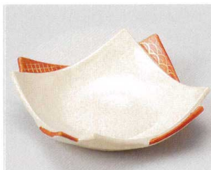
57-5-714 赤絵重ね皿(中) 2,200円 15.5×15.5×4.5cm 05705714