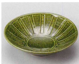
57-18-554 総織部しのぎ5.5平鉢 1,950円 17×4.5cm 60入 06204552