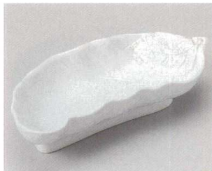
57-8-794 真珠双葉向付 2,100円 23×10×4.8cm 05410793