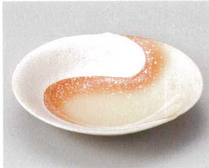
57-2-524 オレンジ吹ラスター勾玉平鉢(中) 2,250円 16.7×16×4cm 05702524