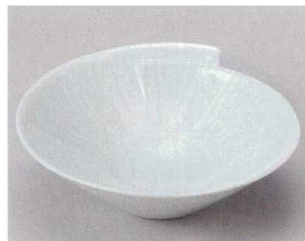
58-19-364 青白磁とじめ向付 1,400円 17×5cm 06208361