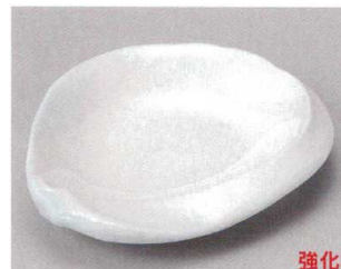
58-8-554 青白磁6.5寸皿 1,760円 20×16.3×3.6cm 40入 06011551