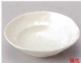
精円皿 206P~ 58-9-704 クリーム向付 1,720円 φ15.7×4.8cm 05809704