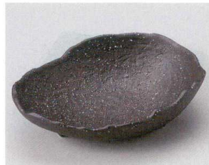
58-11-184 星空三つ足多用鉢 1,700円 19.5×15.2×5.7cm 06117182