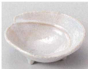
松花堂 288P~ 58-17-114 彩釉三つ足向付 1,480円 18×17×6.5cm 06316112