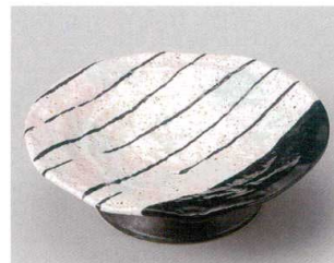
58-16-754 黒塗分けストライプ粉引高台5寸皿 1,500円 16.5×5cm 05816754