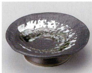
58-6-204 黒備前渦高台5.0皿 1,750円 16×5.3cm 05513203