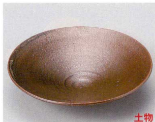
58-14-204 サビ釉高台5.0皿鉢 1,650円 18×4.5cm 05518203