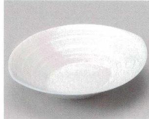
58-3-364 青白磁楕円向付 1,700円 19.5×17×4.2cm 06020361