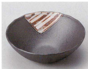
細長皿 128P~ 58-5-794 黒伊賀十草サラダ鉢(大) 1,880円 15.3×5.3cm 06107793