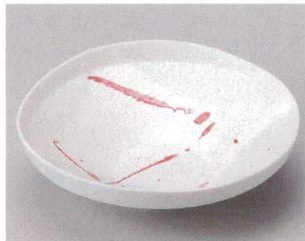
58-10-554 赤散ラスター5.5たわみ鉢 1,800円 16.5×16.3×4.5cm 05810554