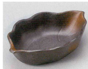
58-20-624 備前葉型中鉢 1,150円 21.5×13×4.6cm 06307621

精円鉢 組鉢 38P~ 刺身向付 46P~ 中鉢 小鉢 64P~ 小付 珍珠 100P~