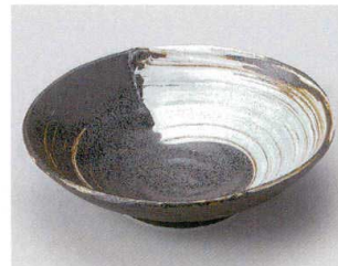
58-12-554 豪快・白舞煮物鉢 1,700円 23.5×22×4.3cm 05812554