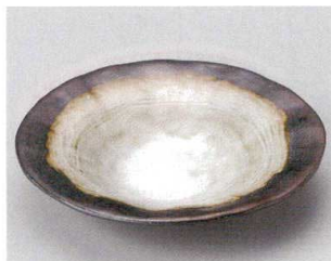
58-18-204 窯変金彩ストライプ7.0皿 1,400円 19.7×4.2cm 05217203