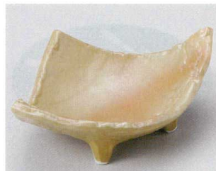
58-15-524 緋色吹三角刺身鉢 1,600円 20.8×16.1×7.8cm 06305522