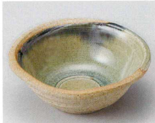
盛鉢 14P~ 58-1-794 まりも5.0玉鉢 1,800円 16×15.5×6.1cm 06005791