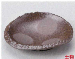
組皿(大) 270P~ 58-13-524 炭化土丸向付 1,650円 19×18.5×4.5cm 06112521