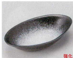
58-7-794 雲海7.0小判鉢 1,750円 21.3×12.8×4cm 55406781