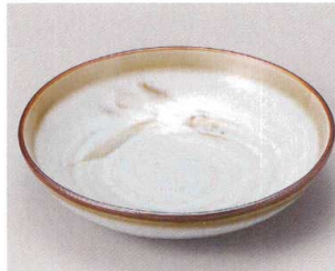
59-7-204 白天目麦6.0おでん皿 1,300円 18×4.5cm 56763201