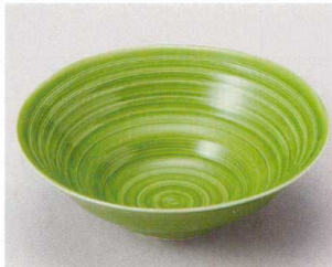
59-10-634 緑釉櫛目煮物鉢 1,100円 16.5×5.6cm 06415633