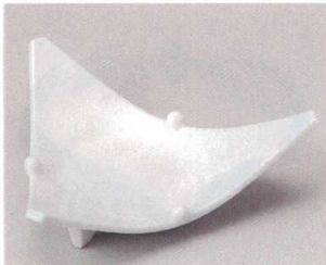
59-5-554 青磁玉付三角向付 1,410円 20.5×5.5cm 06317552