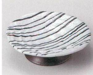
59-3-214 残雪高台皿 1,550円 16.7×4.5cm 05903214