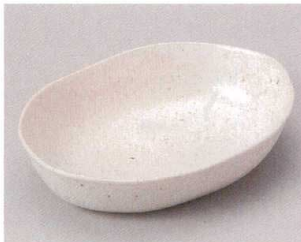
59-18-634 白釉18cm長鉢 800円 18×13.5×4.5cm 06725631