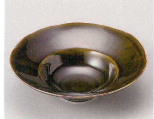
59-4-184 織部5.5ボール 1,350円 16×15×4.7cm 06407182