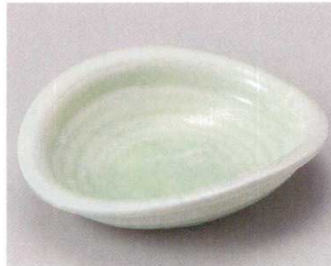
59-15-374 もえぎたわみ型5.0鉢 1,100円 16.8×15×4.8cm 06517372