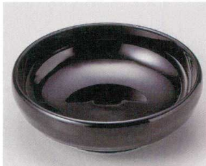
59-14-184 黒釉5.5寸鉢 880円 16.8×5.8cm 06720183