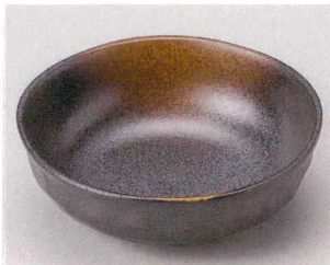
59-17-054 黒備前金茶吹石垣5.5鉢 750円 16.9×5.8cm 03020051