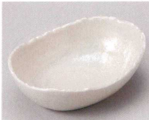
59-13-634 粉引夕円5.0小鉢 890円 17.3×13×5cm 06718611