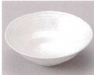
59-11-634 白磁櫛目煮物鉢 990円 16.5×5.6cm 06416633