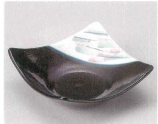
59-8-374 涼風中鉢(美濃焼) 1,120円 16×16×5.5cm 05419373