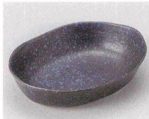
59-19-634 銀彩黒18cm長鉢 800円 18×13.5×4.5cm 06724631