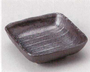
59-1-504 南蛮天目足付5.5鉢 1,200円 16×16×5cm 05901504