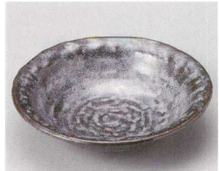
59-12-204 聖石5.0鉢 950円 16.8×4.2cm 55139201