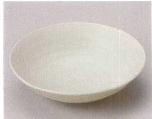
59-20-204 いこい5.0鉢 460円 17.6×5.3cm 07311202