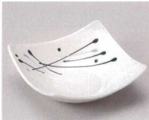
59-9-374 流星中鉢(美濃焼) 1,120円 16×16×5.5cm 06411373