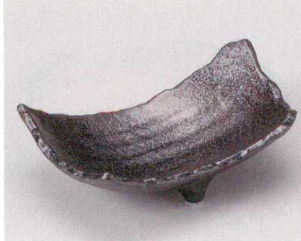
59-2-554 ゆず黒三つ足変形皿 1,350円 18.7×13×6.5cm 05902554