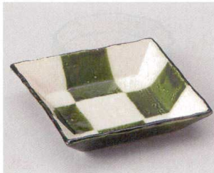
59-6-204 織部格子四角鉢(中) 1,100円 15.6×3.4cm 07002202