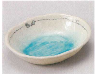
59-16-554 クレヨンブルー楕円鉢 760円 17.8×14.5×3.5cm 80入 24312552