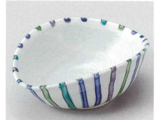
60-4-204 色十草楕円向付 3,900円 14.5×11×5.7cm 05614203