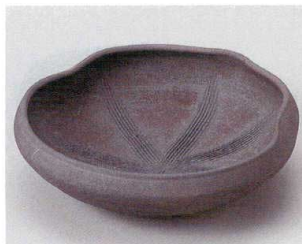
60-18-274 黒陶ヒサゴ型向付 2,860円 13.8×13.5×4cm 05715273