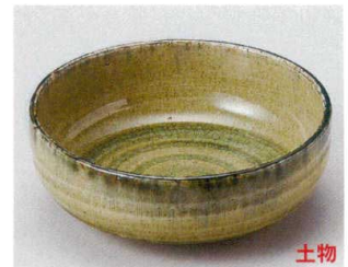
60-20-714 灰袖5.5鉢 2,450円 16×6cm 03102711