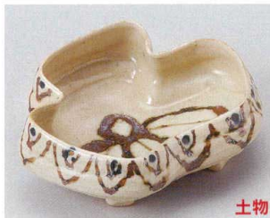
60-14-214 唐津雲型向付 2,800円 16×12.3×5.2cm 06014214