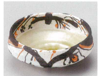
60-8-204 弥七田三ツ押向付 3,050円 13.5×5.7cm 05417201