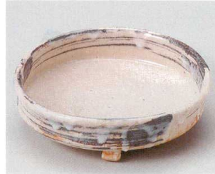
60-3-284 手びねり志野ピンク向付 4,800円 14×4.5cm 20入 06003284