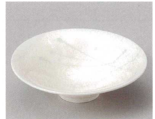
60-12-514 白結晶平鉢 2,900円 15×4.2cm 05712511