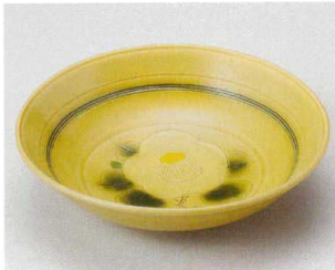
盛鉢 14P~ 60-1-364 黄瀬戸椿画大鉢 4,950円 17.7×5.1cm 06001364