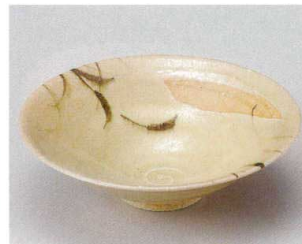
60-19-554 黄灰袖草花紋5.5向付 2,480円 17.8×5cm 40入 06002552