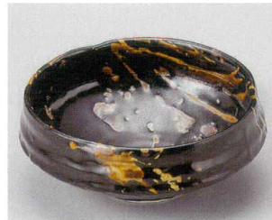
60-11-204 ゴールド線模様三ツ押向付 2,900円 13.5×5.6cm 06011204