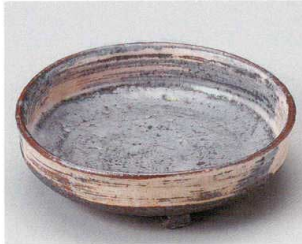
60-2-284 手びねり志野黒向付 4,800円 14×4.5cm 20入 06002284