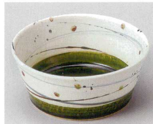
60-15-284 織部乱線切立鉢 中 2,700円 14.8×6.4cm 50入 06015284