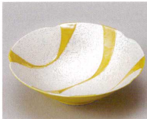
60-10-694 黄輪流ラスター-花型多用鉢(有田焼) 3,000円 15.6×4.5cm 5入 06010694