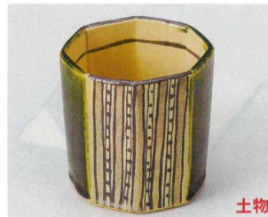
60-7-364 織部十草筒型向付 3,600円 10×10cm 05505361