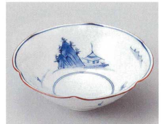
60-16-694 洗琳山水なぶり平小鉢(有田焼) 2,650円 15×5cm 5入 07607691