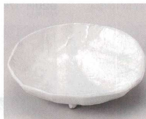
63-19-674 粉引手折三ツ足向付 720円 16.4×4.3cm 06420671