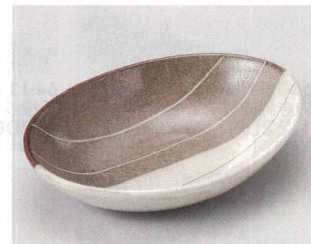
63-12-794 黒化粧晩夏フルーツ鉢 1,150円 17×12.5×3.3cm 06501793