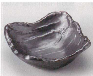
63-17-374 銀河荒ソギ小鉢 800円 14×14×5cm 06219372