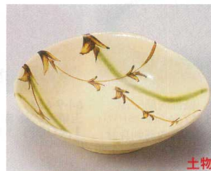
63-7-714 草紋織部トジメ浅鉢 1,250円 14.6×13.4×4.7cm 06813711