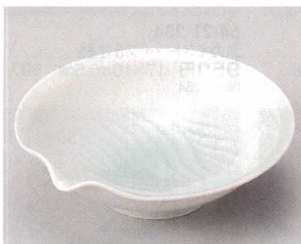
63-13-214 青白瓷彫片口5.5鉢 1,150円 17×16×5cm 06310211