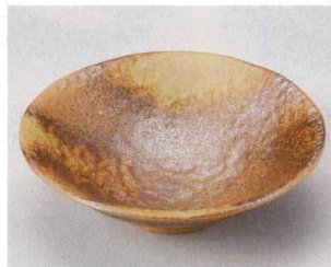
63-10-374 美膳岩向付 1,200円 15.3×4.5cm 06306371