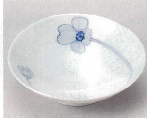
63-2-214 花絵楕円皿 1,400円 15.9×15.7×5.2cm 06212213