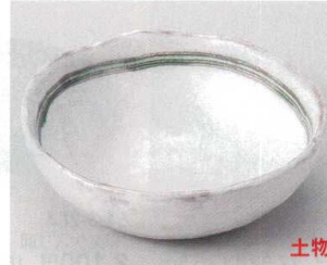
63-3-714 あおい5.0鉢 1,350円 14.8×14.4×5cm 06305713