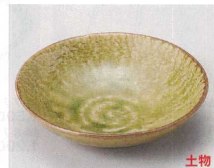
63-8-524 灰釉布目5.5浅鉢 1,250円 16.5×4.3cm 06218521