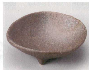
63-20-364 黒伊賀三ツ足向付 640円 14.5×14×4.5cm 07422361