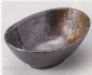
63-1-354 南蛮吹流し石目楕円鉢 小 1,410円 16.8×12.1×6.4cm 06316351