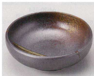
63-14-354 南蛮吹流し5.5ボール 1,030円 17×5.6cm 02920351