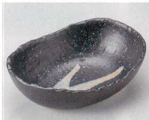
63-9-204 銀彩黒楕円5.0鉢 1,200円 17.5×13.4×5.1cm 06314201