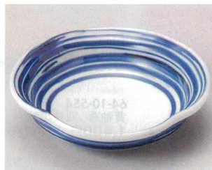
63-6-204 呉須巻変形5.0鉢 1,260円 15.3×14.8×4cm 06910202