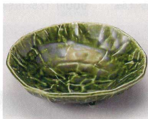
63-18-674 織部手折三ツ足向付 720円 16.4×4.3cm 06419671