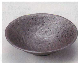
63-15-374 こげ茶水晶向付 1,100円 15.3×4.5cm 06410371