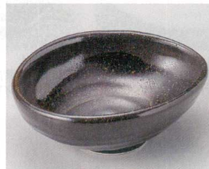
63-11-204 黄河たまご5.0鉢 1,150円 17×14×5.8cm 06319201