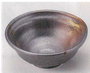
63-5-354 南蛮吹流しなぶり向付 1,290円 16.1×15.1×6.3cm 06714351