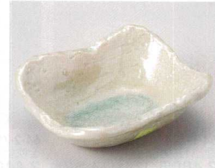
63-4-374 みちのく四角鉢 1,300円 15.5×13.5×5cm 07817372